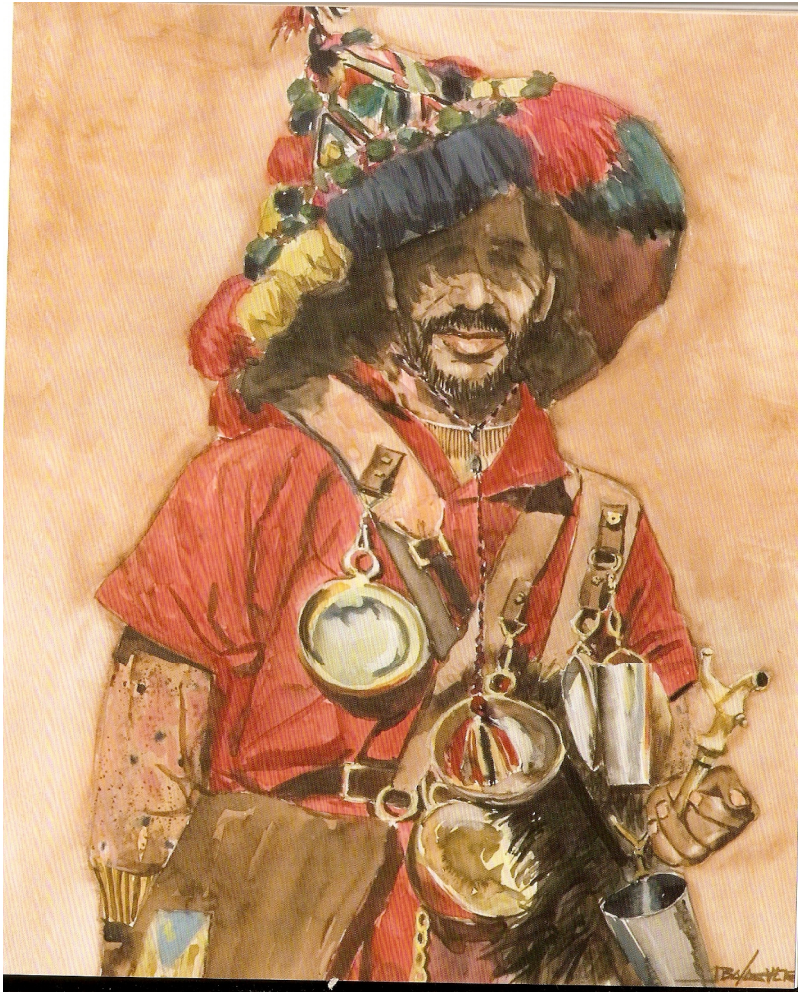
Aguador de Marrakech. Acuarela sobre papel.