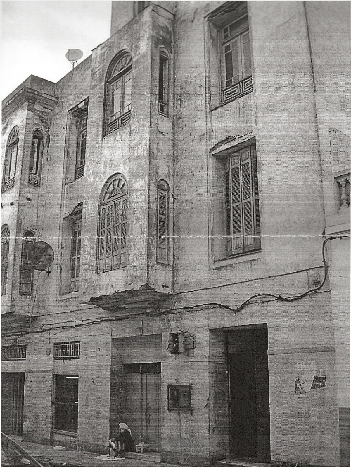
La casa donde vivió Čane en Sarajevo (en los años 40, con Marija y Boujfaus (Bataquer sus primos))