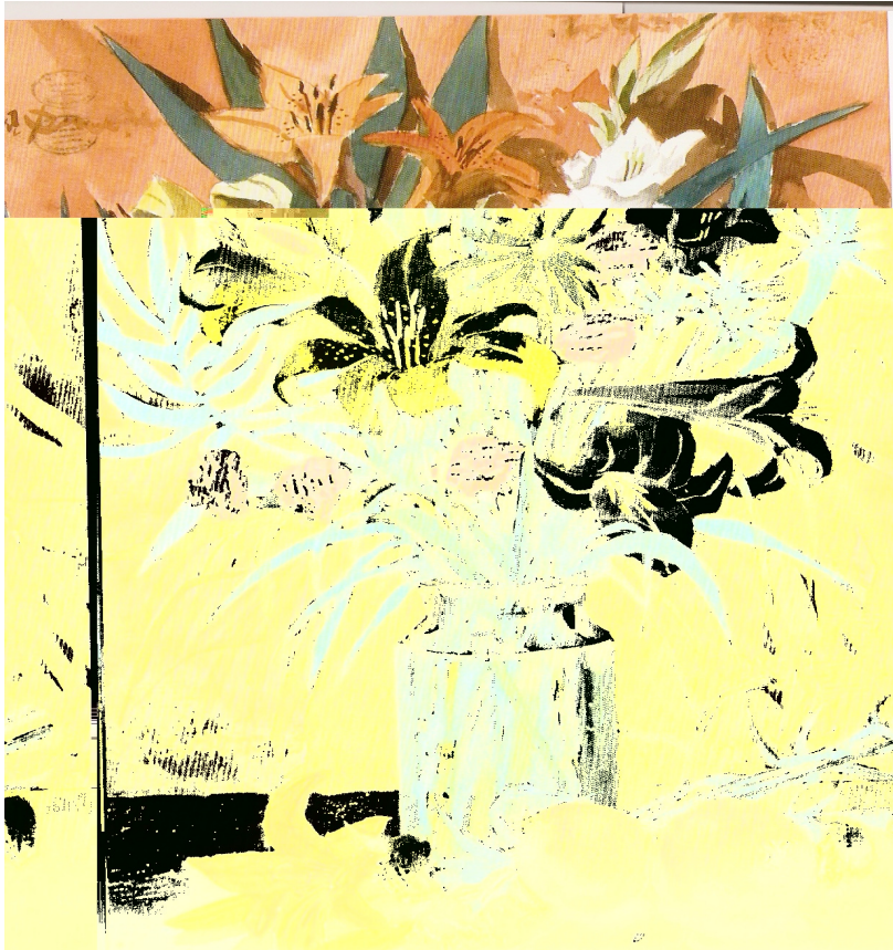
Flores y granadas secas. Acuarela sobre cartón.