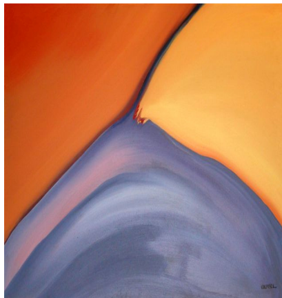
Pintura de Berbel