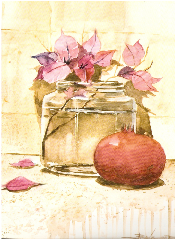
Bougambilla y granada. Acuarela sobre papel. Manuel Balaguer