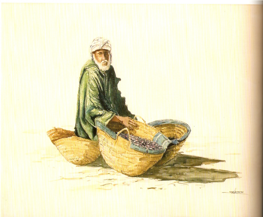
Vendedor de frutas. Acuarela sobre papel. Manuel Balaguer