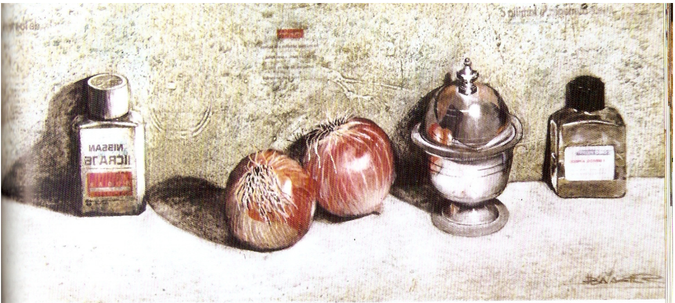
Bodegón con azucarero moruno. Técnica mixta sobre cartón. Manuel Balaguer