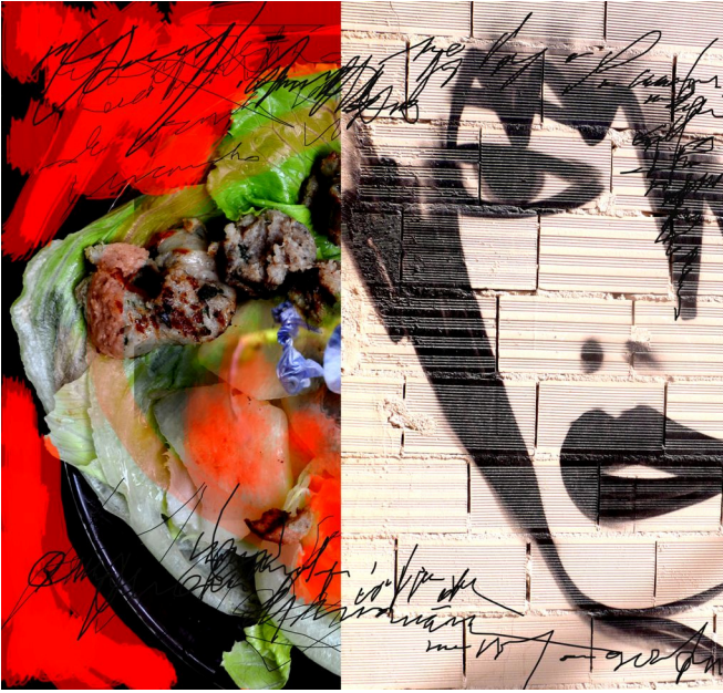
Composición de Sira Ascanio