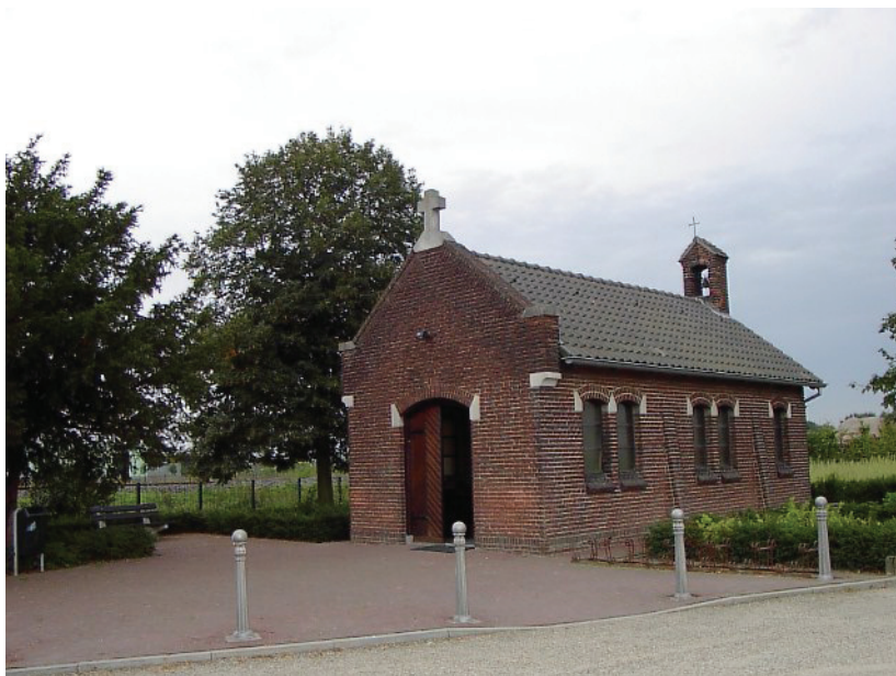
In Geloë sjteit 'n kepèlke