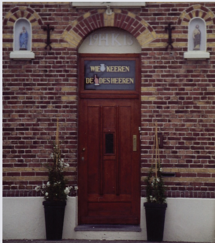
Welke vermaning staat te lezen in het bovenlicht van dit huis in Klimmen? *)