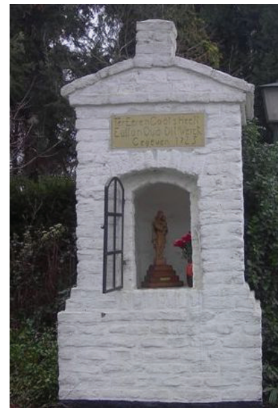
Het Middelhaover Kepelke