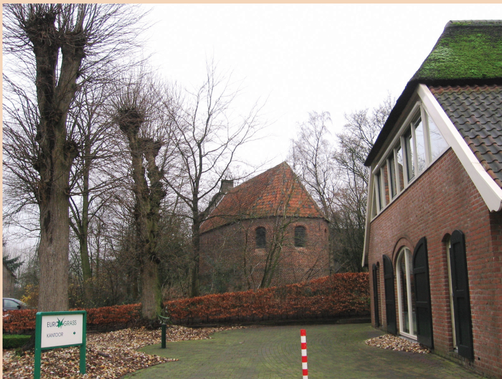
De kapel is thans eigendom van Eurogras