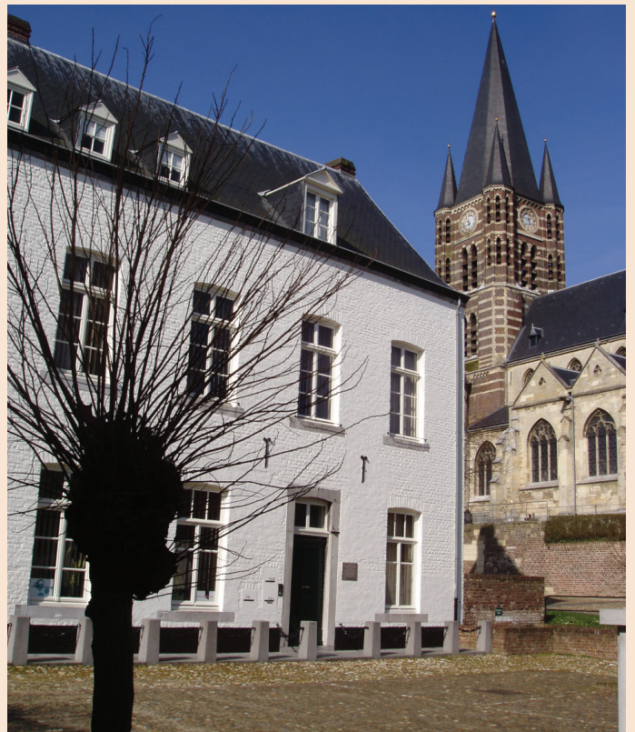
Het onderkomen van de Monumentenwacht in Thorn