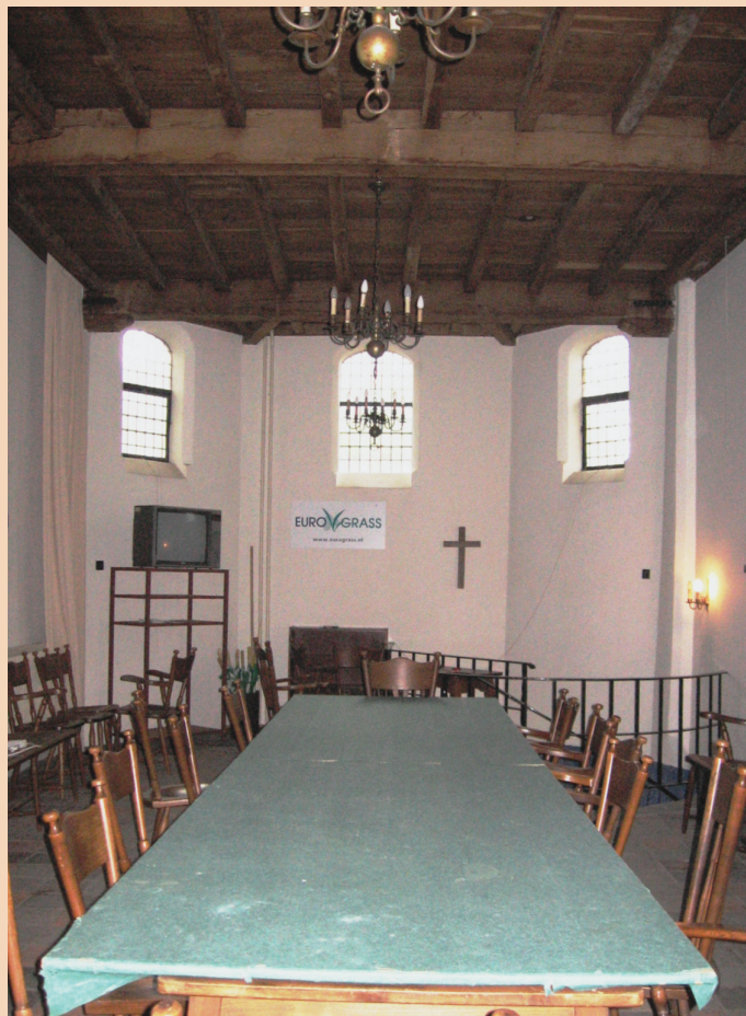
De kapel in gebruik als vergaderzaal

Het betreft hier een forse kapel. Zij oogt niet alleen groot omdat ze op een terp van ongeveer twee meter hoogte staat, ook haar maten zijn aanzienlijk. Zij is twaalf meter lang en ruim vijf meter breed, en het balkenplafond ligt op drie-en-eenhalf meter hoogte. Voorwaar een vorstelijke vergaderkamer! De muren zijn een halve meter dik en het baksteenformaat van 24 ½ centimeter sluit aan bij de bouwtijd van rond 1600.