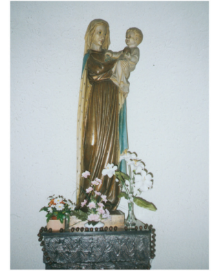
Uit Nieuwsbrief 32 van oktober 2006