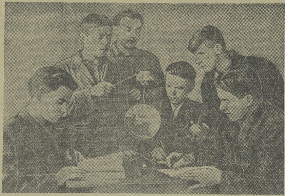
Успешно проходят экзамены на аттестат зрелости в 10-м классе Молчановской средней школы. Из 16 десятиклассников никто не получил ни одной неудовлетворительной оценки. Половина учащихся сдает экзамены только на оценки «четыре» и «пять».

Наша бригада удерживает первое место в соревновании трактористов Ювалинской МТС.