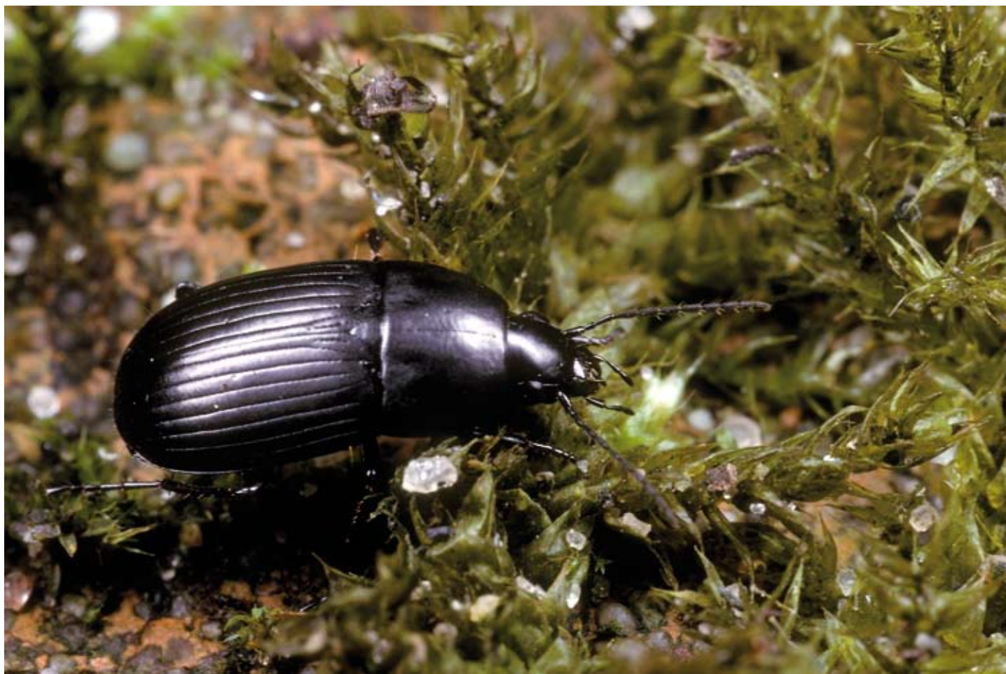
Figuur 8. Oodes heliopioides is in de Millingerwaard een onderscheidende soort voor de vegetatie van een opgedroogde poel.

Oodes heliopioides is in the Millingerwaard a differentiating species for the vegetation in a dried puddle.