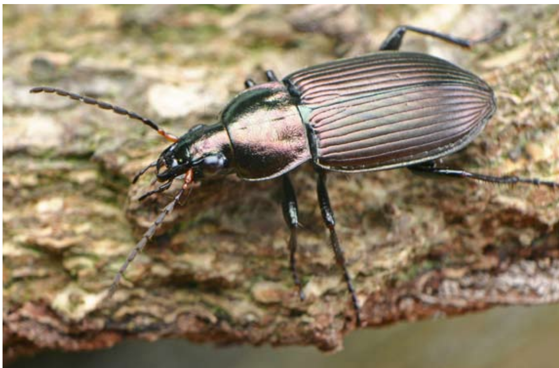
Figuur 4. Poecilus cupreus , de meest gevangen loopkever in de onderzochte vegetatiegradiënt. Poecilus cupreus , the most frequently caught ground beetle species in the studied vegetation gradient.

Op de oeverwal zijn enkele zeldzame soorten aangetroffen die typerend zijn voor zandige plekken, te weten Microlestes minutulus , M. maurus en Dyschirius angustatus . Op de komgronden achter de oeverwal [9] zijn vijf exemplaren van Amara kulti gevonden. Deze soort is pas sinds kort bekend voor de Nederlandse fauna (Turin 2000). In dezelfde vochtige ruige graslanden [9] is ook Amara eurynota aangetroffen, een zeldzame soort die sterk achteruit lijkt te gaan (Desender & Turin 1989).