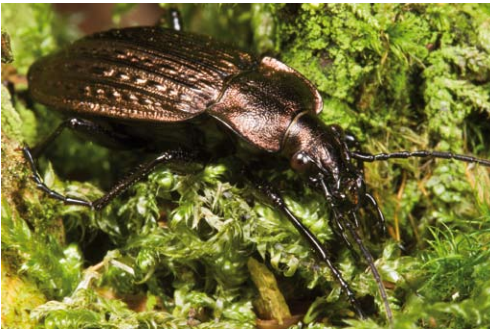
Figuur 7. Carabus granulatus is in veel plantengemeenschappen gevonden, maar het meest in het natte bos en de drooggevalle poel. Carabus granulatus was found in a number of vegetation types, but occurred most in the wet forest and the dried puddle.

Binnen het transect is een loopkevergemeenschap vaak beperkt tot een of enkele plantengemeenschappen (figuur 6). Om meer inzicht te krijgen in onderliggende patronen is met behulp van multivariate analyses (CCA; Ter Braak & Šmilauer 2003) de relatie onderzocht tussen de loopkeversamenstelling en mogelijk verklarende milieu- en vegetatiestructuurvariabelen. De samenstelling van de loopkevervangsten bleek voor een belangrijk deel samen te hangen met de structuurvariabelen 'onbegroeide oppervlakte' en 'vegetatiehoogte' en met het 'lutumgehalte' (percentage bodemdeeltjes kleiner dan 2 µm), 'vochtgehalte' en 'inundatiefrequentie'. De vegetatie rondom de vangpotten reageert min of meer op dezelfde milieuvariabelen. In eerste instantie op het 'vochtgehalte', gevolgd door 'voedselrijkheid', 'inundatiefrequentie' en het 'lutumgehalte'.