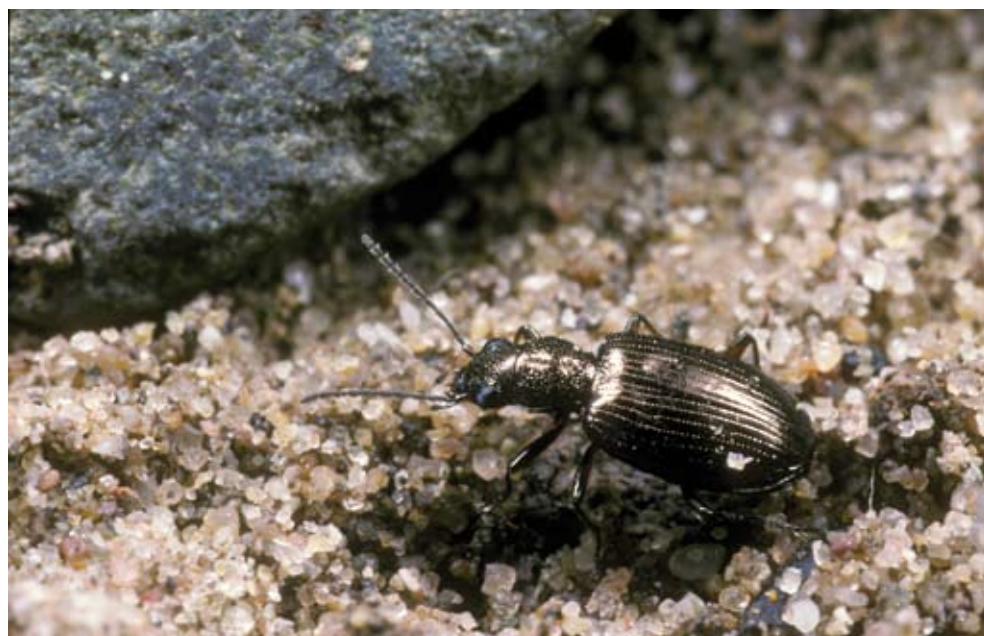
Figuur 5. Bembidion punctulatum is een specifieke soort van onbegroeide rivieroevers. Bembidion punctulatum is a characteristic species of bare river banks.

livens (zeldzame soorten van natte (ooi)bossen). Badister peltatus is een zeldzame soort van oevers met een schaduwrijke vegetatie. Opvallend is dat een aantal van deze soorten ( Bembidion harpaloides , Badister peltatus ) zowel op de beschaduwde rivieroever als in het natte wilgenbos voorkomt, ondanks het vrijwel ontbreken van ondergroei in de eerste plantengemeenschap.