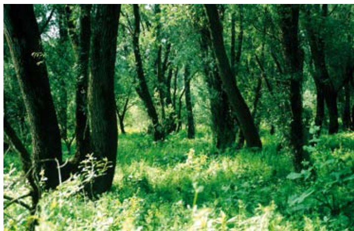
Figuur 3. De twee meest contrasterende habitats in het bemonsterde gradiënt: a de kale rivieroever waar onder andere Bembidion velox , Tachys parvulus en Cicindela hybrida voorkomen, b het wilgenooibos waar onder andere Badister unipustulatus , Bembidion harpaloides en Platynus livens voorkomen. The two most contrasting habitats in the sampled gradient: a the bare river bank where species like Bembidion velox , Tachys parvulus and Cicindela hybrida occur, b the wet willow forest where species like Badister unipustulatus , Bembidion harpaloides and Platynus livens occur.