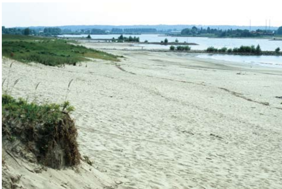
Figuur 1. In de Millingerwaard heeft de Waal een grote invloed op de geomorfologie en de vegetatie. The river Waal has a significant influence on geomorphology and the vegetation in the Millingerwaard, Gelderland.

gende habitattypen en vegetatiezonering. In het voorjaar van 2004 hebben we langs een transect loodrecht op de rivier zowel het voorkomen van de loopkeversoorten als de relatie tussen loopkeversamenstelling, vegetatiesamenstelling, vegetatiestructuur en milieufactoren onderzocht.