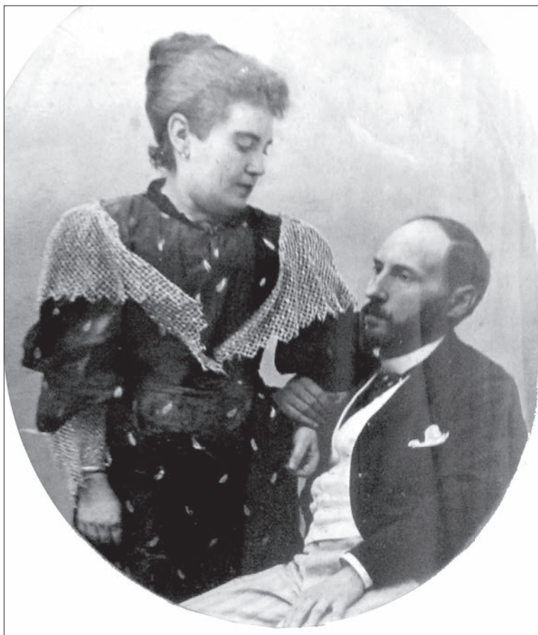
Ilustración número 1. Silveria Fañanás García y Santiago Ramón y Cajal. Autorretrato.

En 1875 Santiago deja a una novia que mostraba dudas evidentes para seguir la relación: “Convaleciente del paludismo enfermo y licenciado distaba yo de ser lo que se llama un buen