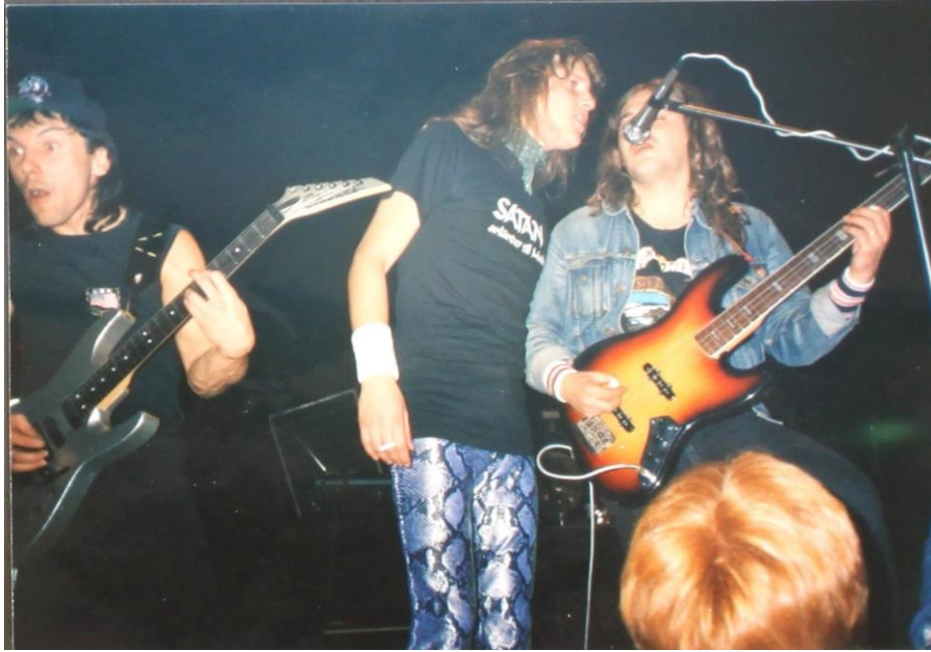
Obrázek č. 8: Soubor Nero během vystoupení v roce 1990, zdroj: soukromý archiv Jiřího Humla.