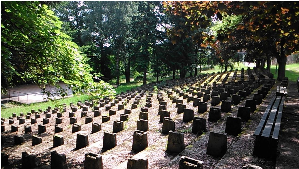
Obrázek č. 11: Letní amfiteátr v Hlavici v roce 2014, zdroj: soukromý archiv autora práce.