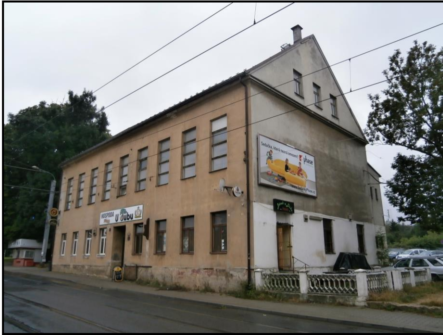
Obrázek č. 10: Budova bývalé Osvětové besedy v liberecké čtvrti Dolní Hanychov, zdroj: soukromý archiv autora práce.