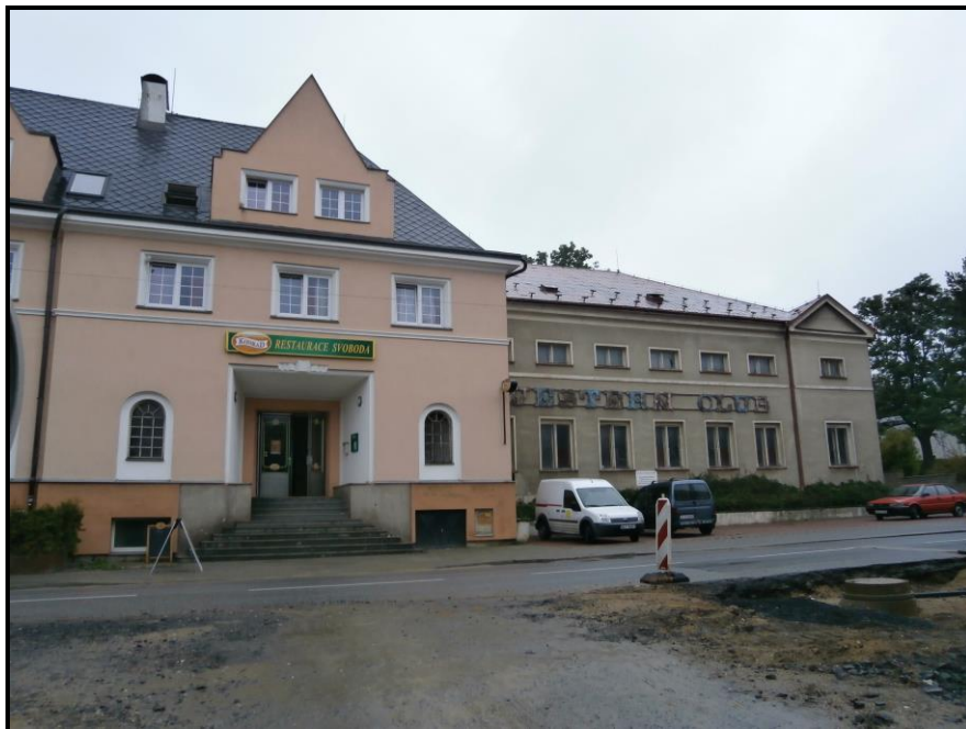
Obrázek č. 9: Budova bývalého Závodního klubu ROH Bytex ve Vratislavicích nad Nisou v roce 2014, zdroj: soukromý archiv autora práce.