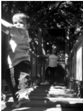
El nombre d'infants i la seva edat determinen el nombre d'adults acompanyants.

Als annexos del web trobareu un article relacionat amb l'organització de sortides a l'entorn a l'EI.