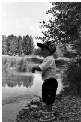
Amb les colònies d'estiu es facilita el joc a la natura i s'afavoreix el desenvolupament de l'infant, que interactua amb el medi ambient que l'envolta.

Hi pot haver campaments preinstal·lats totalment o parcialment en zones prèviament habilitades o bé campaments mòbils en els quals els infants ajuden a muntar-los amb els objectius principals de tenir un contacte directe amb la natura i de capacitar els infants per adaptar-se a un estil de vida més auster. Però aquesta diferència gairebé no existeix a l'actualitat. Es realitzen campaments en edificis convencionals com les colònies.