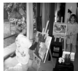
El taller de pintura