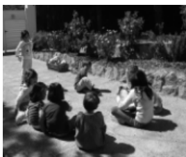
Promoure la relació amb els altres és molt important en les activitats educatives en el lleure