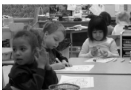
Les activitats extraescolars poden ser molt variades

També hi ha entitats i empreses privades dedicades a oferir activitats als infants fora de l'horari escolar. Se solen fer als centres educatius, ja que així els infants no s'han de traslladar, o en equipaments municipals. Últimament s'han creat moltes empreses privades especialitzades a oferir activitats de lleure tot l'any. Moltes d'aquestes empreses també acostumen a cobrir la vigilància de menjador. Disposen d'un web que els permet fer publicitat dels serveis que ofereixen. Els interessats també el poden fer servir per posar-s'hi en contacte.