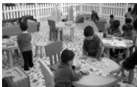
Els tallers estimulen la creativitat

Per fabricar joguines es necessiten diversos materials específics. Com que la majoria no poden estar a l'abast dels petits, s'hauran de desar en una prestatgeria alta o en algun altre espai segur (cola, tisores grans, grapedores, cúters, etc.).