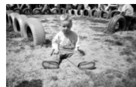
Moltes de les activitats dels casals es fan a l'aire lliure

S'han de preveure i organitzar els espais per fer jocs individuals i en grups petits. També s'haurà de tenir en compte la selecció de jocs, sobretot si els grups són heterogenis.