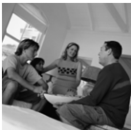
L'educador ha de saber dialogar

Diversos estudis fets per promoure els jocs cooperatius. Després s'ha pogut constatar, en el joc lliure d'aquests infants, un increment en les interaccions verbals positives i un increment del contacte físic positiu entre ells, especialment amb els discapacitats. Paral·lelament, es va observar una disminució del contacte físic negatiu i de les interaccions verbals negatives. També es va constatar un increment de les conductes prosocials i una disminució de l'agressivitat. Per tant, els infants també aplicaven les interaccions positives entre els infants promogudes durant els jocs cooperatius en altres contextos de joc.