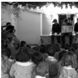
L'observador extern afegeix objectivitat a l'observació.