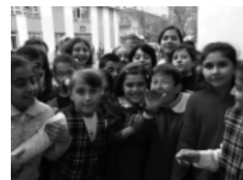
Les normes són necessàries per conviure

La intervenció de l'educador en les situacions de conflicte ha d'anar adreçada a ensenyar als infants a arribar a acords, a negociar o compartir i d'aquesta forma, arribaran a ser capaços de resoldre per si mateixos els seus conflictes.