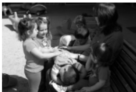
L'educador aportarà elements als infants perquè resolguin els seus conflictes de forma constructiva.

Des d'un punt de vista constructivista de l'aprenentatge, no es poden considerar problemàtiques les situacions associades a moments específics en cadascun dels processos que es recorren per a aconseguir-los. Això, però, no significa que no es necessitin intervencions ajustades per superar-les. Precisament, l'enfocament educatiu es refereix a aprofitar aquestes situacions problemàtiques com a mecanismes de retroalimentació positiva, mentre que provoquen la necessitat de dissenyar estratègies resolutives vàlides. El problema, per Piaget, és l'avantsala necessària per al coneixement, ja que implica l'assimilació de les claus que intervenen en aquella situació i l'acomodació del pensament cap a una estratègia adequada. Així, per exemple, per superar una situació de conflicte en l'ús d'una mateixa joguina per més d'un infant, es pot, no solament establir un torn, sinó fer que aquest torn impliqui una aportació de cadascun dels infants per tal de millorar l'ús d'aquesta mateixa joguina. Per exemple, un puzle i les peces que té pot implicar, a l'hora de repartir-les entre els infants, no solament una oportunitat de col·laborar, sinó fins i tot de cooperar cap a un bé únic i comú, és a dir, construir el puzle.