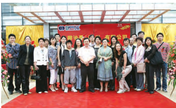
■ 來賓一同合照留念。