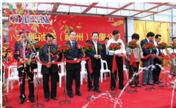
■ 多位市縣領導出席剪綵儀式，一同祝賀福州大興油墨有限公司順利投產。