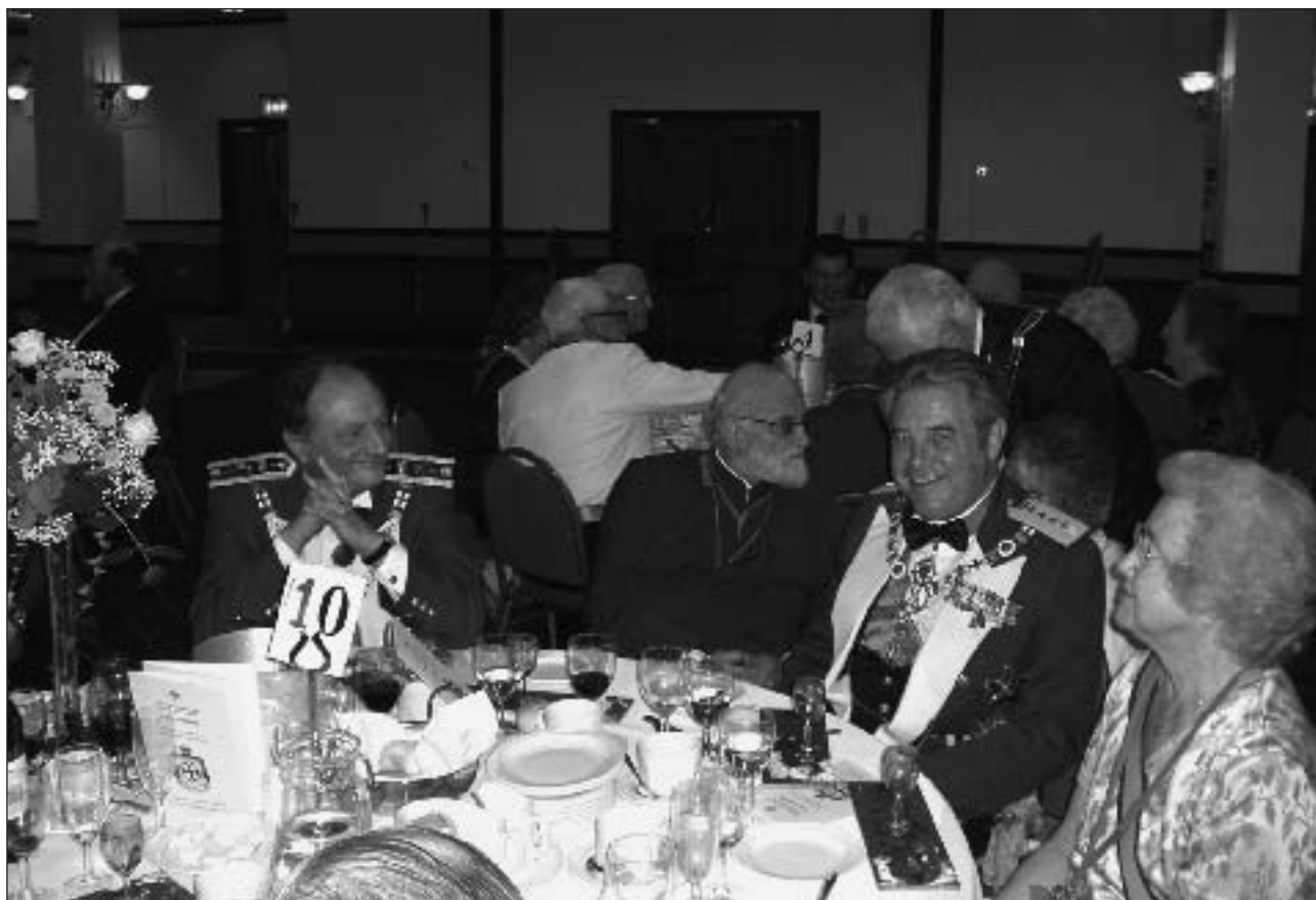
Mesa del Gran Maestre.