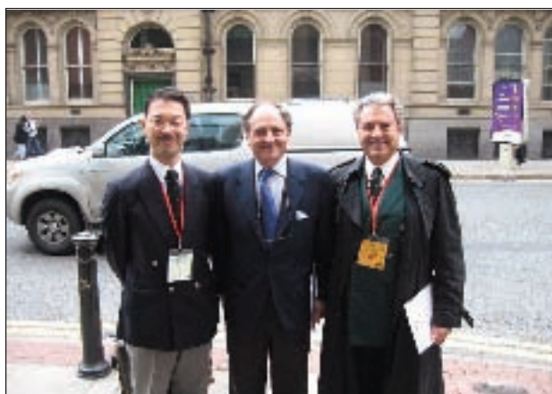
El Marqués de Almazán junto al Duque de Sevilla y el barón Okabe.