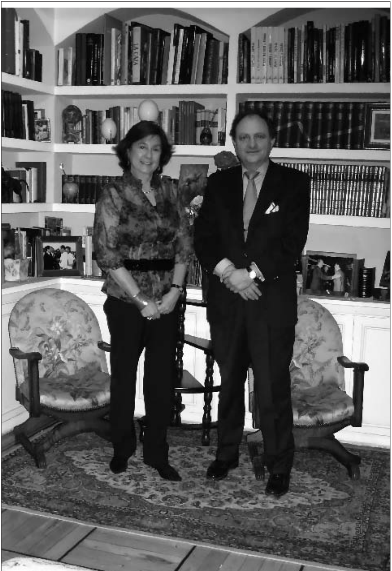
Los Marqueses de Almazán.