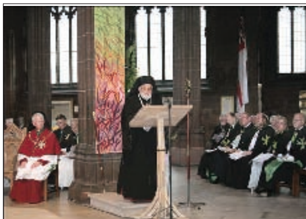
Oración del Patriarca.