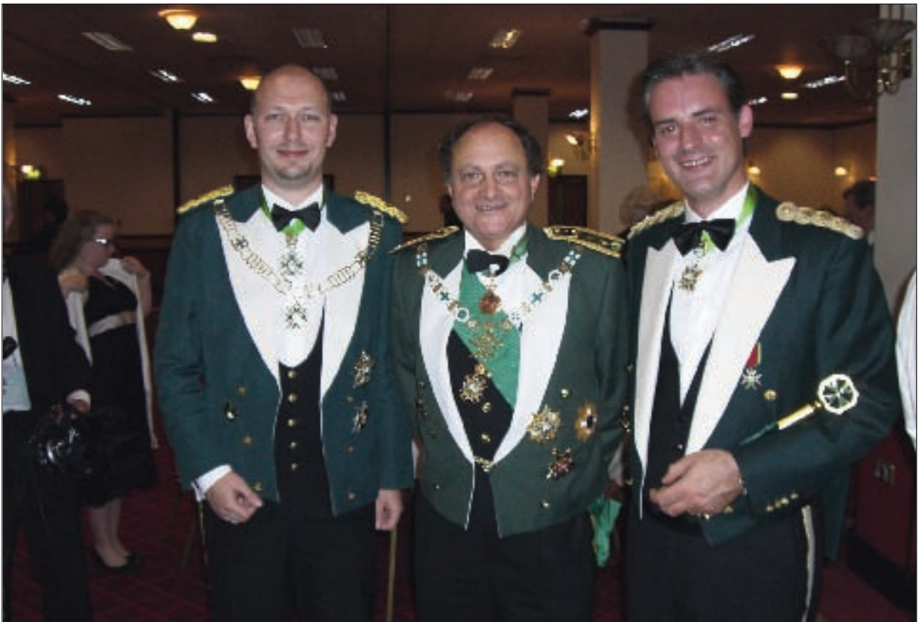
El Gran Maestre posa junto a dos caballeros de la Orden.