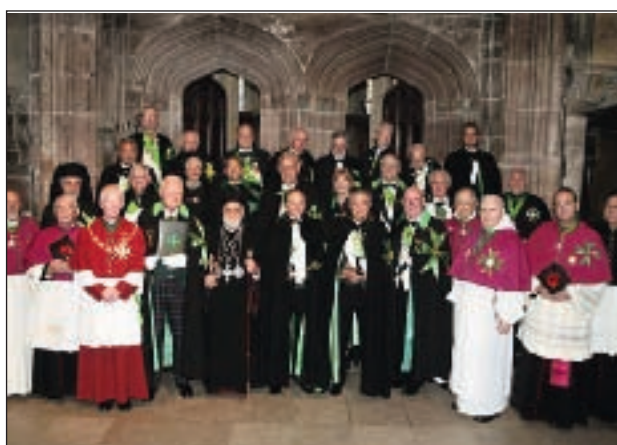
Salida de la Catedral.