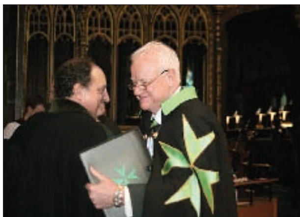
El Gran Comendador felicita al Gran Maestro.