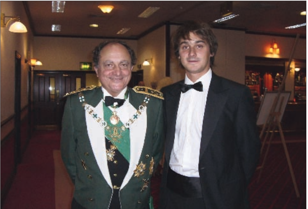
El nuevo Gran Maestre posa ante la cámara, poco antes de la cena de gala.