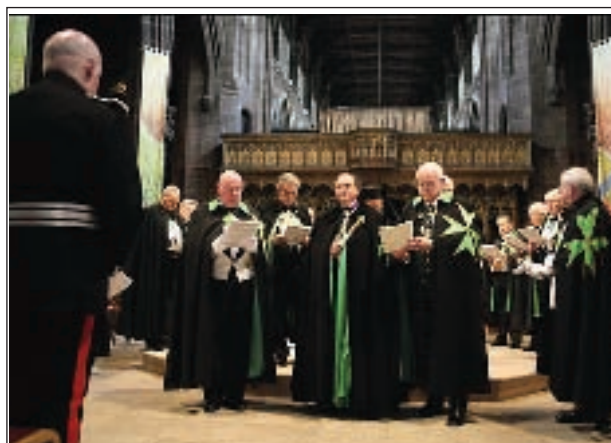
Proclamación del Gran Maestro.