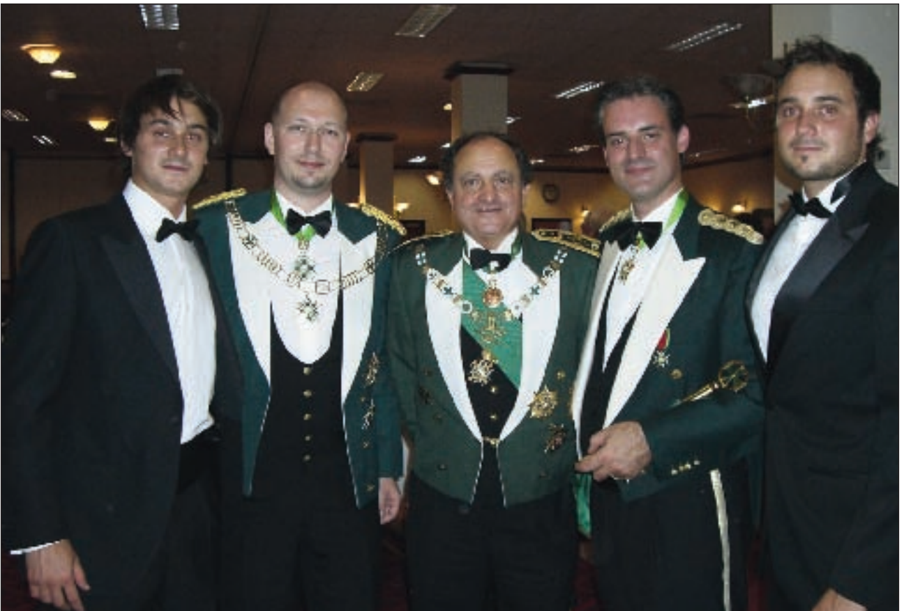
Otra instantánea de la cena de Manchester.