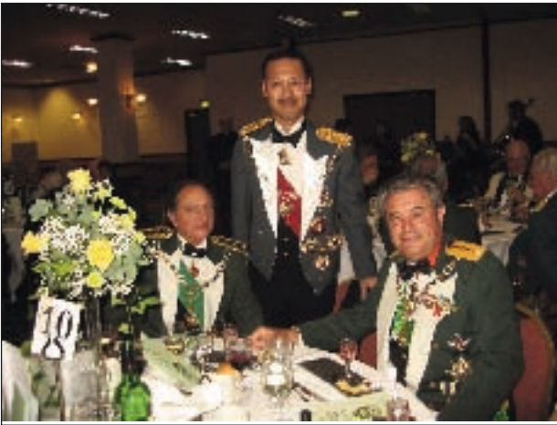
Sentados el marques de Almazán y el duque de Sevilla, de pie el barón Okabe.

JOSÉ LUIS DE BORBÓN Y RICH: Muerto en el Ejército nacional en agosto de 1936.