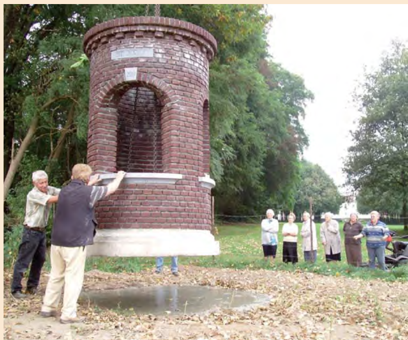
De kapel zweeft boven haar fundering. Rechts kijken de bewoners van klooster Hagenbroek toe.

En zo kon het gebeuren, dat eind september 2011 de kapel en de torenspits naast elkaar op het schoolterrein staan. De spits is vervolgens met een kraan op de toren gezet en alles bleek precies te passen. Nadat het geheel een week op het schoolterrein te bewonderen was geweest, werd het tijd voor vertrek naar Thorn.