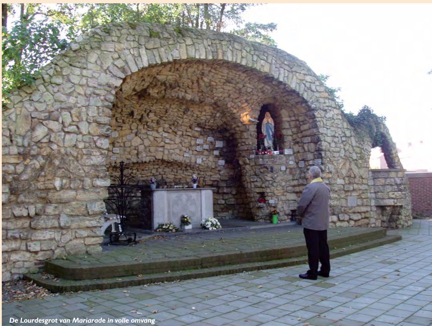
De Lourdesgrot van Mariarade in volle omvang

Toch zijn er aan het begin van de twintiger jaren van de vorige eeuw tegenbewegingen, zoals de uit Amsterdam stammende Vrijdenkersvereniging De Dageraad . Deze beweging neemt de rede en de logica als uitgangspunt en keert zich tegen geloof en traditie. Hun standpunten schrijven zij neer in pamfletten, die onder meer aan de poorten van de Emma worden uitgedeeld. In die pamfletten wordt bovendien de H. Maagd Maria belasterd. Een dergelijke provocatie kan natuurlijk niet zonder gevolgen blijven.