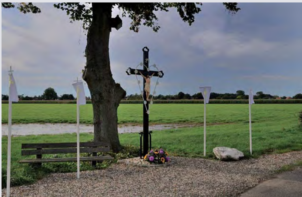
Het kruis troont weer in volle glorie

Het resultaat is een prachtig wegkruis, voorzien van rozetten en een mooi corpus.