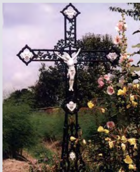
Het kruis aan de Manegeweg voor de vernieling