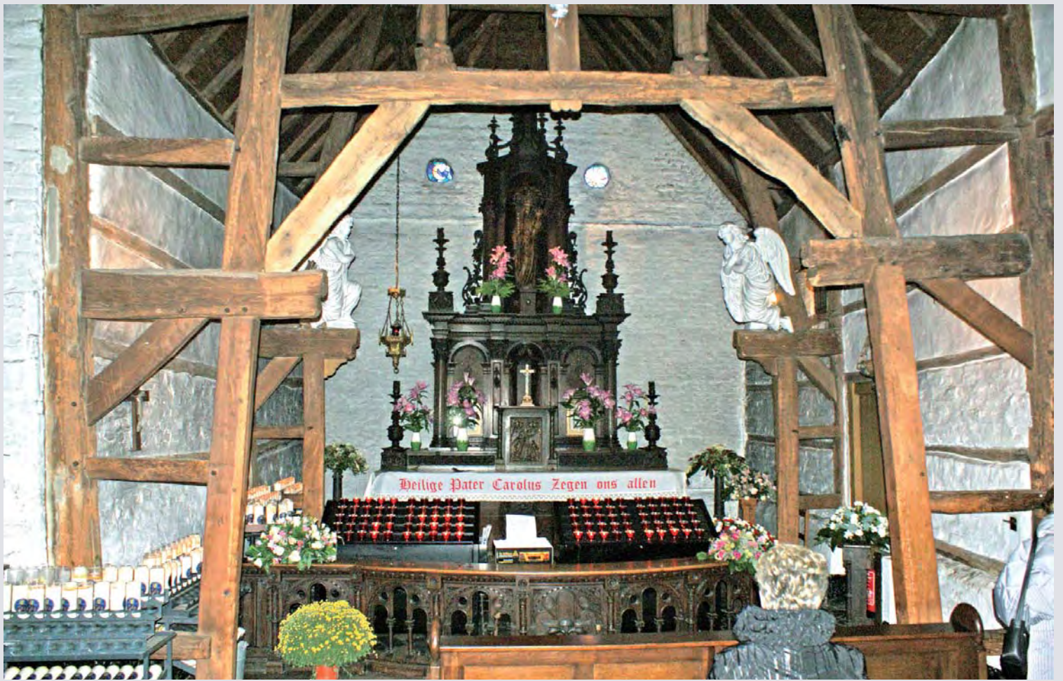
Interieur van de kapel met haar houten draagskelet