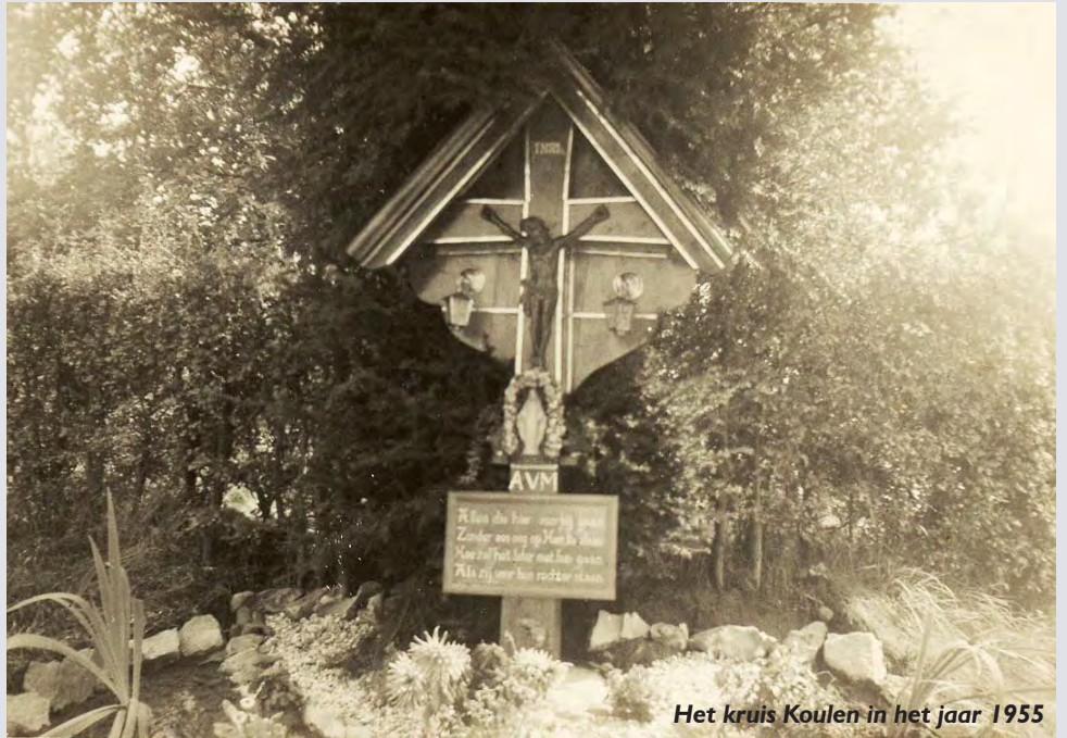
Het kruis Koulen in het jaar 1955