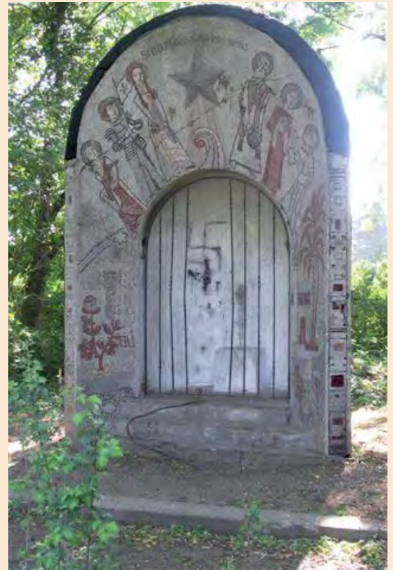
De in verval geraakte kapel