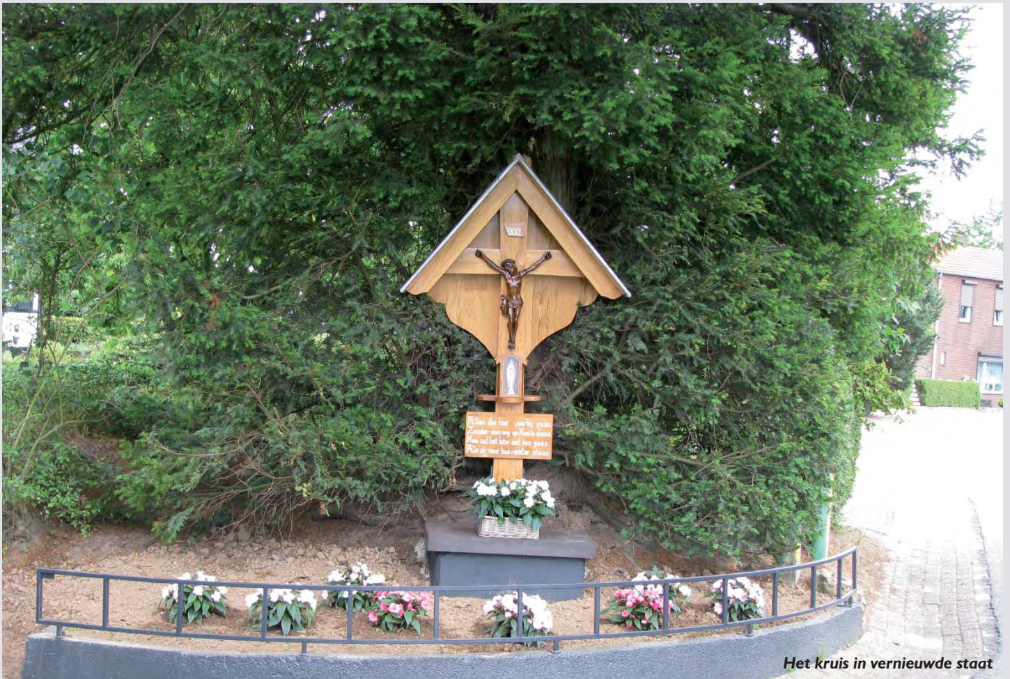
Het kruis in vernieuwde staat