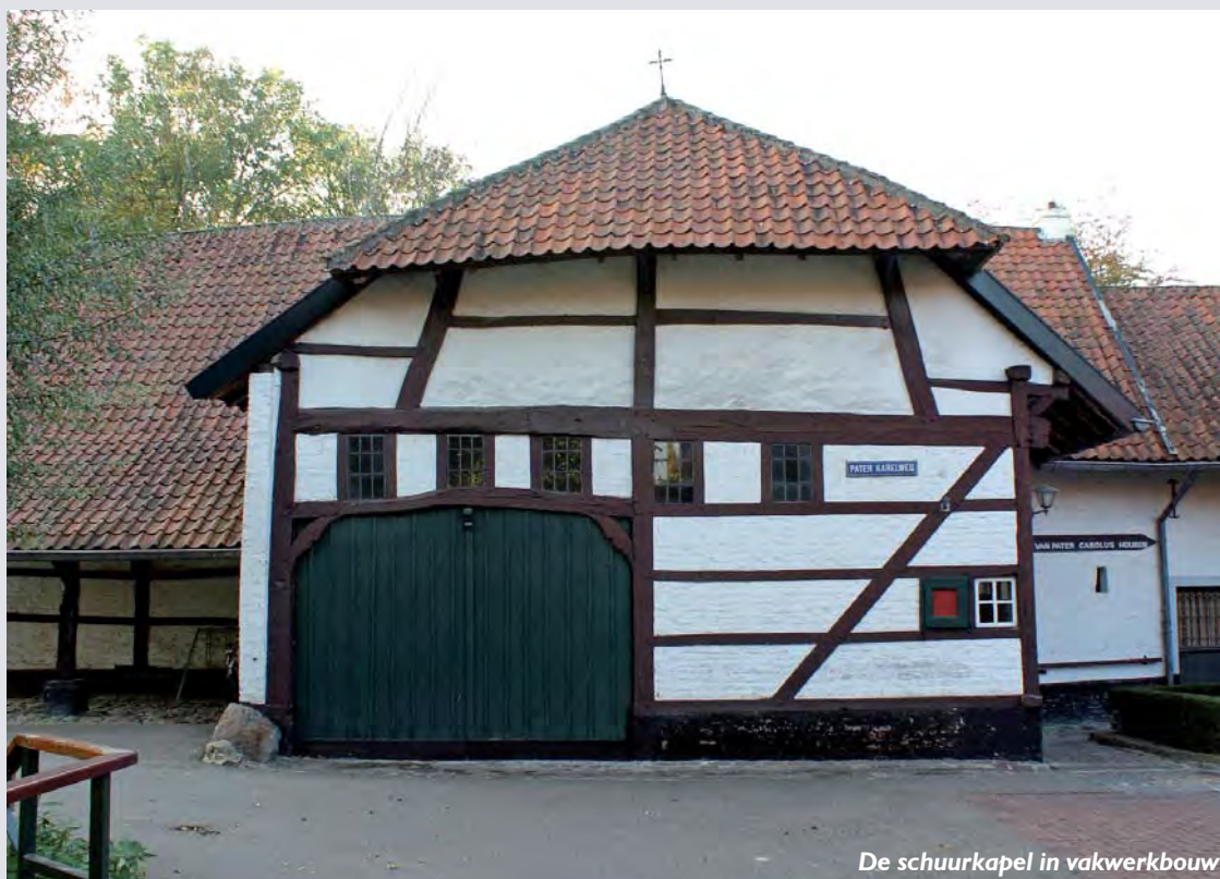
De schuurkapel in vakwerkbouw

De molentak van de Geleenbeek kabbelt nog steeds zo rustig voort als twee eeuwen geleden en men kan er nog altijd van een “oorverdovende” stilte genieten.