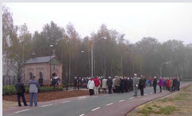
De plechtigheid op die herfstachtige zondagmiddag werd gadegeslagen door velen