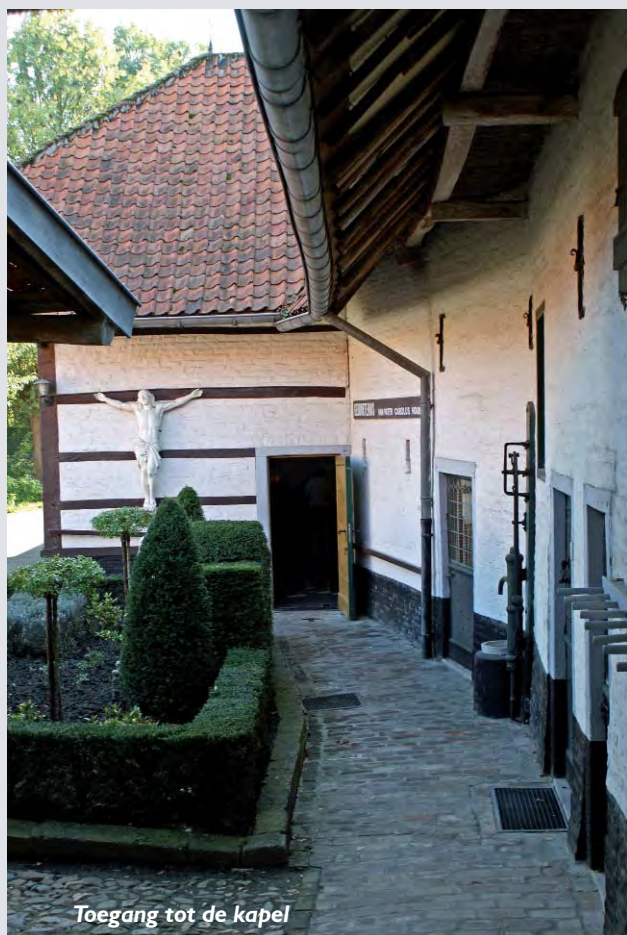
Toegang tot de kapel

Wie pater Karel is, hoef ik in Limburg natuurlijk niet te vertellen. Naast zijn geboortehuis staat een oude vakwerkschuur. Niet echt iets bijzonders in deze streken, zou je denken. Een kruis op de nok van de oude schuur maakt aan de bezoeker van deze plek echter duidelijk dat er met deze schuur iets bijzonders aan de hand is. Zij is namelijk ingericht als kapel ter ere van pater Karel.