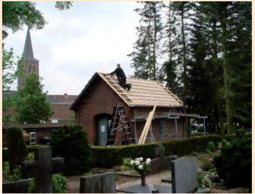
Aan het werk bij het vernieuwen van het dak

In de loop van de jaren is de lijkverzorging door begrafenisondernemingen overgenomen en raakte het huisje op het kerkhof voor zijn doel overbodig.