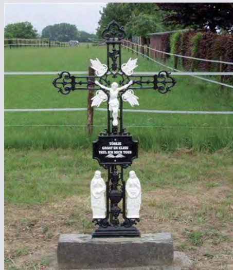
Het kruis na de opknapbeurt