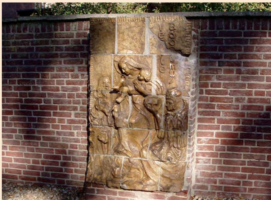
Een van de terracotta reliëfs, die de zeven blijdschappen van Maria uitbeeldt. "Venite adoremus": De Drie Koningen bezoeken de pas geboren Jezus.