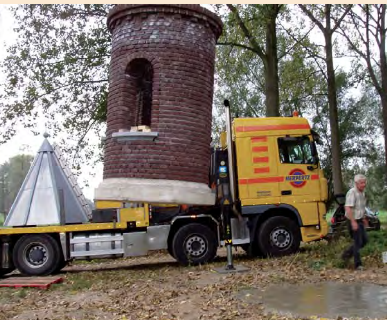
Na aankomst in Thorn wordt meteen met de plaatsing begonnen.

In 2007 worden plannen opgevat om de kapel te herbouwen. Niet op de oorspronkelijke plaats in het bos, want daar zou de kapel onzichtbaar zijn. Een betere plaats leek een idyllisch plekje bij een kromming van de Baarstraat, van waar men in de verte klooster Hagenbroek ziet liggen.