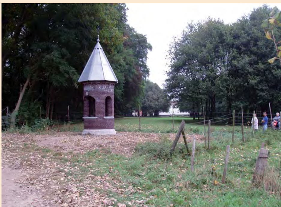
De kapel op zijn definitieve plaats. Op de achtergrond het klooster Hagenbroek.