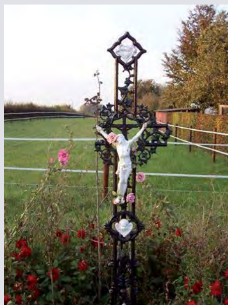
Het vernielde kruis