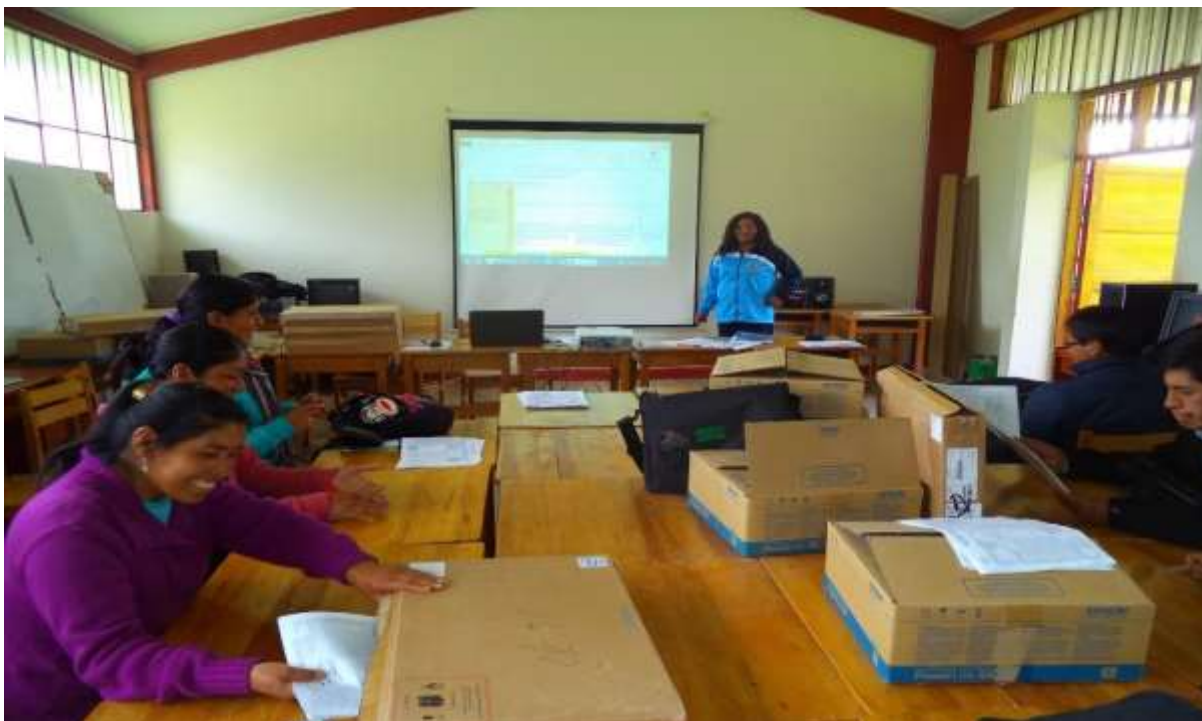
Exponiendo los compromisos de gestión escolar