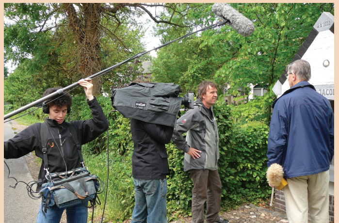
De opnamen bij de Jacobuskapel

Op 12 mei 2007 zijn in Thorn opnamen gemaakt voor het programma "Man bijt hond". Daartoe waren vier beheerst(d)ers opgeroepen om per fiets met de nodige schoonmaakattributen op het kerkplein te verschijnen. De camera signaleerde hoe de beheerders vanaf die plek uitzwermden naar hun kapellen. Van de kapellen van Barbara, Catharina, Nepomucenus en Jacobus werden fraaie opnamen gemaakt, terwijl de beheerst(d)ers druk doende waren met de schoonmaak. Aanleiding voor de televisieopnamen was het feest van 's Heren Hemelvaart. De producent van het programma wist eigenlijk niet goed hoe hij de relatie tussen Hemelvaart en de Thornse kapellen moest leggen. De Thornse beheerst(d)ers wisten dat ook niet, maar de oplossing was al gauw gevonden: in Thorn zou het de gewoonte zijn om voor Hemelvaart de kapellen schoon te maken. En zo kon men op Hemelvaartsdag in het televisieprogramma de "traditionele" schoonmaak van de Thorner kapellen aanschouwen.