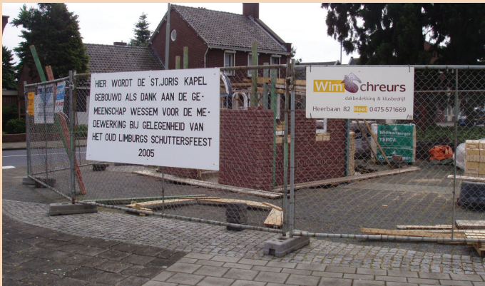
De kapel in aanbouw

Op 3 juli 2005 vond in Wessem bij tropische temperaturen het Oud Limburgs Schuttersfeest plaats. Het jaar tevoren had Schutterrij St. Joris het OLS gewonnen en dat betekende, dat de schutterrij het jaar daarop het feest mocht organiseren. Het hele dorp werd betrokken bij de organisatie en na afloop wilde de schutterrij dan ook een blijvend aandenken aan het dorp schenken. Besloten werd tot de herbouw van een kapel, die in de zestiger jaren door een wegreconstructie was verdwenen.