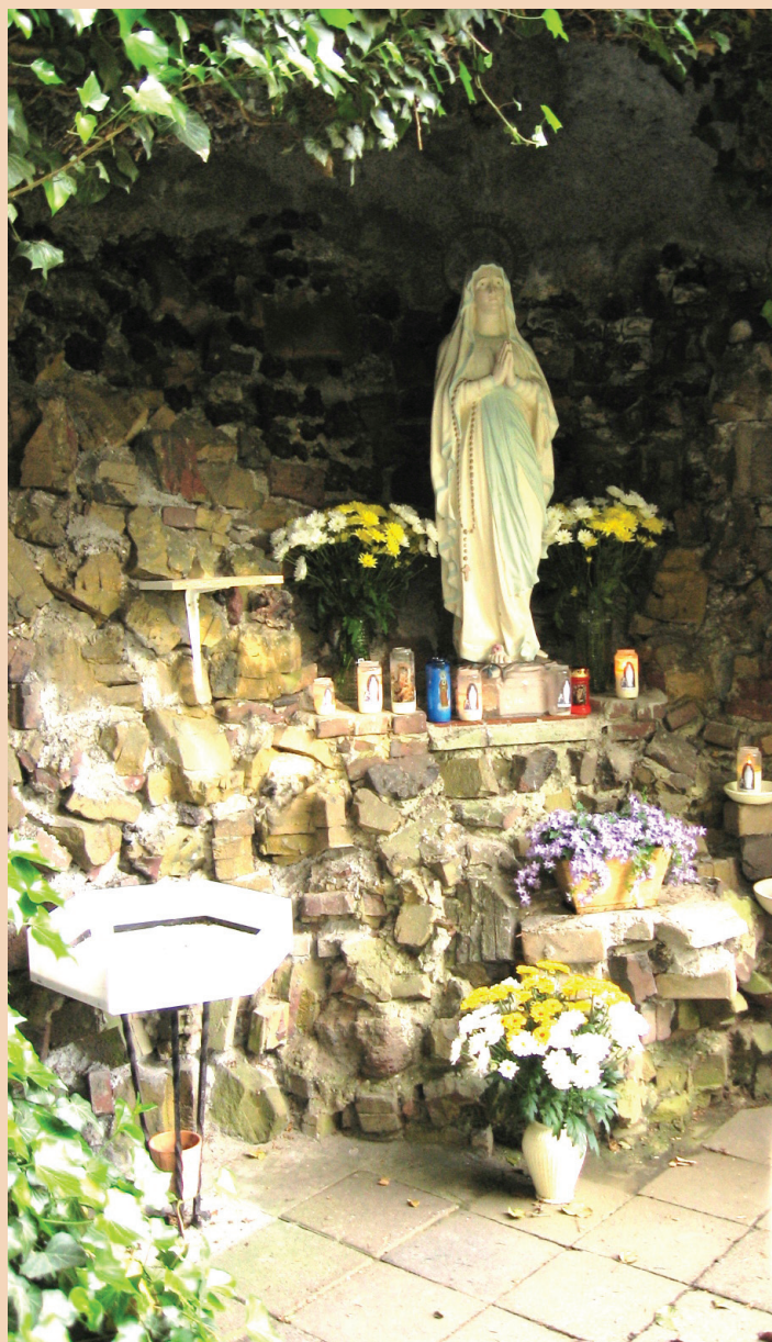
Onze Lieve Vrouw van Lourdes

Na de bouw van nieuwe appartementen op het vroegere kloosterterrein werd het drukker in de buurt. Een van de nieuwe bewoners, de heer Elbers, trof onder een berg verwilderde klimop de vervallen lourdesgrot aan en nam het initiatief om deze plek weer in ere te herstellen.