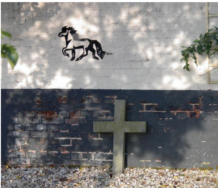
Het hervonden grafkruis

Een timmerman uit de kennissenkring was graag bereid een kruis te maken, dat paste bij het corpus en dat tevens geschikt was om te bevestigen aan de enorme wilgenboom die voor het huis staat. En een bevriende priester heeft gezorgd voor de inzegening.