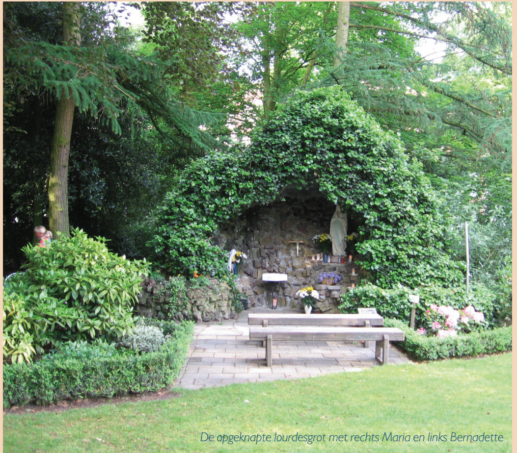
De opgeknapte lourdesgrot met rechts Maria en links Bernadette

De doorgaande groei maakte in 1930 de bouw van het Vincentiushuis noodzakelijk. Toen na de oorlog het internaat opgeheven werd, vestigden de zusters in de vrijkomende gebouwen een BLO-school voor Venray en de omliggende gemeenten. 25 Jaar later hadden 60 zusters de zorg voor patiënten in het Vincentiushuis en de Laterije, en ook steeds meer de zorg voor elkaar, want de vergrijzing nam flink toe. In december 1990 sloten de laatste zusters voorgoed de deur. 113 Jaren lang was deze plek er een van kloosterlijke naastenliefde geweest.