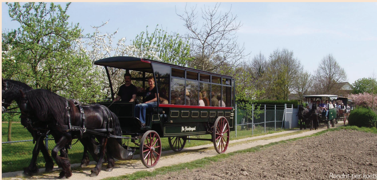
Rondrit per koets

Op zaterdag 14 april was Thorn het gezellige en zonnige trefpunt voor de deelnemers aan de jaarlijkse contactdag van de Stichting Kruisen en Kapellen in Limburg (SKKL). Meer dan zestig geïnteresseerden waren die dag, voor een gevarieerd programma, vanuit heel Limburg naar het witte stadje afgereisd.