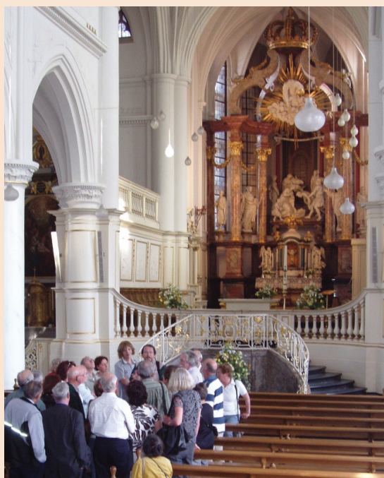
Bezichtiging van de Abdijkerk