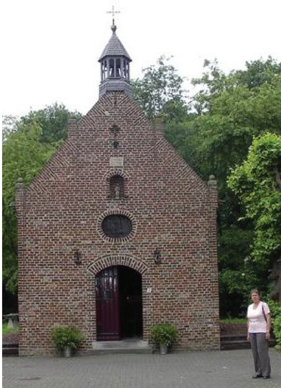
De Witte Kapel

Aan de achterzijde hangt tegen de buitenmuur een groot kruis met corpus. Op 8 januari 1945 kwamen bij een mijnontploffing bij het vlakbij gelegen patronaat zeven kinderen tijdens hun spel om het leven. Het kerkhof bij de parochiekerk kon toen niet gebruikt worden, omdat het onder vuur lag van de Duitsers, die de oostoever van de Maas nog bezetten. (Neer, op de westoever, was al bevrijd). De kinderen zijn toen begraven achter de kapel, bij het grote kruis.