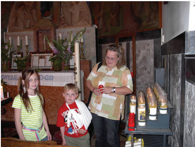
Een kleine honderd kaarsjes

De processie trekt twee keer per jaar naar de witte kapel en ook is er jaarlijks (meestal in augustus) nog altijd een openluchtmis, die veel belangstellenden trekt. Verder is er geregeld rozenkransgebed, worden er af en toe kinderen gedoopt en zijn er missen bij huwelijken en huwelijksjubilea.