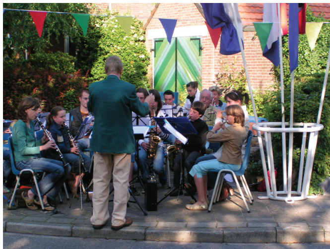
Het Jeugdorkest van Harmonie St. Augustinus

Na de avondmis van 18.00 uur in de Augustinuskerk ging men naar de kapel, alwaar al diverse buurtbewoners en andere belangstellenden aanwezig waren.