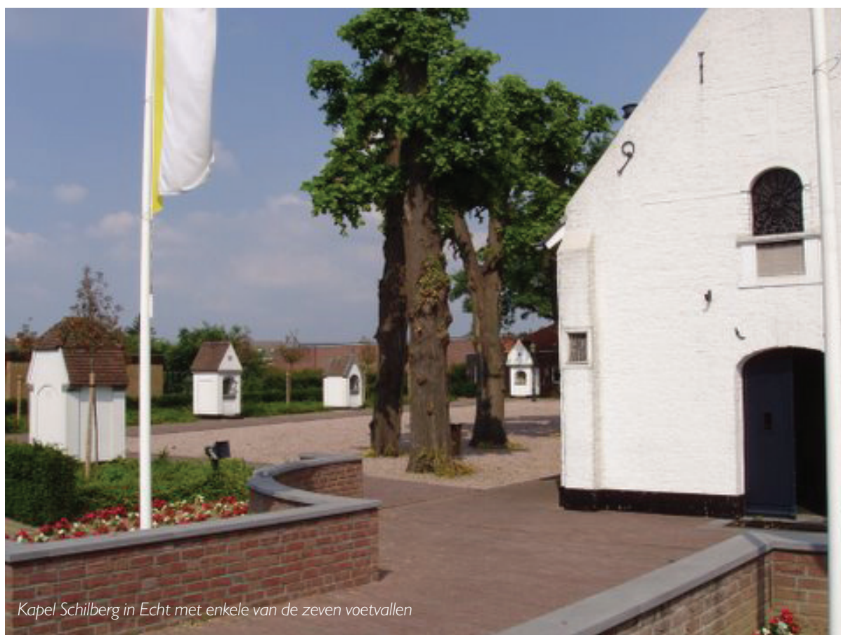
Kapel Schilberg in Echt met enkele van de zeven voetvallen