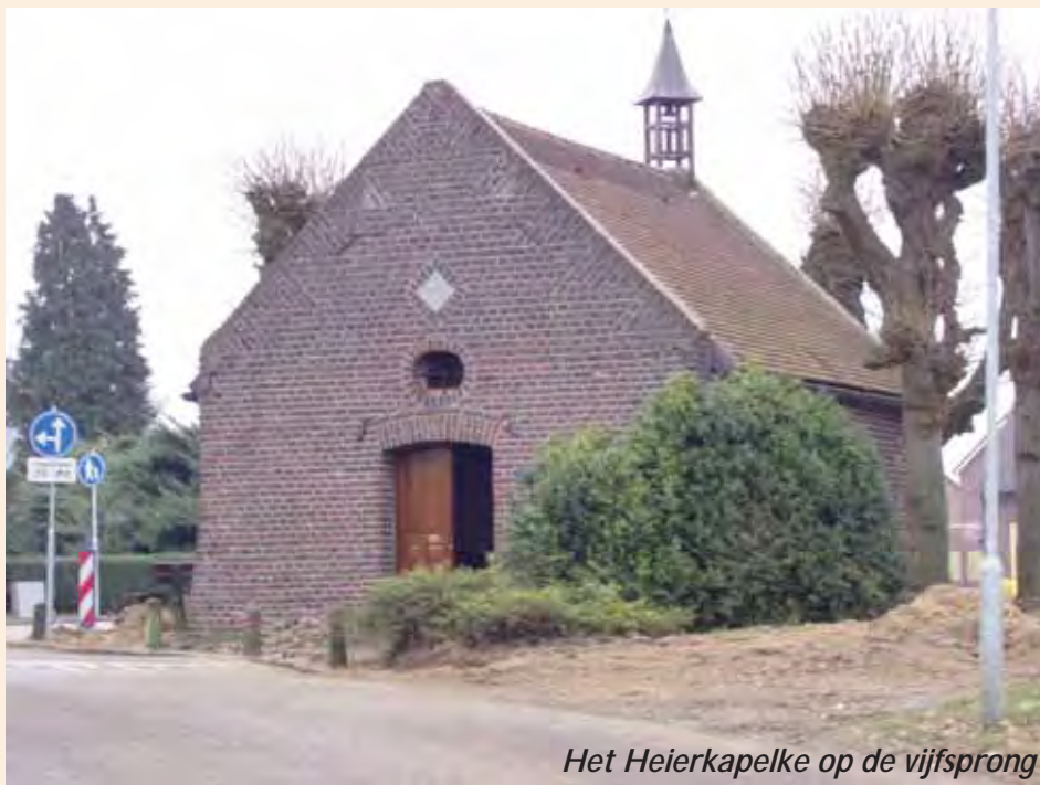
Het Heijerkepelke op de vijf-sprong

In 1774 werd door landmeter Sma-bers een kaart van Swalmen gemaakt,