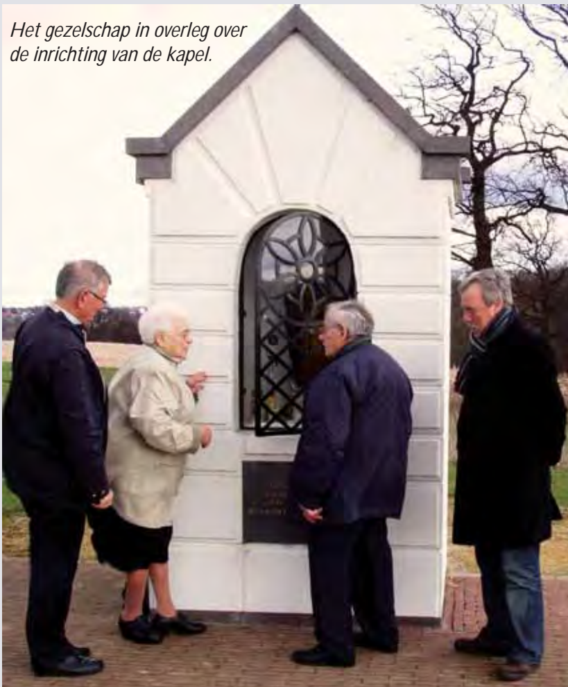
Het gezelschap in overleg over de inrichting van de kapel.

De kapel zou echter niet herbouwd worden op de plaats, die in 1961 was voorzien. Gewijzigde inzichten leidden er toe, dat de kapel een plekje kreeg in de ruimte ten oosten van de Roerlandbaan. Min of meer vóór het kloostercomplex Rolduc. En dan blijkt maar weer eens hoe ingewikkeld de bouw van zo'n bescheiden kapelletje is. In het boekje, dat Frits Sprokel over de geschiedenis van de kapel schreef, kan men lezen over bouwtekeningen, smeedwerk, betonnen platen, over een koperen interieurkoepel, over timmerwerk, zinken daken en verfwerk. Men leest er over het bedelwerk bij bedrijven om materialen gratis of voor een zacht prijsje te bekommen. En dan is er natuurlijk de organisatie en de coördinatie van zo'n complex project, waarbij zeker zo'n tien mensen zijn betrokken. Eind mei komt de kapel gereed en op zondag, 2 juni 2002 wordt de herbouwde kapel onthuld door mr. Camille Zillekens, nazaat van de familie Deutz. Daarna is de kapel door mgr. Frans Wiertz, Bisschop van Roermond, plechtig ingezegend.