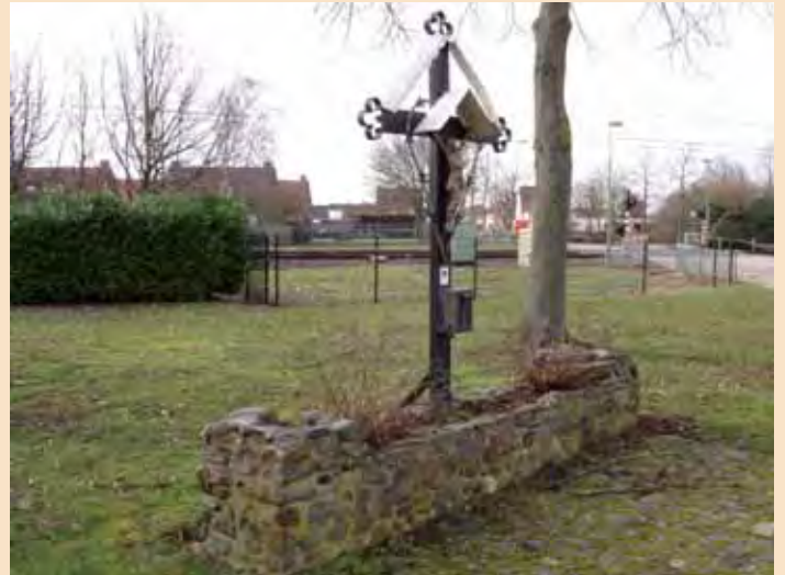
Het hagelkruis op de kruising van Wilhelminalaan en de Narcissenstraat

L. Theelen, Stichting Kruisen en Kapellen Echt