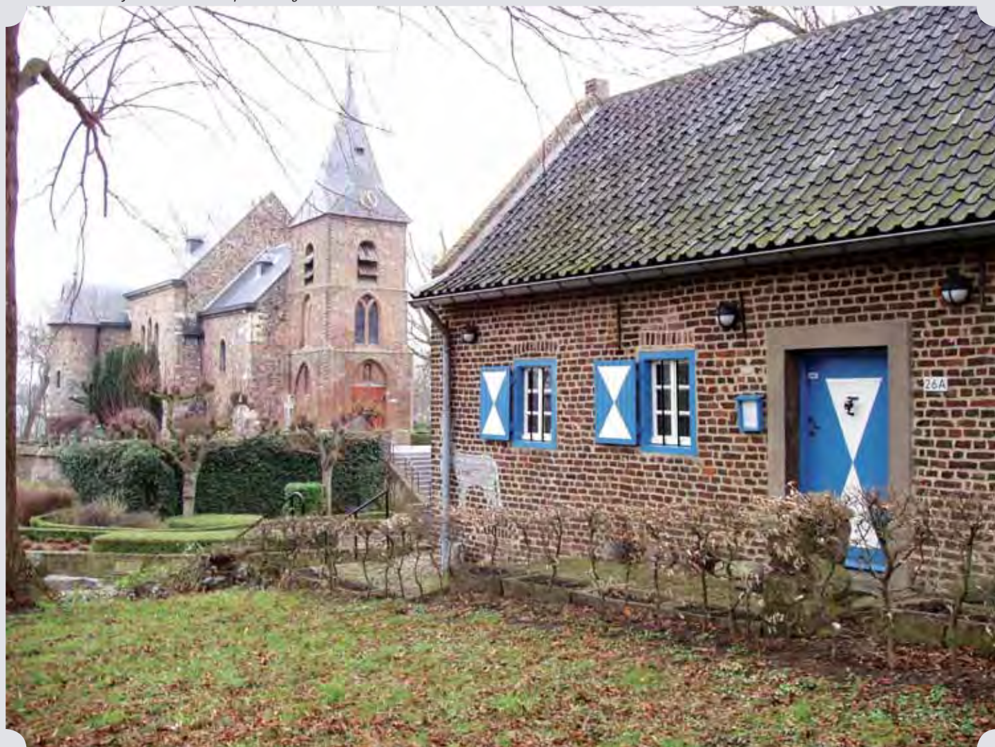
Het Rozenkerkje te Asselt met op de voorgrond rechts het museum