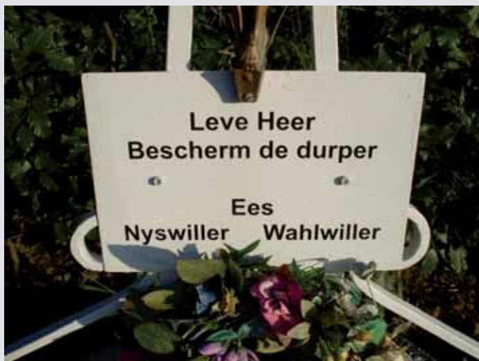
Het tekstbord met de bede om bescherming.