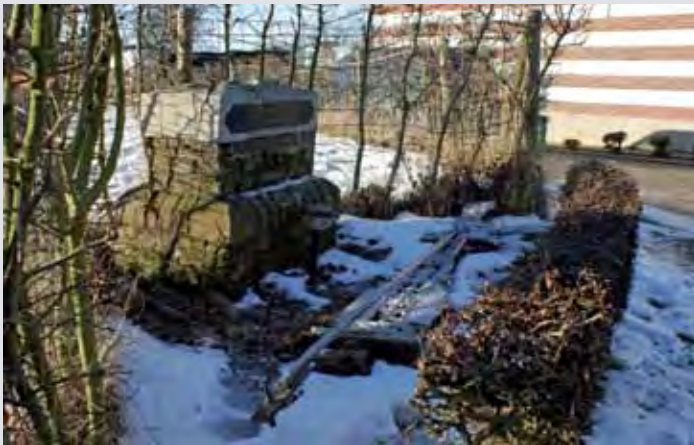
Het kruis met bruto geweld van zijn sokkel gerukt.

Het fraaie kruis is in 1904 bekostigd door de gezusters Slangen. Zij woonden in Oud-Hunnecom en hebben het initiatief voor oprichting van dit kruisbeeld genomen na een gebedsverhoring. Na een door hen gehouden Noveen voor een ernstig zieke tante, zou deze namelijk zijn genezen.