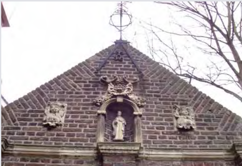
Fraaie details in de voorgevel