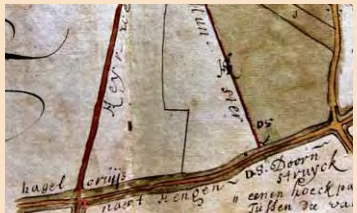
De kaart van Boender van 1715