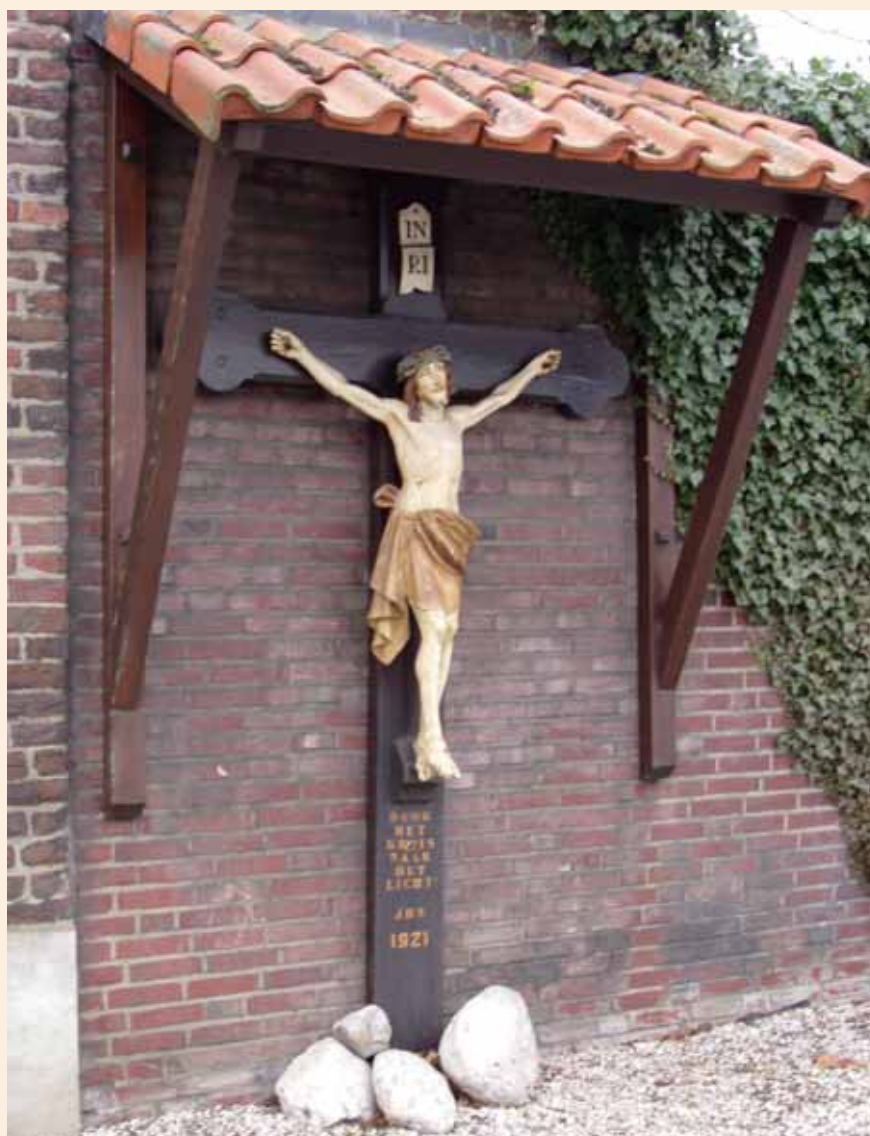
Op dit kruis in Panheel, waarop Jezus overigens recht voor zich kijkt, zijn de bloeddruppels op de rechterzij aangebracht.

De vraag wordt nu voorgelegd aan de lezers van "Kapellen en Kruisen". Wie kent richtlijnen of gebruiken op dit punt: aan welke zijde van Christus dienen de bloeddruppels te worden aangebracht ? Uw bericht neemt de redactie graag in ontvangst.