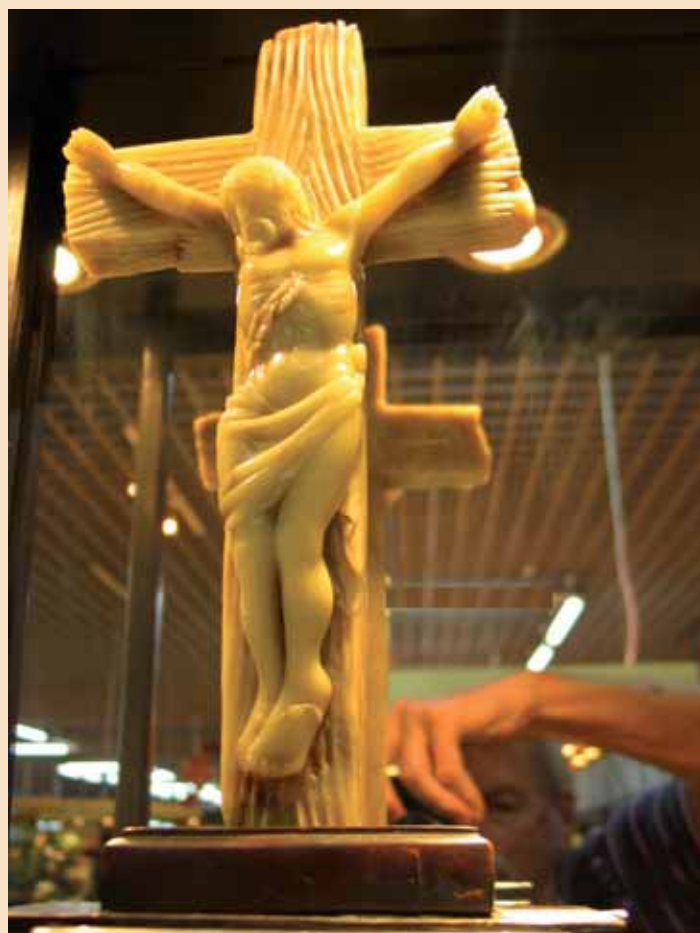
De Chinese Christus met rechts onder de fotograferende schrijver van het artikel.