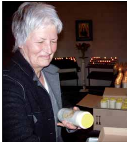
De vroegere biechthal functioneert thans als kaarsenkapel. Achterdoor de icoon van Maria.

De intenties uit het boek, deze neergeschreven diepste verzuchtingen van mensen in nood, worden, als er een eucharistieviering in de kapel is, door de deken voorgelezen.