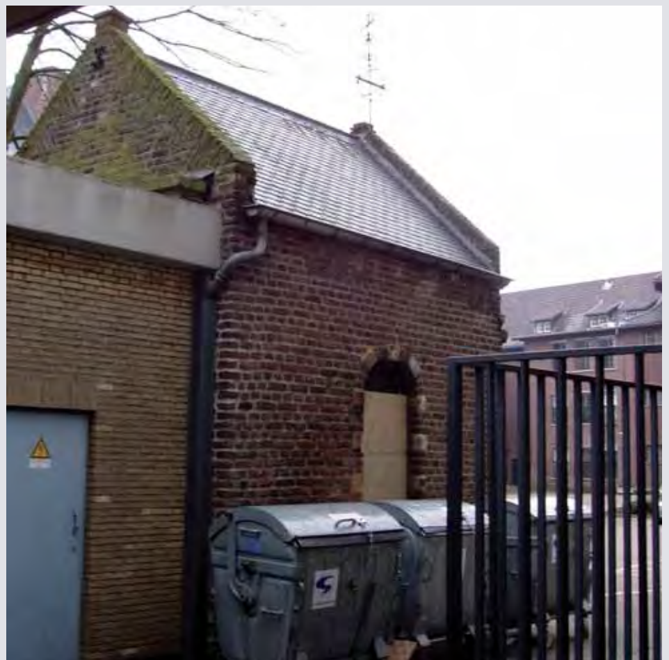
Ook de achterkant van de kapel oogt verwaarloosd