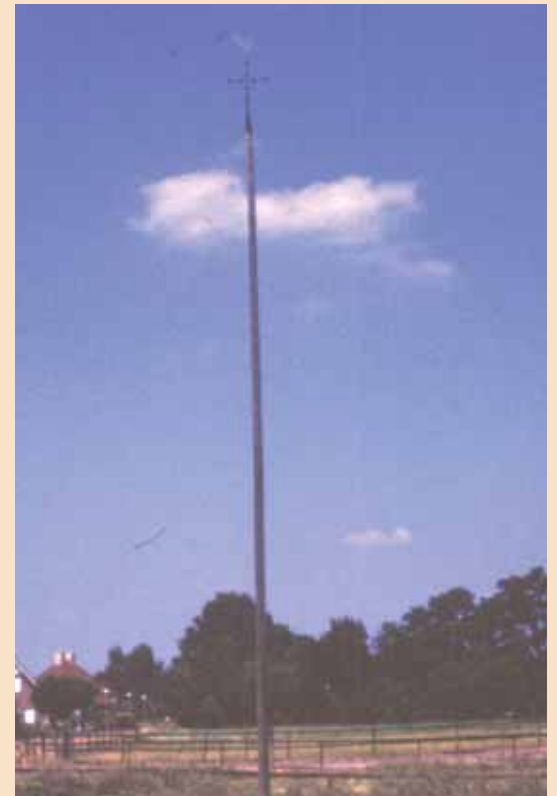
Een hagelkruis in Twente