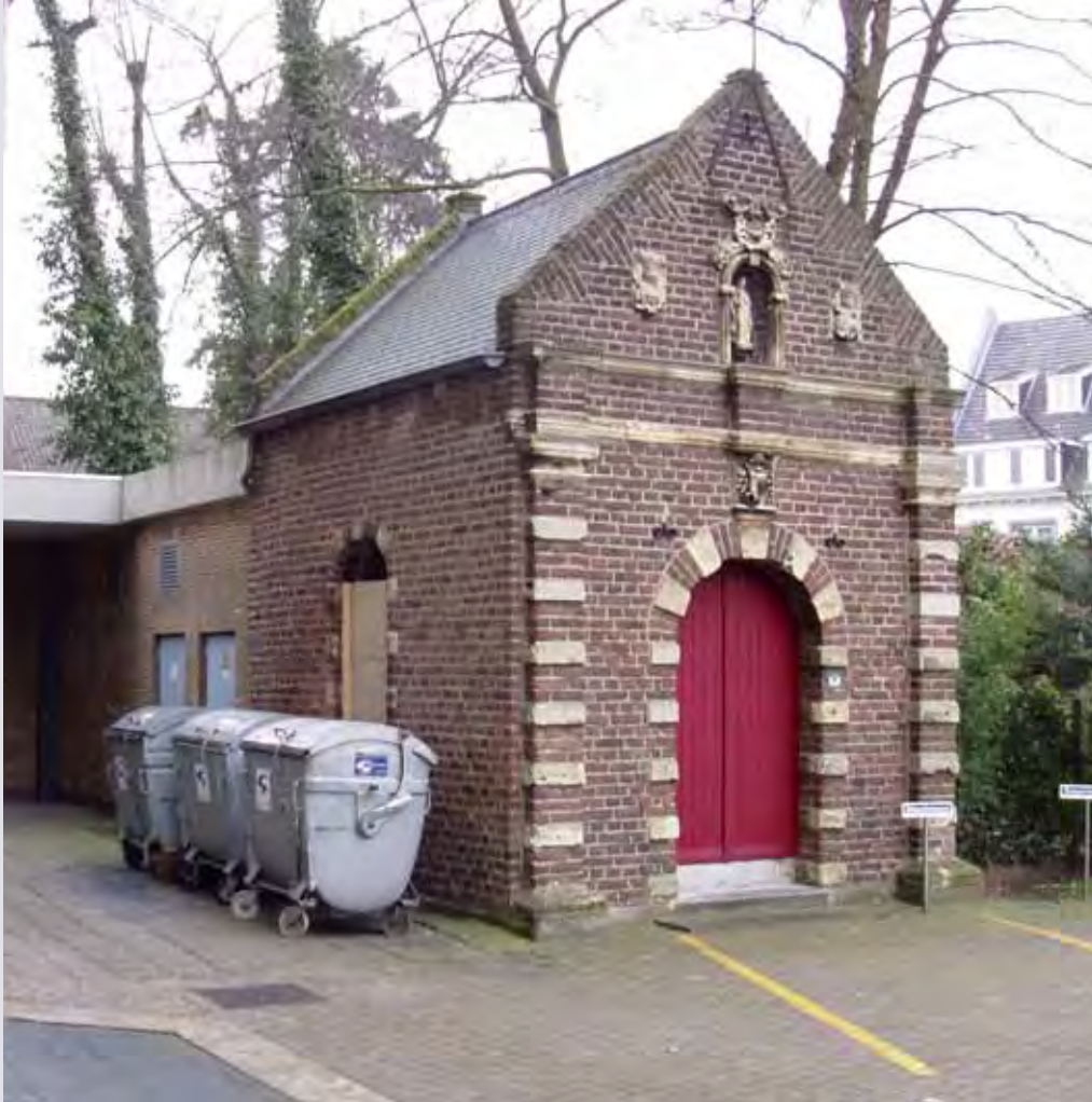
Precies voor de kapel is een parkeerplaats