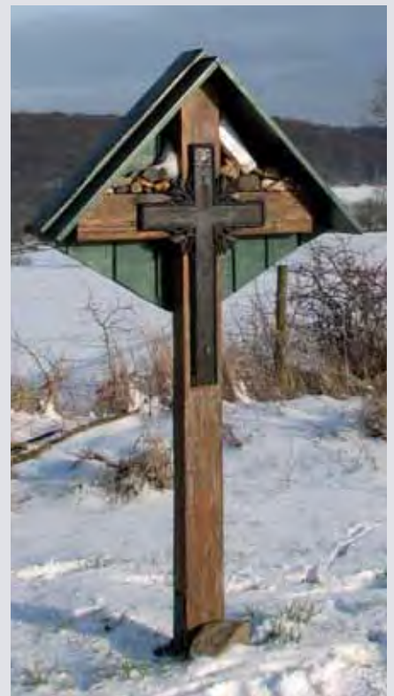
Het kruis met de opgestapelde stenen.

Ze waren te nauwkeurig gestapeld om er zo bij te liggen. Wellicht, dat een van onze lezers een verklaring heeft. Uw reactie wordt bij de redactie ingewacht.