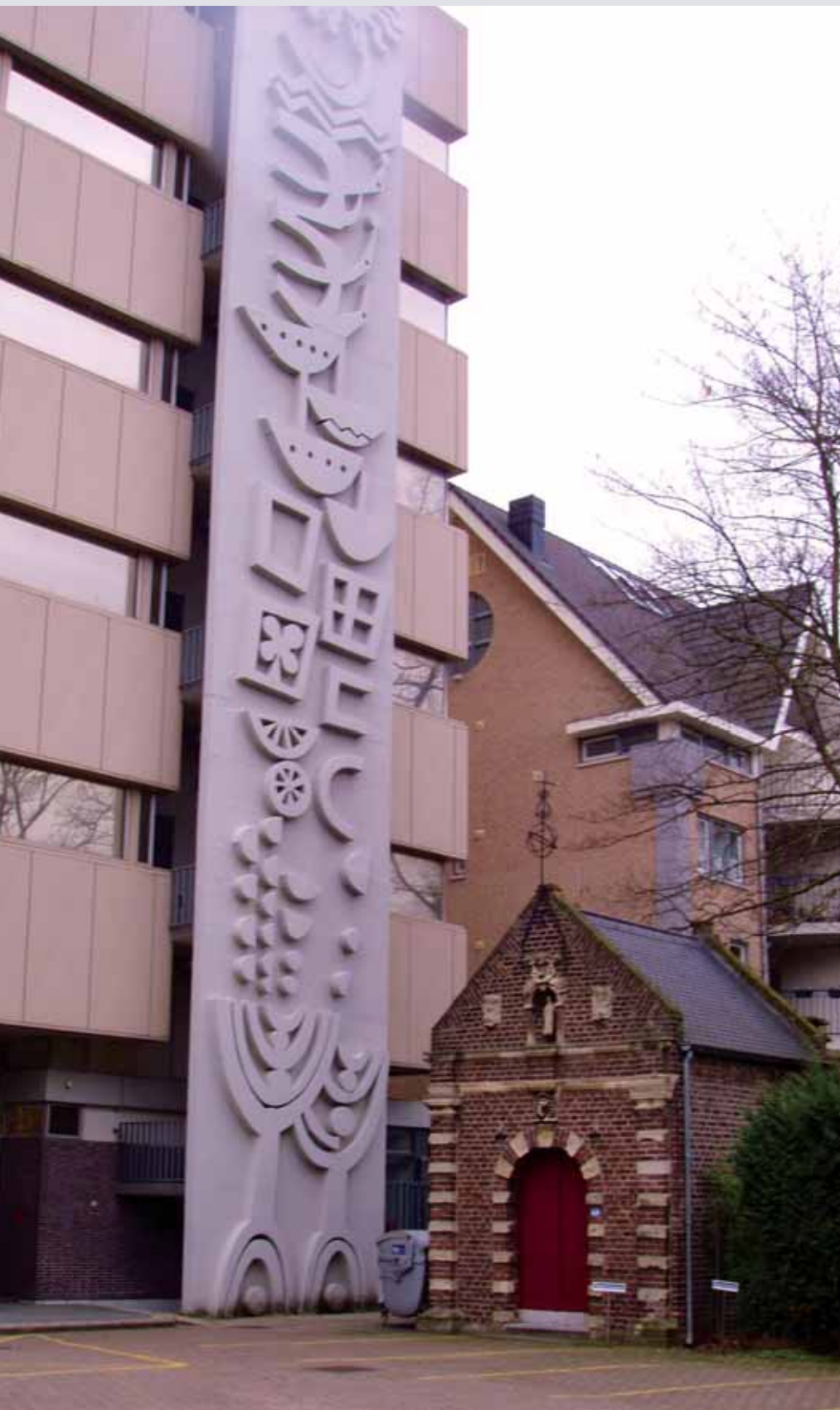
De Ursulinenkapel weggedrukt door een hoge kantoorflat

Verscholen tussen de monumentale gerestaureerde restbouw van het voormalige Ursulinenklooster, het mooie kantoorpand van de LLTB en de foeilelijke kantoortoren van het voormalige Interpolis, staat als een verloren juweel de Ursulinenkapel.