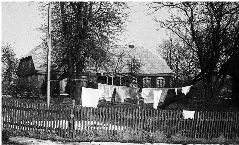
Antano Radiko (Stasės Klapatauskienės) etnoarchitektūrinės sodybos gyvenamasis namas. 1985 m.

šarui ir šienui sandėliuoti, pora nedidelių patalpų paukščiams ir vaiko kamara, kurioje gyvendavo samdinys bernas. Daržinių