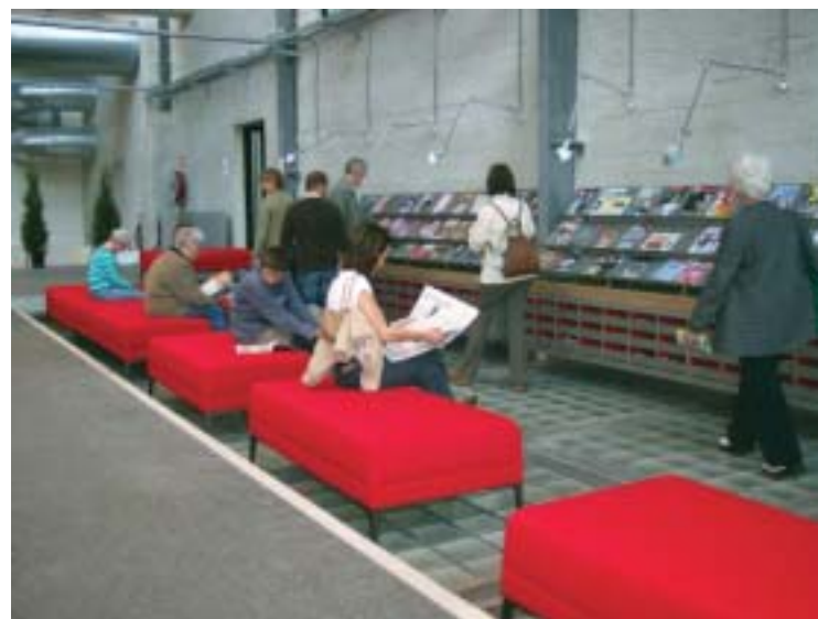
Zitbanken nodigen uit om een krant of een algemeen tijdschrift te lezen.