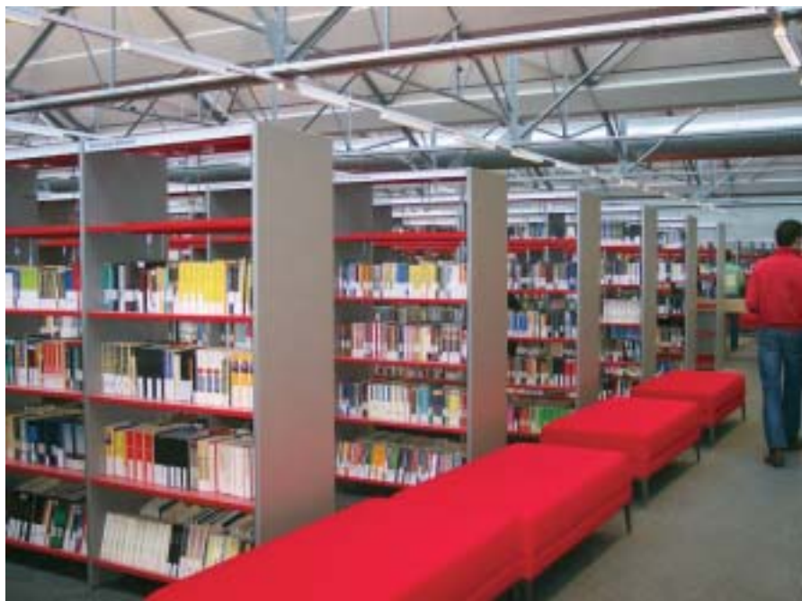
Overal in de bibliotheek zijn rekken van hetzelfde type en dezelfde rode kleur terug te vinden.

De bibliotheek is gespreid over twee verdiepingen. Zij is niet opgesplitst in afdelingen maar in zones. Wie de bibliotheek binnenstapt, komt terecht in de marktzone. Het is een open ruimte met een aanbod dat de recreatieve volwassen gebruiker moet verleiden. Ze vinden er strips en een klein deel van de informatieve materialen. Aanpalend staat de populaire romans opgesteld volgens genre en de muziek. Overal staan raadpleegpunten voor opzoekingen in de catalogus en infopunten die continu bemand zijn. Rekken, infopunten en raadpleegpunten zijn mobiel: de inrichting kan zodoende snel aangepast worden. Deze keuze was ingegeven door de wens om de bibliotheek op verschillende tijdstippen op een andere manier te kunnen gebruiken.