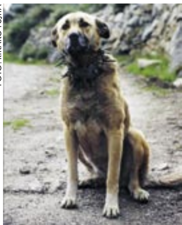
Ção da Serra da Estrela

Det finns en rad olika boskapsvaktande hundraser i världen, t ex har många länder i Europa egna inhemska raser. Bilderna visar bara några exempel på raser. Det finns även variationer i utseende inom raserna.