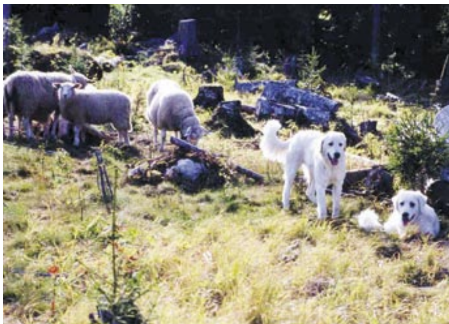
Ovan: Polski Owczarek Podhalanski.