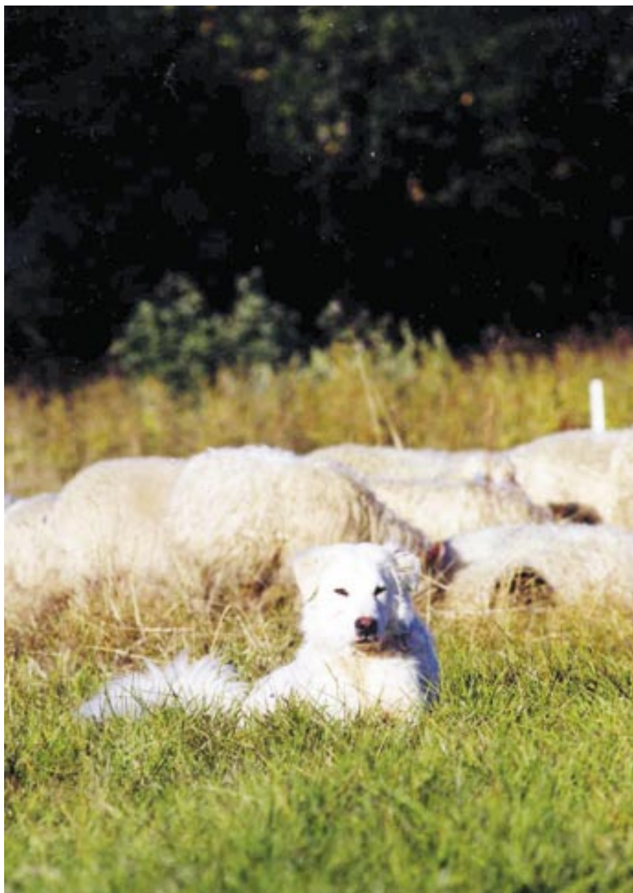
Hunden kommer i takt med mognad att bli mer aktiv i sin roll som boskapsvaktande hund. Vissa beteenden ökar i frekvens, t ex patrullering och doftmarkeringar. Mastino Abruzzese.