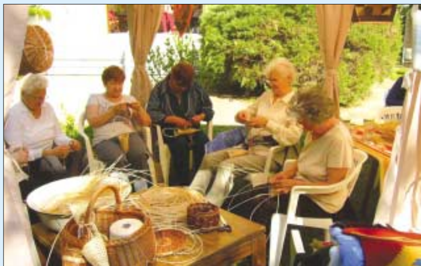
Kézműves foglalkozás az Ószike utcai Nyugdíjas Klubban