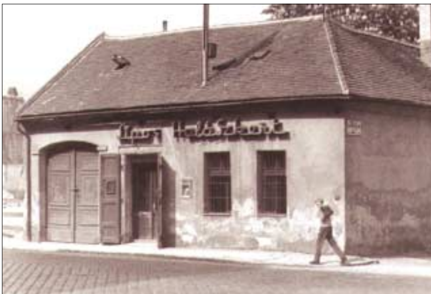
A Sáros Halászkert Óbudán, a Lajos utcában. A nagy klasszikus helyek egyike.

(A koncertre a belépés díjtalan, de adományokat az együttes támogatására szívesen fogadnak. Cím: Dévai Bíró Mátyás tér 1., a Pacsirtamező utcában, a Perc utcával szemben. )