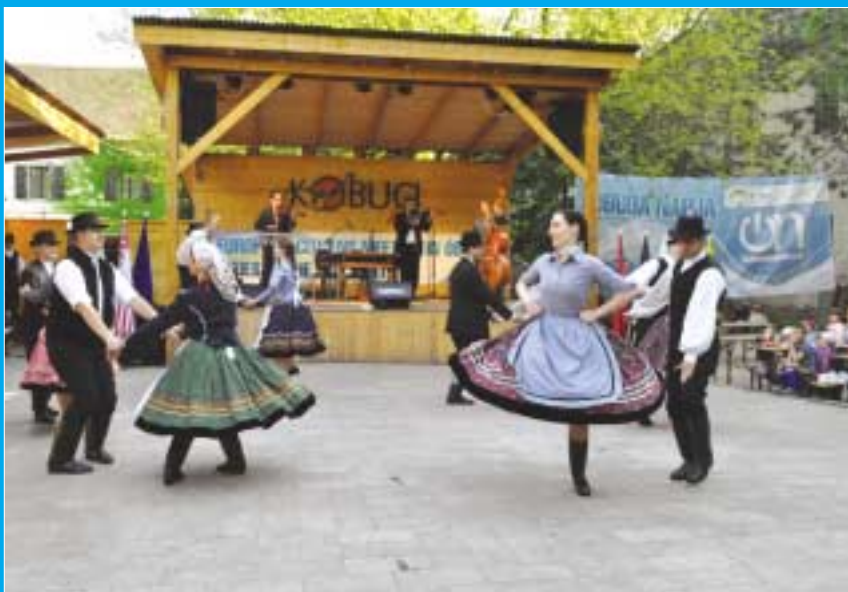
Az Óbuda Kultúrájáért-díjas Kincső Néptáncgyűttes a Kobuci Kertben lépett fel, a testvérvárosi produkció sorában képviselte a III. kerületet