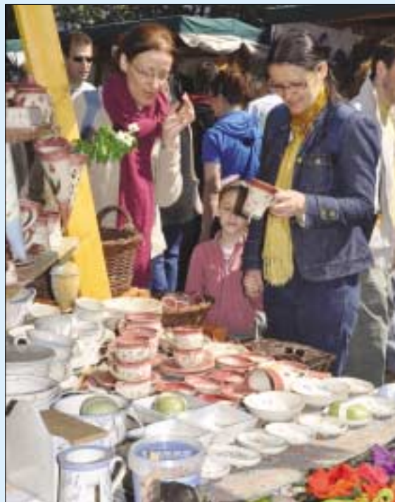
Kirakodóvásár a Fő téren, Civil udvar a Zichy-kastély udvarán