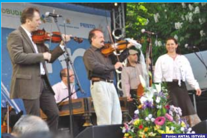
A népszerű Csík zenekar a Szentlélek téren adott koncertet