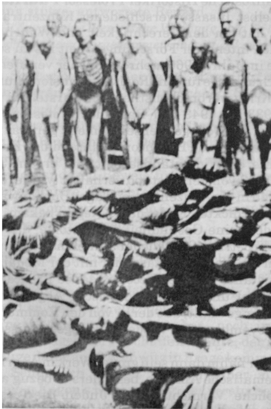
Gefälschtes Greueltaten-Foto. Die Körper im Vordergrund wurden aufmontiert.

Man ersieht dies selbst bei den Befreiungsbildern der Häftlinge von Dachau, Buchenwald und sogar Auschwitz.