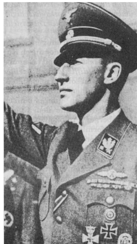
Reinhard Heydrich Befürworter der jüdischen Auswanderung

forderliche Vorbereitungen", "Vorausmaßnahmen zur Durchführung" (wie kann man eine "Vorausmaßnahme zur Durchführung vorlegen"?) prasseln da in 2 Sätzen auf Heydrich hernieder, ohne daß erklärt wird, was darunter verstanden werden soll. Was Heydrich vorbereiten sollte, machte das Memorandum weder klar, noch konnte es ihm seine eigene Auslegung freistellen. Hieraus ergibt sich, daß