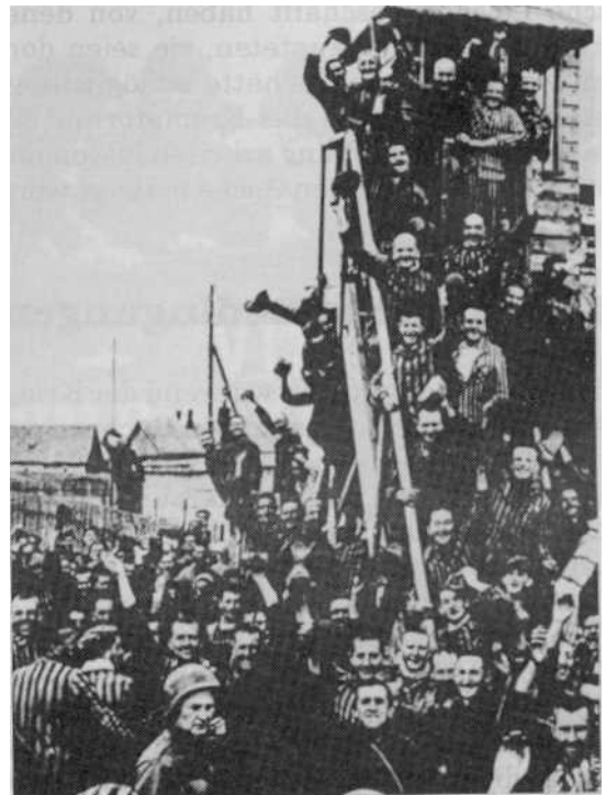
Gesunde und freudige Insassen von Dachau nach der Entlassung

Deutsche Militärärzte erzählten mir, daß es seit Monaten immer schwieriger wurde, Lebensmittel ins Lager zu schaffen. Auf alles, was sich auf den Autobahnen bewegte, wurde geschossen... Ich war erstaunt, noch 2 - 3 Jahre alte Unterlagen von großen Mengen an Lebensmitteln zu finden, die täglich gekocht und verteilt wurden. Seitdem widerspreche ich der allgemeinen Meinung, daß es eine beabsichtigte Hungerpolitik gegeben habe. Das wurde auch durch die große Zahl von gut ernährten Insassen bestätigt. Weshalb litten dann so viele an Unterernährung? Die Hauptgründe für diesen Zustand in Bergen-Belsen waren Krankheiten, starke Überbelegung durch die übergeordnete Verwaltung, das Fehlen von Gesetz und Ordnung innerhalb der Baracken und mangelhafte Versor-