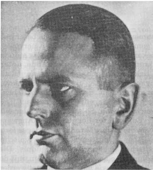
Otto Ohlendorf. -- In seinem Prozeß 1948 gab er zu Protokoll, "daß alle vorgehenden Erklärungen ihm unter Druck abgepreßt worden und ohne jeden Wert wären." 41)

sowjetischen Mordbefehle gegen die Intelligenz Europas, speziell die deutsche — verschweigen, verdrehen sie die historischen Zusammenhänge.