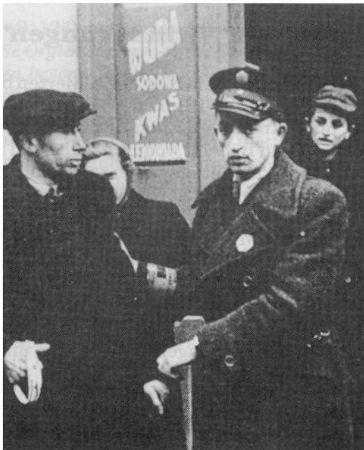
Jüdische Polizei bei der Kontrolle des Schwarzen Marktes im Warschauer Ghetto

ben hatte, noch daran glaube, daß es solche Dinge gegeben habe. Von dieser Aussage würde ihn nichts abbringen."