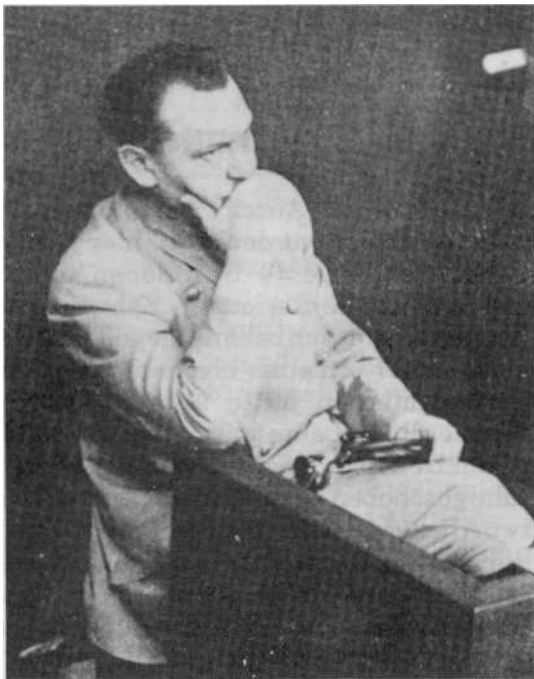
Reichsmarschall Hermann Göring wies die 6-Millionen-Anklage als Propaganda-Erfindung zurück.

sen teilgenommen habe. Wenn auch diese Erklärung ein Jahr später im Pohl-Prozeß wieder aufgetischt wurde, so konnte die Verteidigung diese jedoch dort durch den Nachweis abwehren, daß sie unter Folter zustande gekommen war und falsch ist. Im übrigen wies die Verteidigung nach, daß alle Todesfälle in Mauthausen von den örtlichen Polizeidienststellen überprüft und in dem Lagerregister eingetragen worden waren. Die Verteidigung stützte sich zudem auch auf zahlreiche Erklärungen ehemaliger Häftlinge von Mauthausen - ein Lager hauptsächlich für Kriminelle -, die das menschlich-korrekte Verhalten der Wachmannschaften bestätigten.