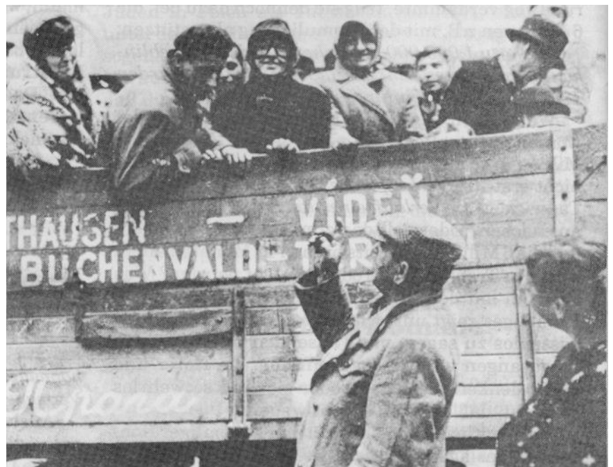
Heimkehr der Konzentrationslager-Insassen im Jahre 1945

"Ich war nach dem Kriege für 17 Monate in Dachau als Rechtsanwalt für das US-Kriegsministerium und kann bestätigen, daß es dort in Dachau keine Gaskammern gab. Was dort Besuchern und Touristen irrtümlicherweise als Gaskammern gezeigt wird, war ein Krematorium. Ebenso gab es in keinem Konzentrationslager in Deutschland eine