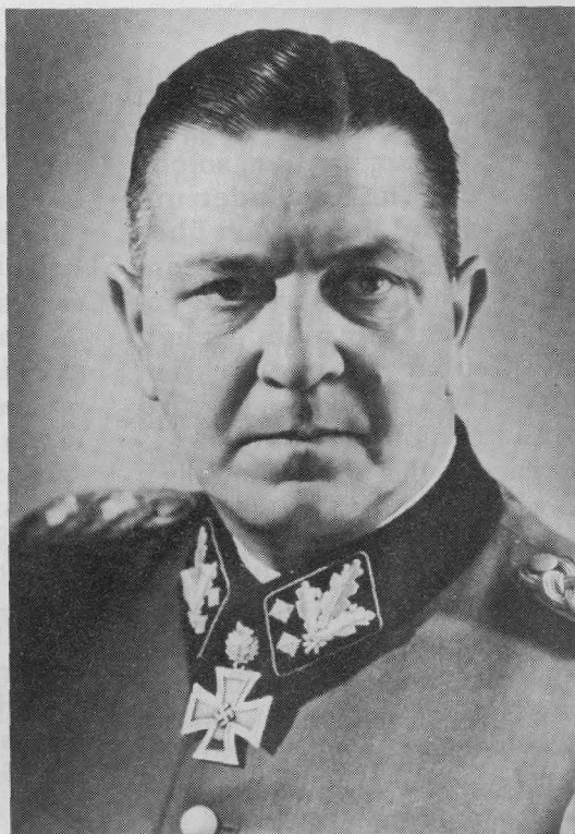
Theodor Eicke, erster Lagerkommandant von Dachau, 1934 - 1939 Inspekteur der Konzentrationslager (sein Nachfolger als Inspekteur der KL bis 1945 SS-Brigadeführer Richard Glücks), 1939 erster Kommandeur der SS-Division "Totenkopf", am 26.2.1943 als SS-Obergruppenführer und General der Polizei bei einem Flugzeugabsturz bei Orelka/Rußland ums Leben gekommen.