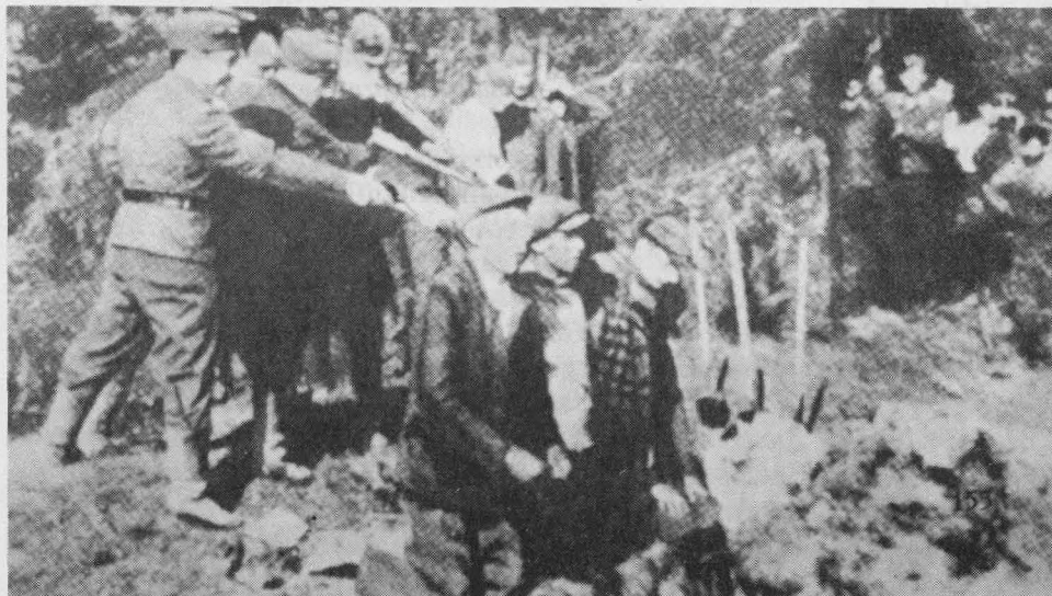
"Im Osten" aus: Robert Neumann, "Hitler -- Aufstieg und Untergang des Dritten Reiches, ein Dokument in Bildern", München - Wien - Basel 1961, S. 155.

Niemand bezweifelt, daß es ähnliche Szenen während des Rußlandfeldzuges gegeben hat, doch dieses Bild ist Malerei und daher keine "Dokumentation". Außerdem stellt der in dem genannten Buch vermittelte Eindruck, die deutsche Wehrmacht habe unentwegt friedliche Zivilisten gemordet, die Realitäten bestialischer sowjetischer Partisanenkriegführung total auf den Kopf. Würden wir Deutsche solche Bilder mit sowjetischen, polnischen, tschechischen, jugoslawischen, französischen, amerikanischen Mord-schützen in Umlauf bringen, so würden wir, obgleich es unzählige solcher Szenen tatsächlich gegeben hat, wegen Volksverhetzung im Gefängnis landen.