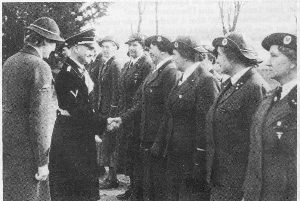
SS-Obergruppenführer Dr. Ernst Grawitz, Leiter des Deutschen Roten Kreuzes sowie Reichsarzt der SS und Polizei, begrüßt in der neu eröffneten Reichsführerschule des Deutschen Roten Kreuzes in Groß-Schulzendorf die Teilnehmerinnen am ersten Lehrgang. Dr. Grawitz beging im April 1945 Selbstmord.

Gliederung und Absatzgestaltung sind verworren,