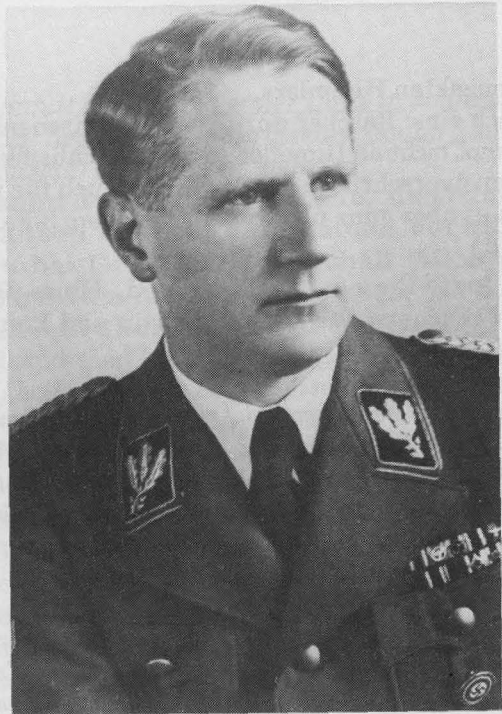
Leonardo Conti, seit 1939 Staatssekretär für Gesundheitswesen und Volkspflege im Reichs- und Preußischen Ministerium des Innern und damit Reichsärzteführer, ab August 1941 Mitglied des Reichstages, 1944 SS-Obergruppenführer. In alliierter Haft verstorben (Selbstmord?).