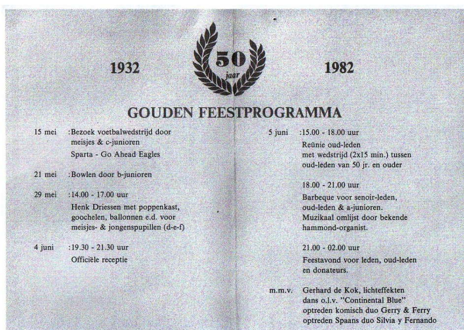
Feestprogramma 50 jarig jubileum

In september 1981 gaat de prijs van de gehaktbal naar Hfl. 1,75.