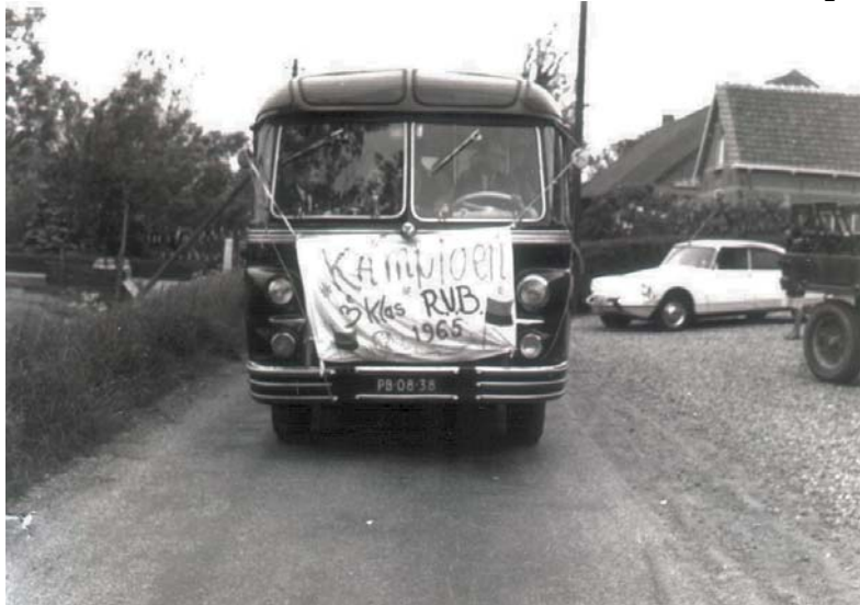
Huldiging kampioen 1965