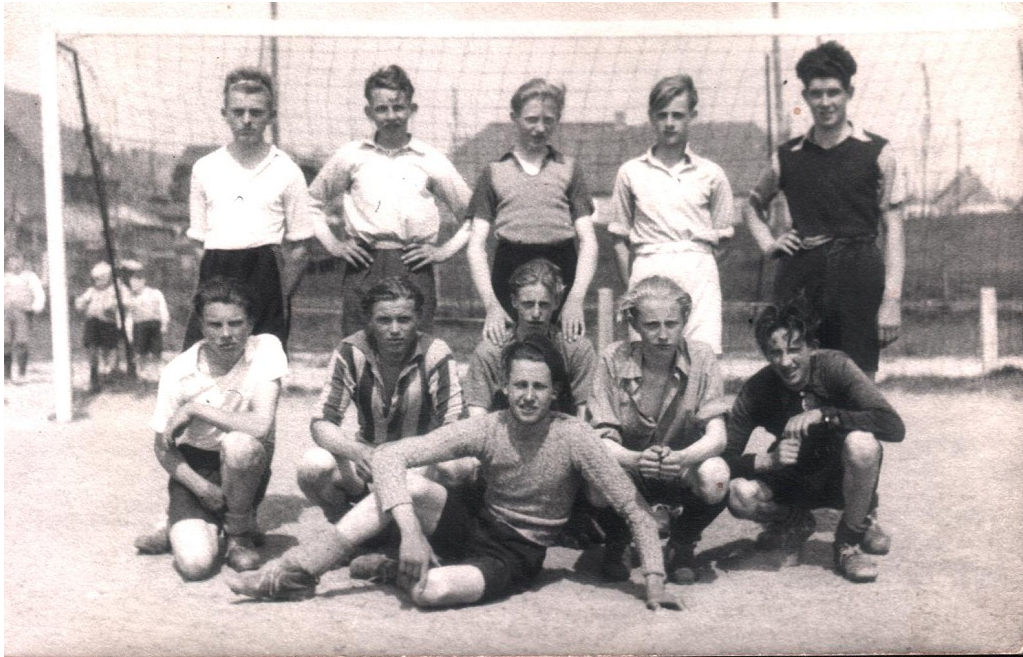
Junioren elftal 1947