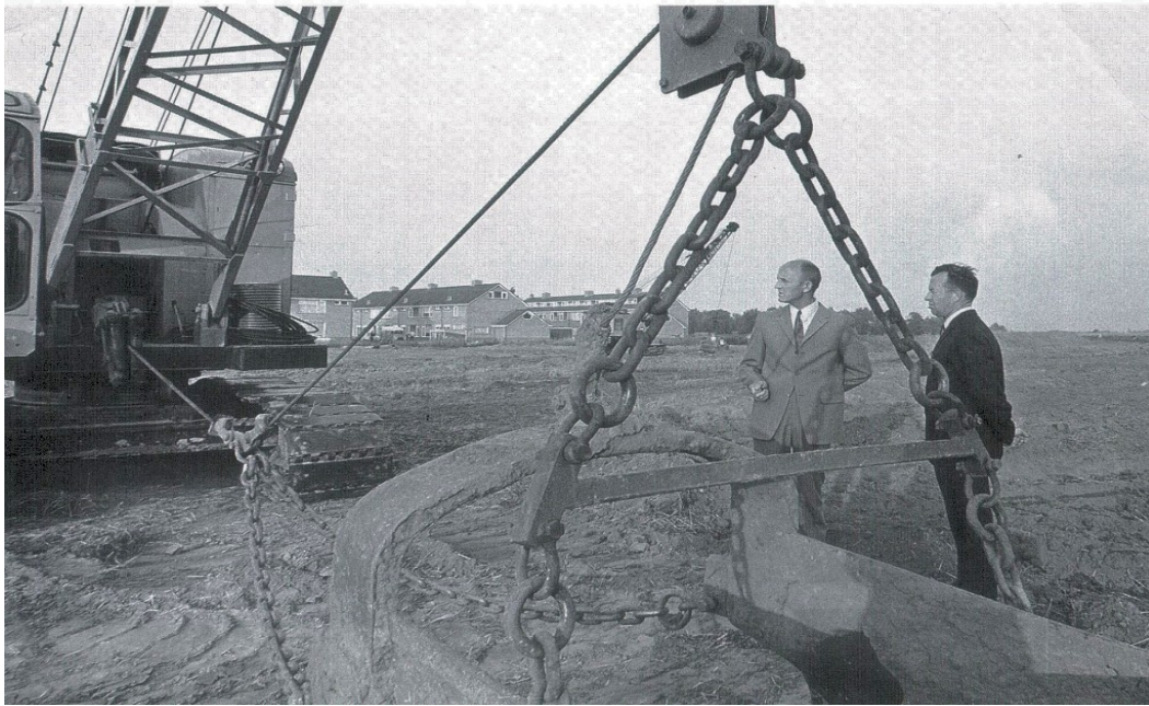
Werkzaamheden ter voorbereiding voor de bouw van de nieuwe kantine in 1970.

Een geheel nieuw sportterrein, nieuwe kantine, trainingsveld en 2 speelvelden zullen in gebruik genomen worden aan de Coosenhoekstraat aan de rand van de inmiddels aldaar gereed zijnde nieuwbouwwijk.