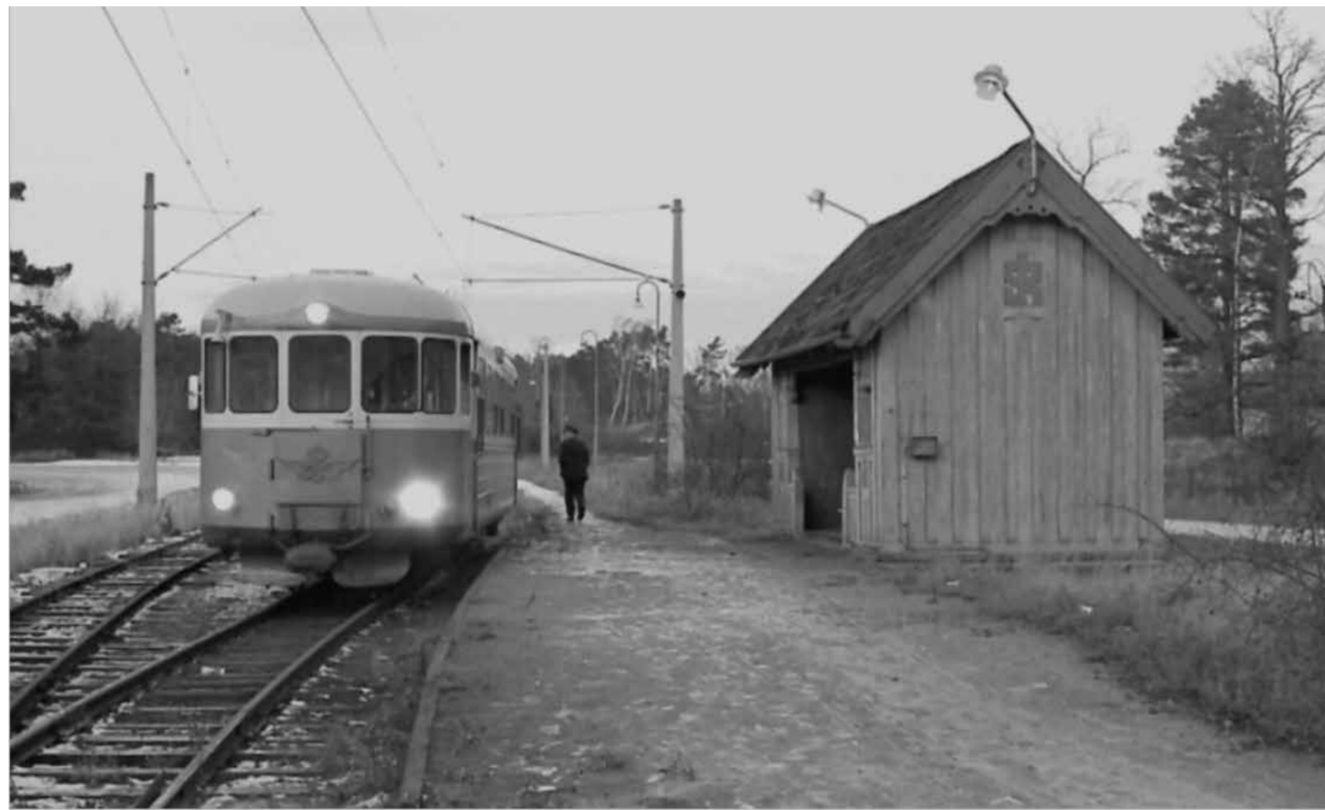
Eddavägens hållplats 1975-12-21, när bara dagar återstår innan den totala nedläggningen. Rälsbussen (eller "motorvagn littera YP") nr 796 har pliktskyldigast gjort dagens tur från Östra station och skall nu återvända dit. Turen var lagd på tidiga eftermiddagen då efterfrågan på persontransporter var som minst.