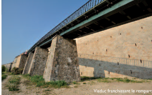
Viaduc franchissant le rempart.

L'arrivée en ville a posé un certain nombre de questions lorsqu'il s'est agi de réaliser la gare haute. La construction du viaduc sur des piles en maçonnerie le long du rempart prévoyait de s'appuyer sur une ancienne tour carrée. Le Génie autorisa les travaux de dérasement de cet édifice mais demanda à ce que le mur crénelé puisse être facilement reconstitué pour installer des tireurs à cet endroit. Quant au viaduc, il pourrait être démonté complètement ou en partie dès que la menace ennemie sur la ville rendrait ces travaux nécessaires. L'installation de la gare créa à son tour une vive polémique parmi les habitants. Le projet la situait à proximité de l'hôpital de la Charité pour profiter des bâtiments voisins qui pourraient servir d'infrastructures à la gare. La destruction de certains immeubles permettait également d'avoir le dégagement nécessaire à l'installation de voies secondaires. Cependant, les Langrois n'avaient pas ces préoccupations techniques. Pour eux cette gare était mal située car le quartier n'était pas le plus représentatif de la beauté de leur ville, et surtout