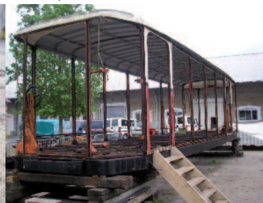
Démontage de la carrosserie.