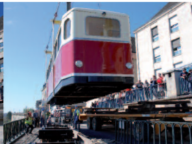
Pose de la Crémaillère sur le viaduc.