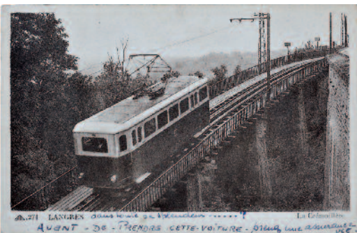
La Crémaillère sur le viaduc vers 1950.

Fasciné par le va-et-vient de l'automotrice, nombre de Langrois et de touristes photographièrent et filmèrent la Crémaillère rouge et jaune de Langres. Au même titre que la cathédrale ou la tour de Navarre, elle était vendue en cartes postales dans toutes les librairies de Langres.