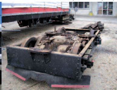
Prélèvement des bogies.