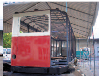
Remise en place de la carrosserie.