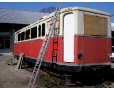
Démontage de l'intérieur.