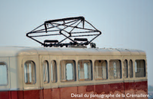
Détail du pantographe de la Crémaillère.