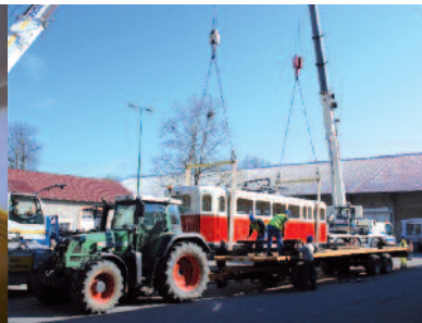
Transport des différents éléments.