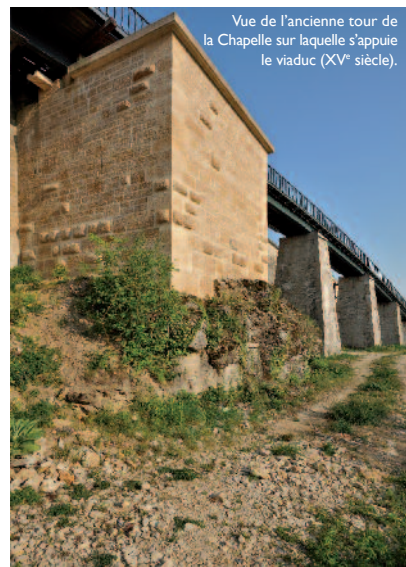
Vue de l'ancienne tour de la Chapelle sur laquelle s'appuie le viaduc (XV e siècle).

Avec les premiers trajets en Crémaillère, commencèrent aussi les premiers désagréments pour les voyageurs. En raison de la forte pente, lorsque les températures étaient très élevées et le chargement trop important, il fallut de temps à autre pousser le convoi pour arriver jusqu'en ville. Mais cela n'empêcha pas le train de fonctionner pendant 47 ans et de monter vaillamment la pente sous la conduite du personnel municipal posté à bord. Le personnel en charge de l'exploitation de la Crémaillère était composé d'agents municipaux. Leur uniforme, fixé par délibération du Conseil Municipal, était composé notamment d'une casquette aux armes de la ville de Langres. Sous les ordres d'un chef de gare, le personnel se composait d'un sous-chef de gare (en charge du service de nuit), d'un homme de peine à la gare haute, de deux chefs de train garde-freins, deux