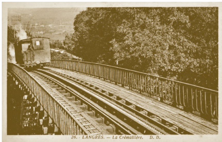
Vue de l'échelle de crémaillère.

La crémaillère de Langres utilisait également sur les parties les moins pentues du parcours la simple adhérence, comme n'importe quelle locomotive.