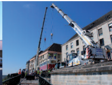
Levage de la motrice.