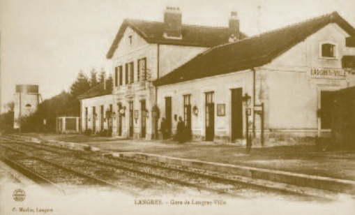
La gare de "Langres-Ville" vers 1900 (Coll. Bibliothèque Municipale).

Hélas, la ligne actée par le Ministre des Travaux Publics passait par Chalindrey et regagnait la gare de Langres-Marne sans s'approcher de la ville.