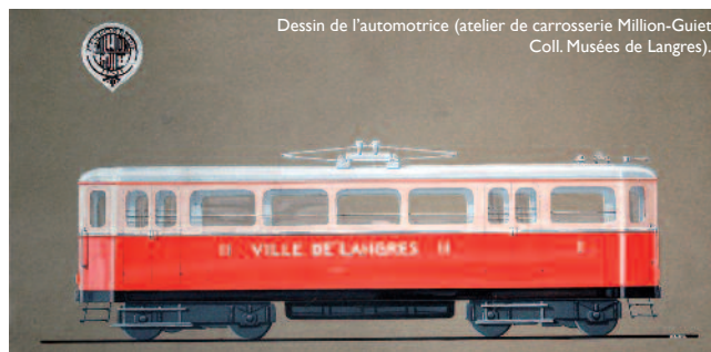
Dessin de l'automotrice (atelier de carrosserie Million-Guiet Coll. Musées de Langres).

Les nouvelles automotrices, pimpantes et fringantes, assuraient leur circuit avec efficacité. A cette époque, trente-deux trajets allers-retours étaient effectués sur la ligne de Langres-Cité à Langres-Marne pour assurer les correspondances avec les trains du réseau de l'Est.