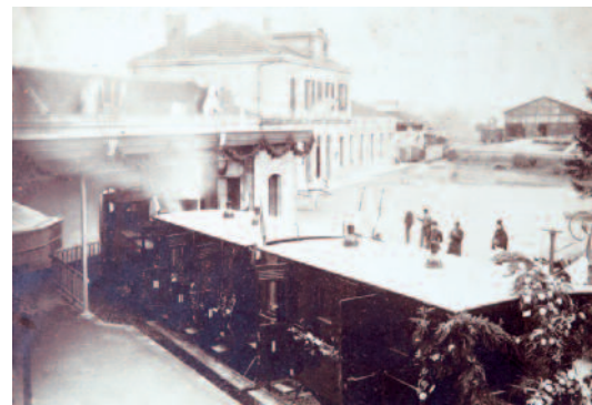
La gare basse et la Crémaillère lors de l'inauguration le 6 novembre 1887.

La remise en place sur le viaduc à proximité de l'hôpital a eu lieu le 28 avril 2010. La motrice et les bogies ont été déplacés séparément pour réduire le poids de l'ensemble.