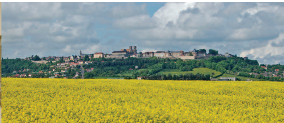
L'acropole de Langres vue de l'Est (Photo : G. Féron).