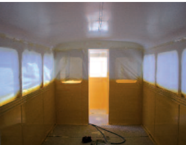
Peinture de l'intérieur.