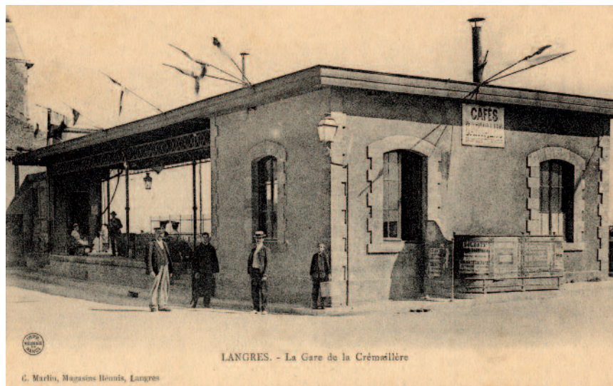
La gare haute de la Crémaillère vers 1900.

Un an plus tard, la « Société des Automobiles Renault » proposa de prêter des autobus pour tester une liaison de la gare à la ville. Là encore, la solution n'était pas satisfaisante puisque les cars encombraient les rues, ne pouvaient pas transporter certains bagages et avaient beaucoup de mal à respecter les horaires... De plus, la remise en état récente de la voie incitait à continuer l'exploitation de la Crémaillère. Le choix de l'électricité devenait à nouveau la seule alternative à la vapeur.