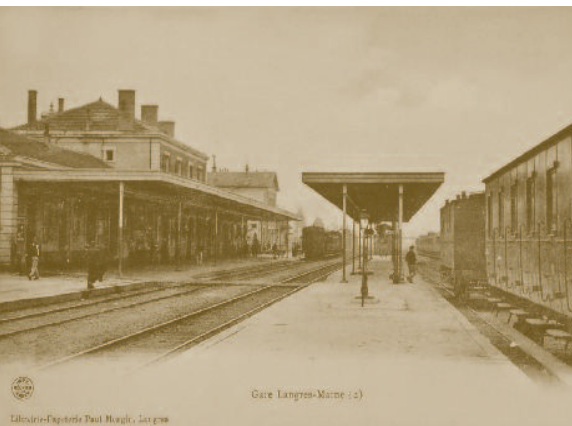
Les quais de la gare de Langres-Marne vers 1900.

Au XIX e siècle, à l'heure où les voies de communication se développent sur le territoire, la ville de Langres peine à s'ouvrir sur le monde extérieur. Perchée sur son éperon pour se protéger des menaces, la ville natale de Denis Diderot doit réagir pour ne pas assister en spectatrice aux avancées technologiques de l'époque et à leurs arguments commerciaux. L'arrivée du chemin de fer en Haute-Marne va sceller le destin de la cité pour de nombreuses années.