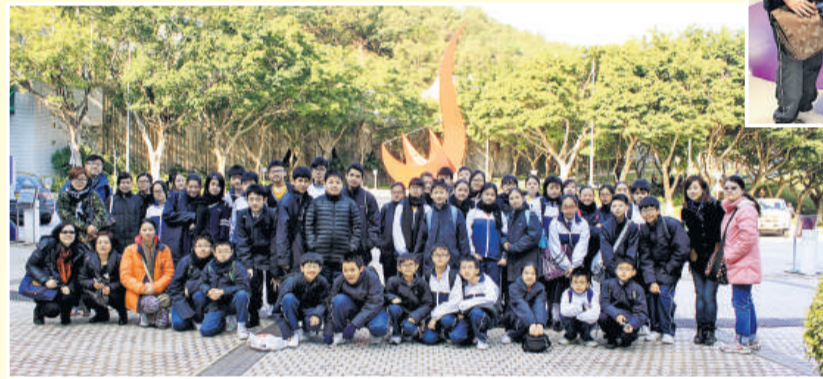
▲學生參觀科大，了解大學環境及特色。