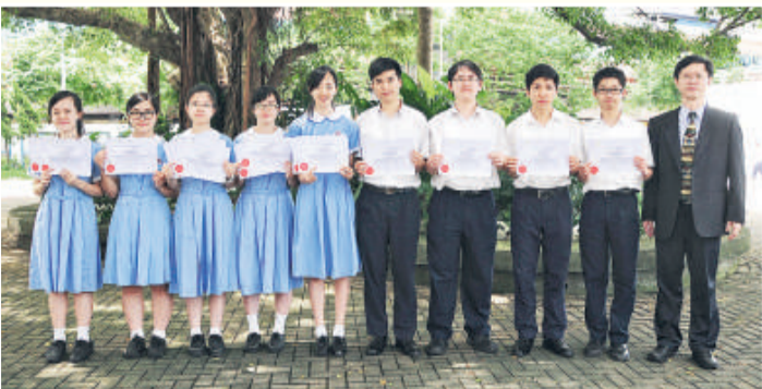
▲顯理推動資優教育不遺餘力，學生在多方面均有出色表現。

為照顧能力較佳的學生，顯理早在十多年前已參加香港資優教育學苑的資優生計劃，學生如於數學、科學、人文科學及領導才能四方面有出色表現，校方將向學苑作出提名，學生必須通過考核，方能成為資優學員。資優計劃課程的宗旨是讓學生嘗試初步接觸大學課程，並藉多元化學習啟迪他們的智能發展，學生均表示獲益良多。除達大學程度的數理課程外，尚有耕種、風帆、歷史博物館導賞等不同體驗。該校學生更獲選到新加坡參加數學交流團，在萊佛士書院與當地學生交流。相信透過資優課程及與全港的資優學生交流，能讓顯理學生擴闊視野，開創未來。