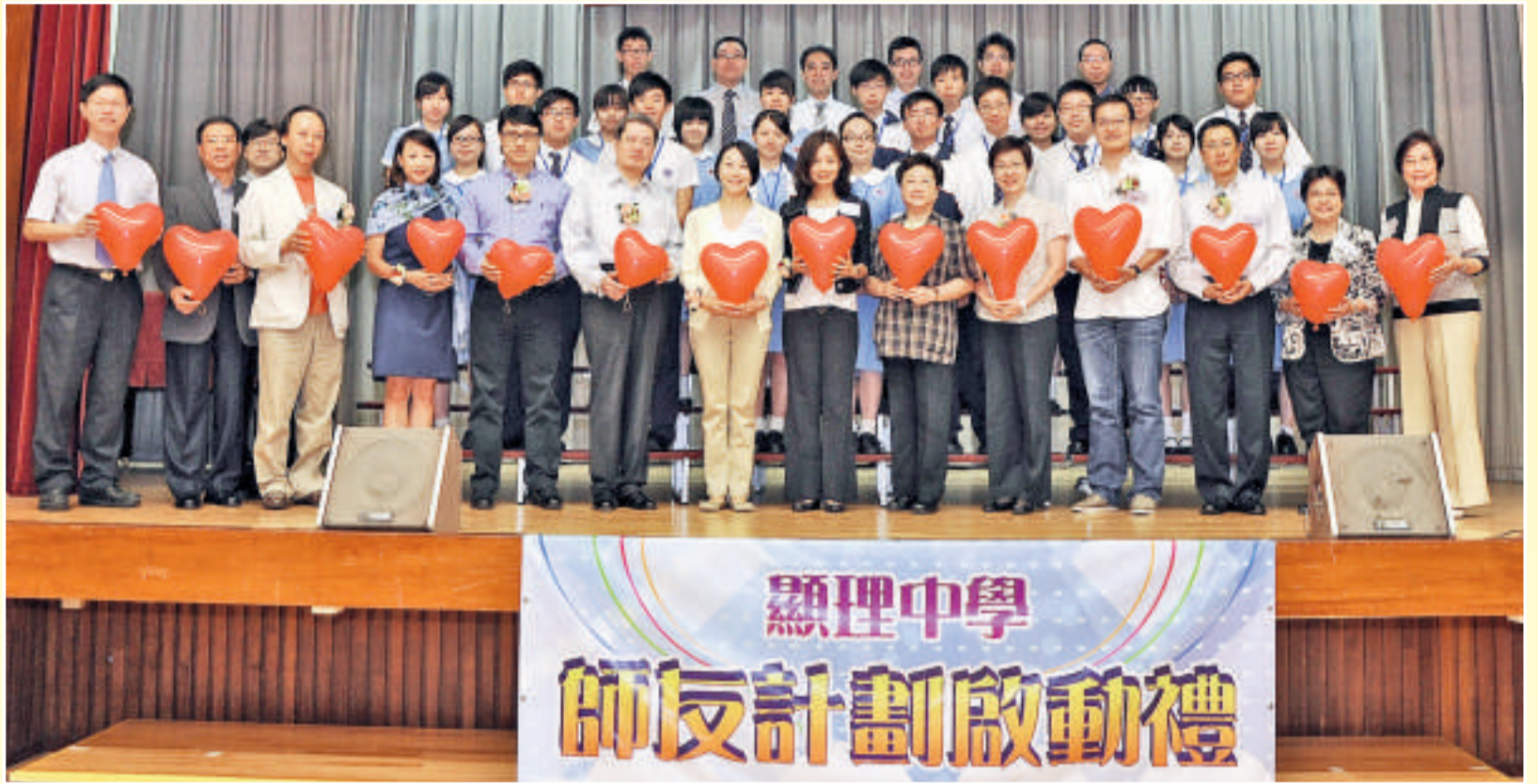
▲顯理透過師友計劃促進母會會友、校友與在校學生的聯繫。

自此顯理經歷三遷，由羅便臣道、柏道，至今日的北角城市花園道校舍，為學生預備良好的學習環境而努力。同時，顯理積極透過傳燭禮、心智教育、德育輔導、慈惠奉獻、課程統整及傳福音等，致力用愛感染學生，並一滴一滴啟迪學生，培養學生成材。