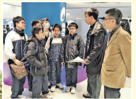
▲學生細心聆聽校方代表介紹課程特色

為使學生能親身了解和感受大學校園的生活面貌，初中通識科與升學及就業輔導組合辦參觀大學活動，分別參觀了香港大學、香港中文大學、香港科技大學、香港理工大學及香港浸會大學。就讀各間大學的師兄師姐，親身帶領同學參觀，學生不但能更了解各大學的特色和要求，還能獲得師兄師姐的勉勵，盡早確立志向。