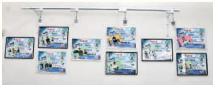
▲顯理學生近年在香港中學文憑試成績優異

自香港中學文憑試推行以來，為對學生於公開試考獲佳績表示肯定，也期望他們的優異表現成為學弟學妹的典範，特別推行「星之子」計劃。凡於文憑試中考獲五*或五**者，均獲冠以「星之子」之名，並於校園張貼「星之子」造型海報，分享「星之子」的夢想、讀書心得、成功之道及對學弟學妹的贈言。成績單上的星號，是學生多年努力成果的，照亮了同學未來的道路。而每名學生的星光也交匯聚合，凝聚成閃亮的銀河星宿，以繁星的光芒照遍整個校園。