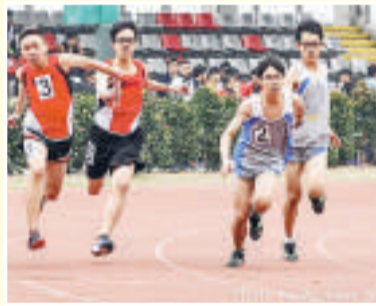
▲顯理培育了不少體育運動精英

顯理相信意志堅毅及勇往直前是學習過程，也是人生路上必須具備的重要元素。該校田徑隊正能體現這份剛強與堅韌的鬥志。多年來，田徑隊隊員無懼風雨，堅持不懈，以汗水及傷痕見證田徑隊的成長。刻苦的鍛煉讓該校的田徑隊獲得肯定，榮獲多個獎項。2013-14年度是田徑隊豐收的一年，在中學校際田徑錦標賽榮獲女子全場總冠軍，該校的田徑隊亦攀升至第二組別。田徑隊的成績持續輝煌，2014-15年度中學校際田徑錦標賽榮獲男子丙組冠軍、中學校際越野比賽榮獲女子甲組隊際冠軍、女子丙組隊際殿軍及女子全場總季軍。未來田徑隊必定繼續秉持體育精神，團結一致，再創佳績。