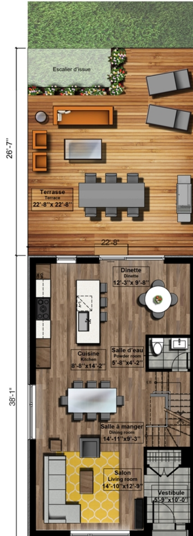
Rez-de-chaussée First floor