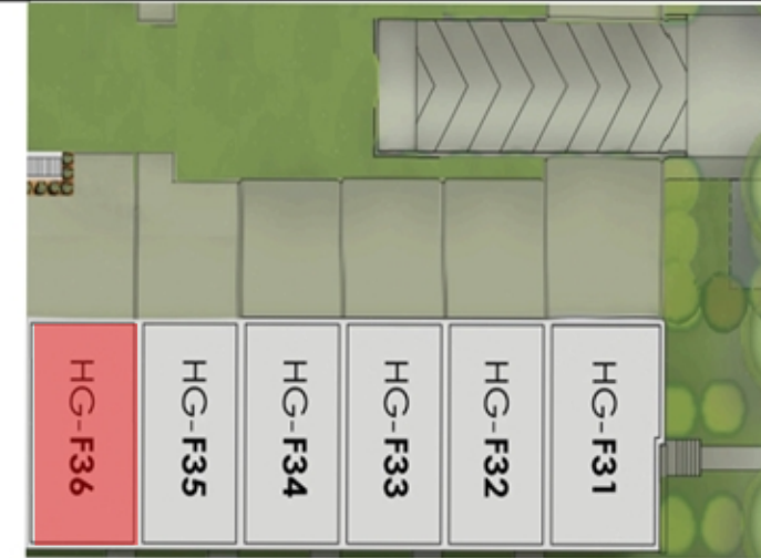
Implantation Site plan