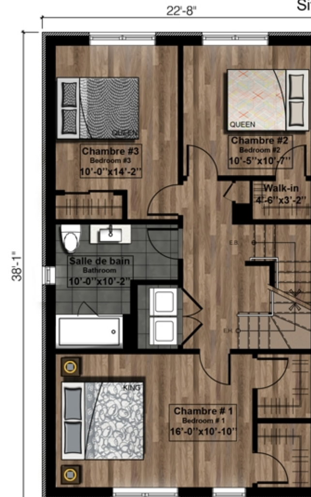
Étage Second floor