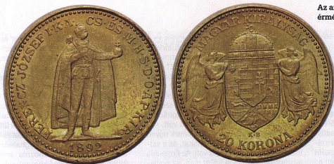
Az aranykorona-rendszer első érméje. Nemesfémekben mérték

OSZTRÁK-MAGYAR KORONA | KÖZÖS PÉNZ | WEKERLE KLASSZISA