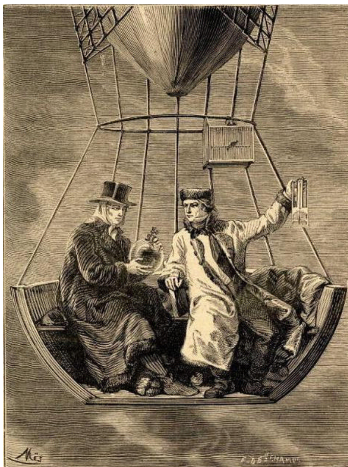
Figure 2 : Gay-Lussac (à g.) et Biot (à dr.) en aérostat. Dans le jardin du Conservatoire des arts et métiers, le 20 août 1804, fut lancé un aérostat dans lequel

L'année 1804 voit une aventure audacieuse de Gay-Lussac : Berthollet s'intéressait à la composition de l'air en fonction de l'altitude, son collègue et ami, l'astronome et mathématicien Pierre Simon de Laplace (1749-1827) voulait vérifier la réfraction de la lumière. Dans ces conditions Gay-Lussac et Jean Baptiste Biot (1774-1862) élève de Laplace, font en août une ascension en ballon jusqu'à 4000 mètres d'altitude ; trois semaines plus tard, Gay-Lussac recommence, seul cette fois, et atteint l'altitude-record de 7016 mètres. Il a mal à la tête, mais l'attribue aux insomnies de la nuit précédente.