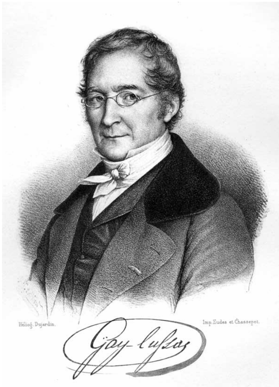
Figure 1 : Portrait de Louis-Joseph Gay-Lussac.

par Pierre Radvanyi Directeur de recherche honoraire au CNRS