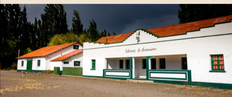
Casco histórico de la Estancia La Ascensión

Distancia: 2,2 km; 50 minutos Exigencia baja: El regreso de la costa requiere un ascenso por una pendiente arenosa