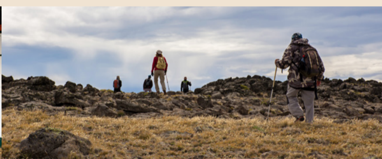
Trekking en la Meseta Lago Buenos Aires