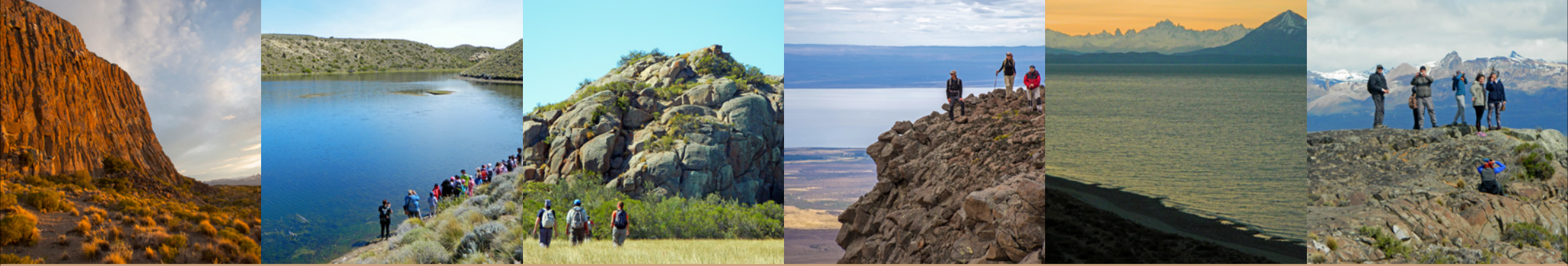
Cerro La Calle