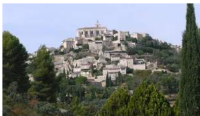
Byen Gordes med slottet fra 1031

Etter den offisielle lagskytingen ble det testet ut mixteam i hver buetype. Her stilte Liv og Bjørn opp i instinkt med finaleplass og sølv som resultat. Tapte dessverre finalen mot Sverige.