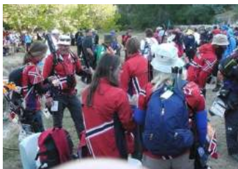
Norske skyttere klare for utmarsj.

Av de tre løypene som var satt var det kun noen mål på den ene som var på begge sider av tilførselsveien mot treningsfeltet og utgangsområdet som var tilgjengelig. Resultatene innledende var nok ikke slik man hadde håpet, men vi hadde tre skyttere med til 1. eliminering.