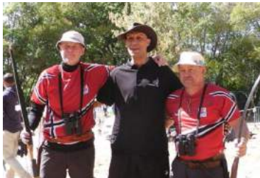
Forbrødring Norge – New Zealand

Praten gikk livlig, og en følte seg nesten som hjemme under et NM.