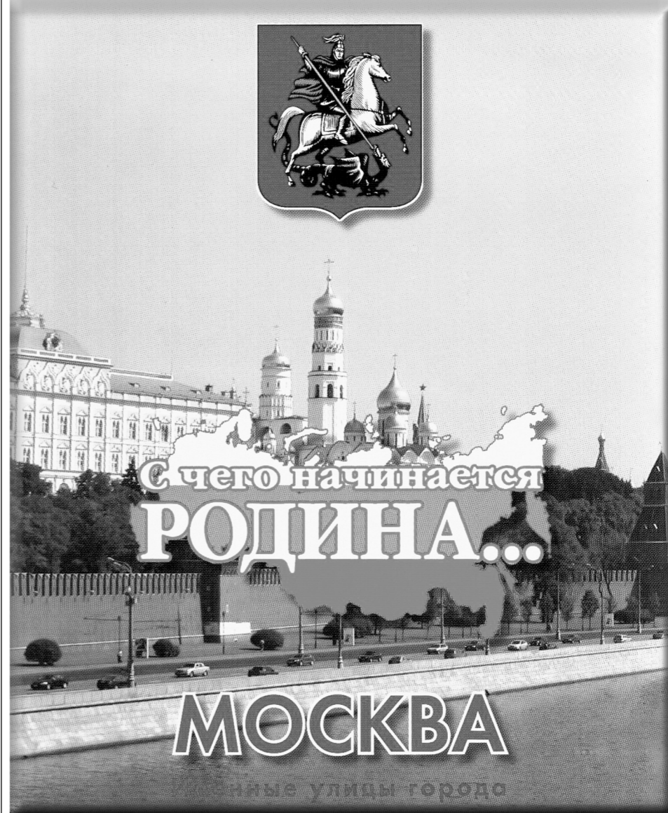
Москва. Именные улицы города. – М.: ООСТ, 2010. – 600 с.

И вот – книга есть. Солидный, красивый том, в который вложена прекрасная идея, прекрасно воплощённая в жизнь.