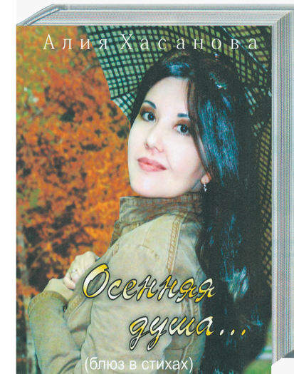
Хасанова А. Осенняя душа. Астана: «Каз-ПрофНС», 2011. — 263 с., ил.

и уверенно идущей в чрезвычайно сложную и противоречивую жизнь, непосредственный взгляд на жизненные реалии, стремление к пониманию сути живой действительности и преодолению её негатива. На всё это человек способен лишь тогда, когда он окрылён чувством, дарованным свыше — любовью. Именно любовь как проявление высшего человеческого духа является камертоном поэтических строк автора.