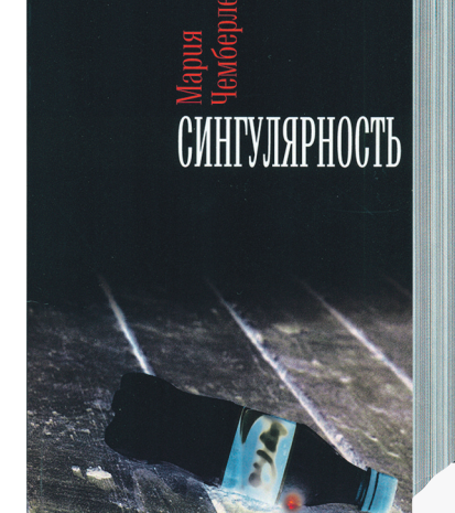
Мария Чемберлен. Сингулярность. М.: ИПО «У Никитских ворот», 2012. — 156 с.