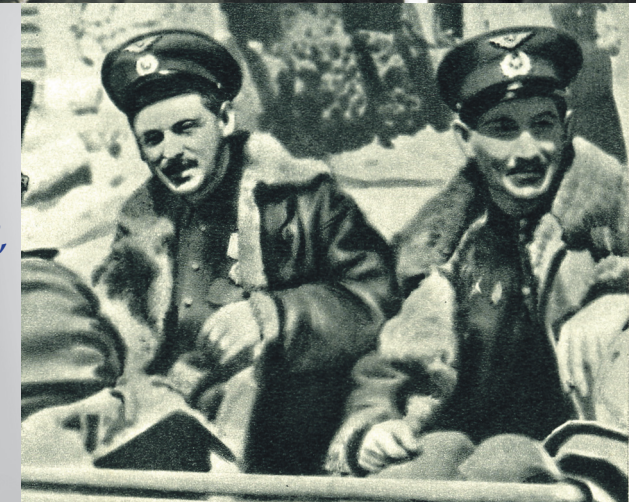
С.В. Михалков и Г.А. Регистан в действующей армии в Симферополе (2 апреля 1944)