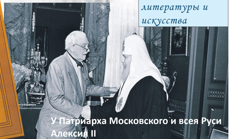
У Патриарха Московского и всея Руси Алексия II

1997 год. Член Комиссии при Президенте РФ по Государственным премиям в области литературы и искусства