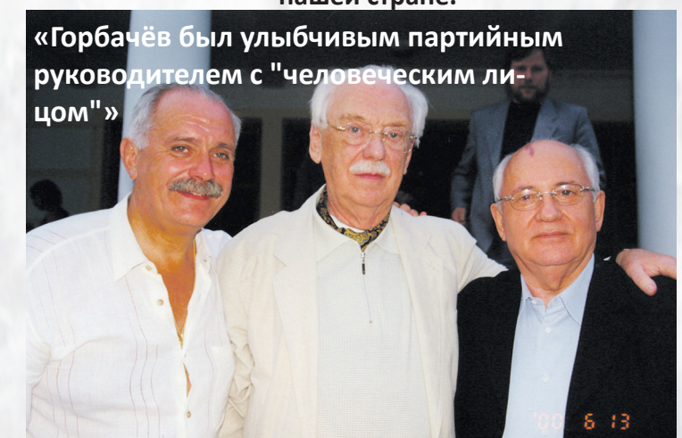
«Горбачёв был улыбчивым партийным руководителем с "человеческим лицом"»

1964 год. Член Коллегии Министерства культуры СССР