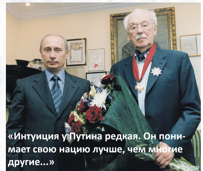
«Интуиция у Путина редкая. Он понимает свою нацию лучше, чем многие другие...»