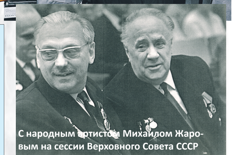
С народным артистом Михаилом Жаровым на сессии Верховного Совета СССР

1970 – 1989 годы. Депутат Верховного Совета СССР