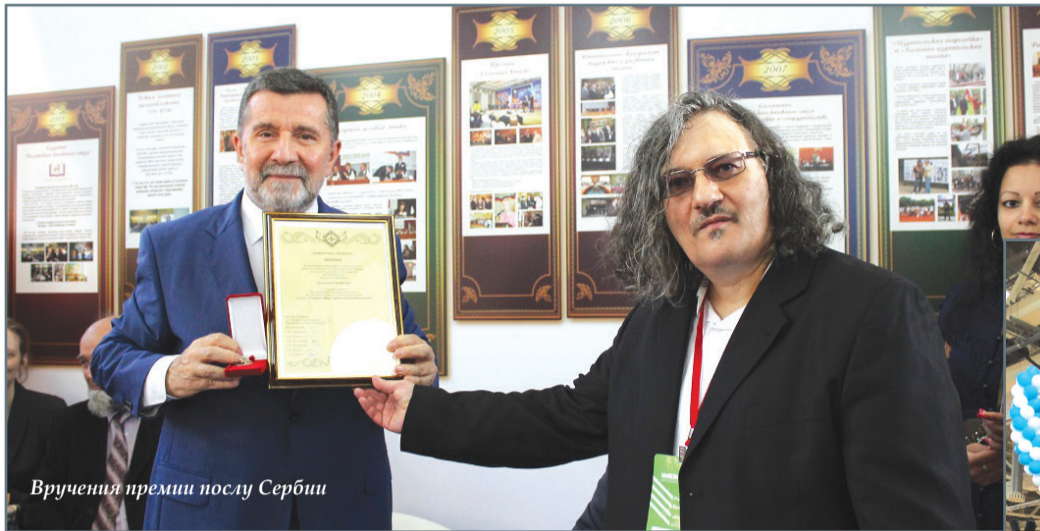
Вручение премии послу Сербии

Издательство «Вече» на Московской книжной ярмарке