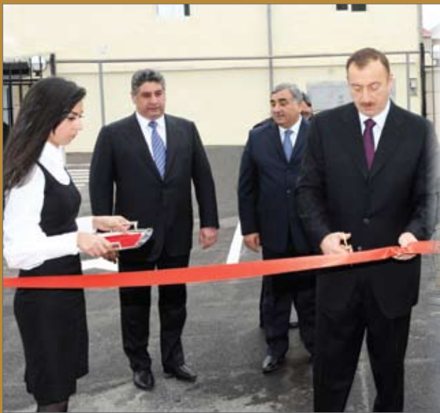
Olimpiya-İdman Kompleksi istifadəyə verildi