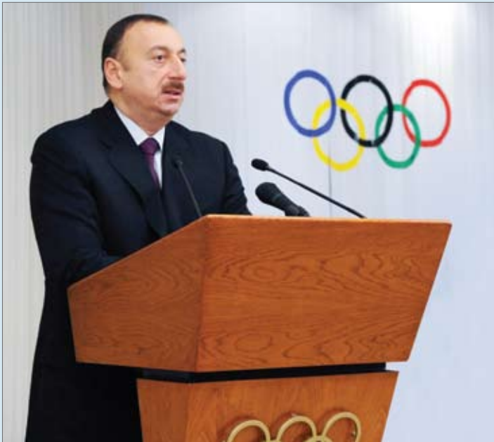
Prezident İlham Əliyev idman ictimaiyyəti ilə görüşdü

İlin ən yaxşıları "Buta Palas"da elan edildi