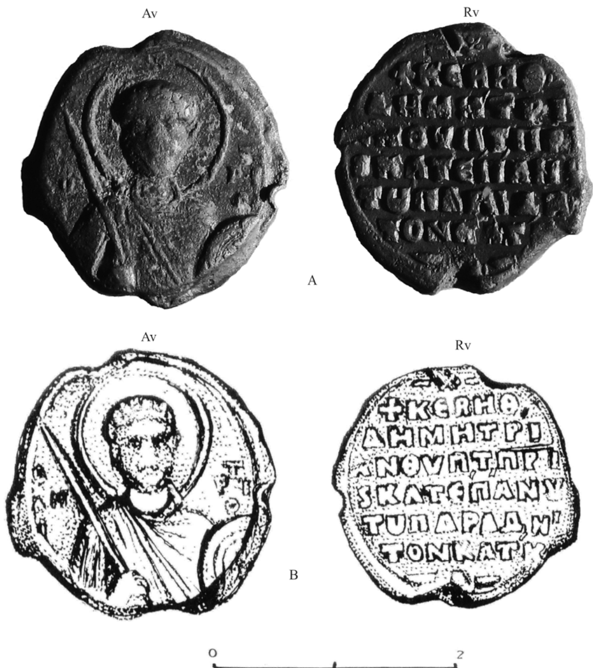
Pl. 4. Sigiliul lui Katakalon, de la Cataloi (jud. Tulcea) (sec. XI). A. foto; B. desen.