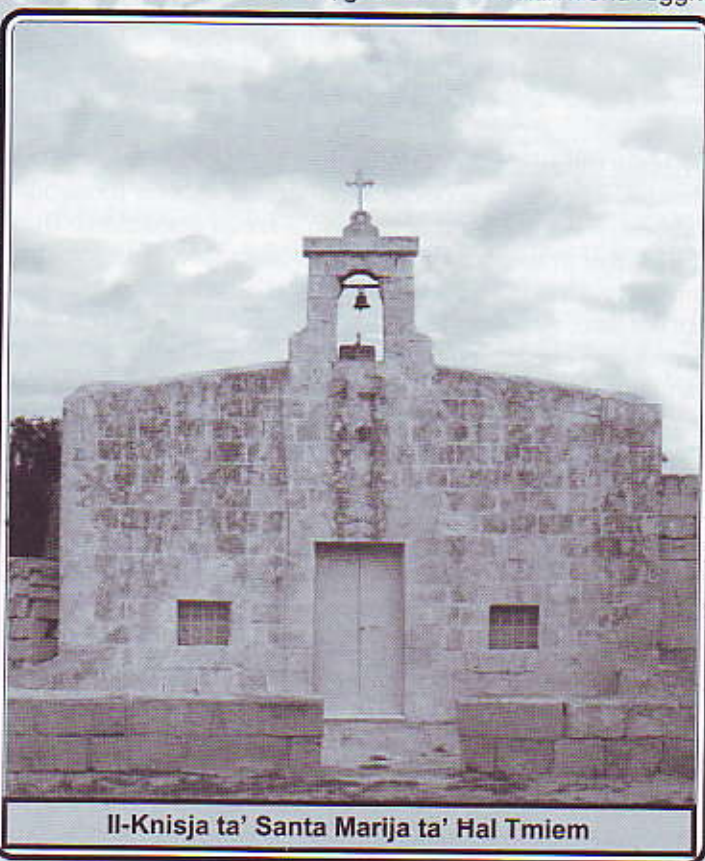
Il-Knisja ta' Santa Marija ta' Hal Tmiem