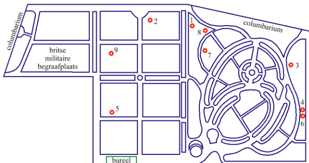
Схема лёвенского кладбища (Hoofdbegraafplaats) с расположением захоронений.