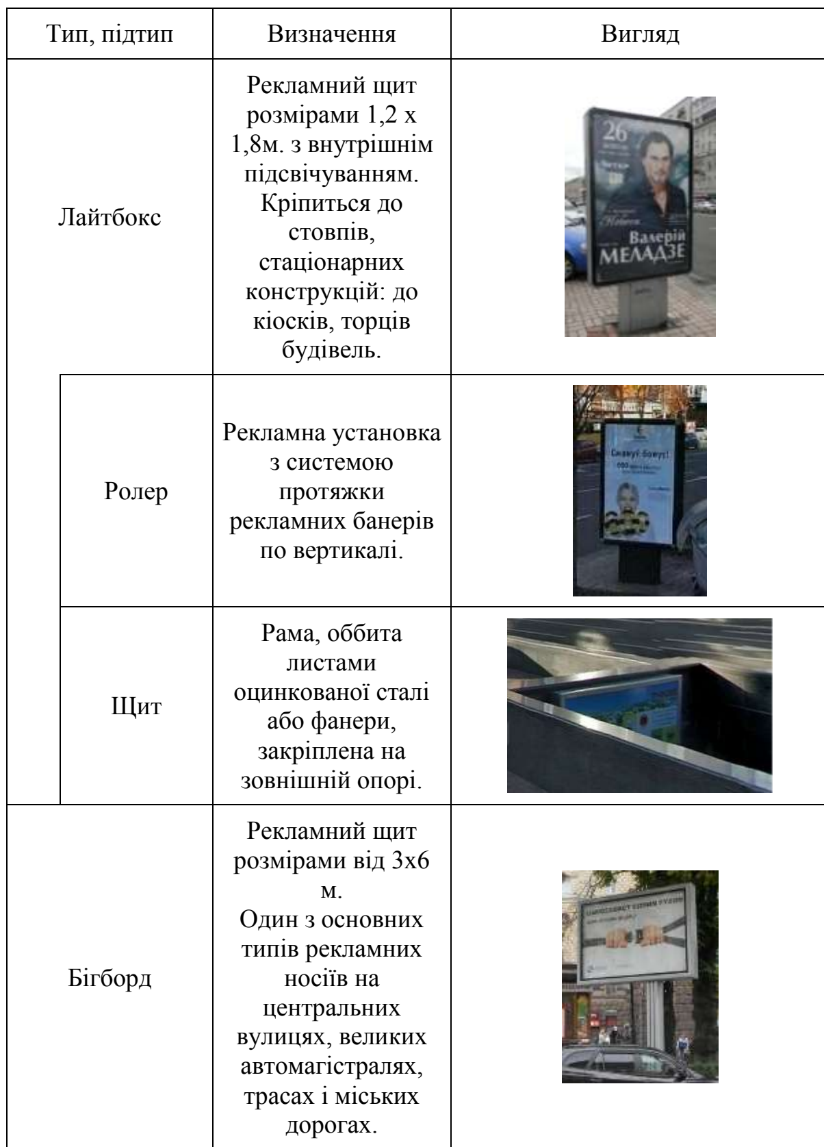
Таблиця 1.5.1.1. Характерні прийоми розміщення реклами та інформації на вул. Хрещатик