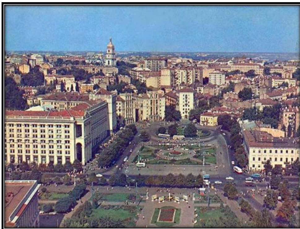
Малюнок 2.5.1. Площа Калініна.

При цьому, не відбувається відділення площі від вулиць. Візуально вона обмежується лише сторонами будівель. Незамінним елементом ансамблю площі в цілому є шість фонтанів, спрямованих до великого скляного куполу, сам цей купол, стела та надземна частина ТЦ «Глобус». Інші елементи є вирішеними окремо, кожен має своє оточення.