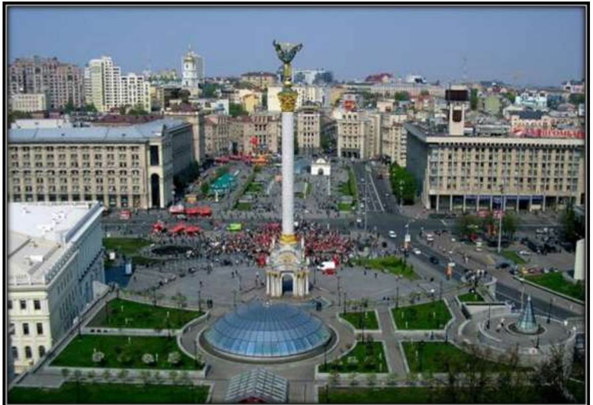
Малюнок 2.5.3. Майдан Незалежності (вид з боку готелю «Україна»).