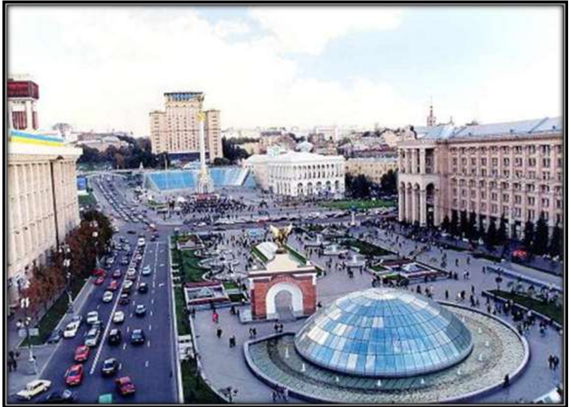
Малюнок 2.5.4. Майдан Незалежності (вид на готель «Україна»).