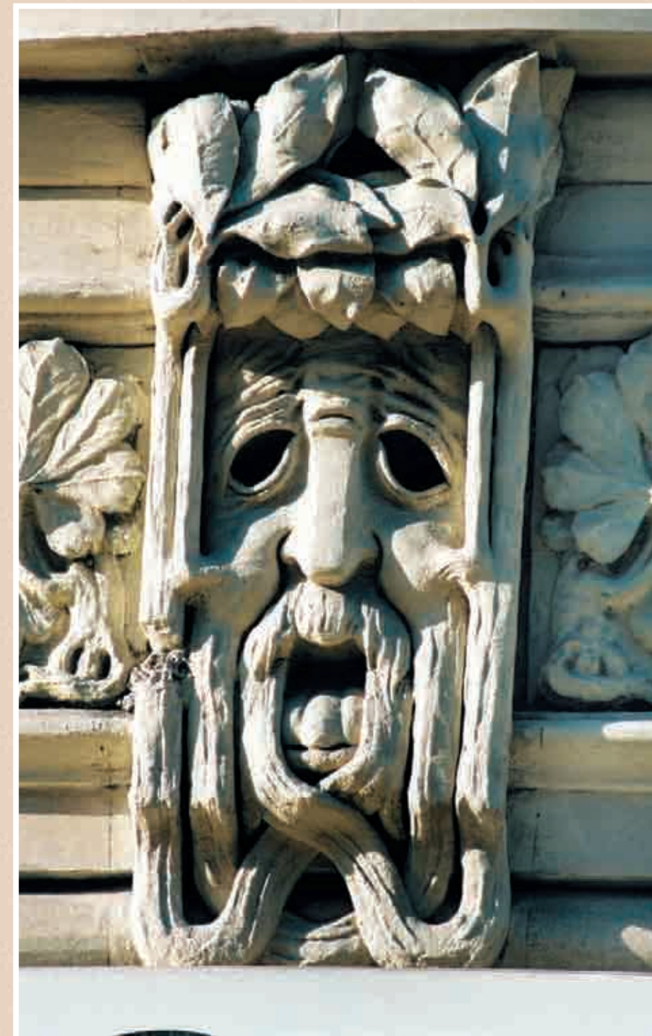
Фрагмент дома №5 на улю Алиярбекова (ул. Милютинская, здание Тифлиского Коммерческого Банка)

Exploring Baku's Art Nouveau buildings we can see the interrelation between the social status of a property owner and his chosen style. Due to customers there were buildings of new types and functions in Baku, such as clubs of public assemblies, buildings