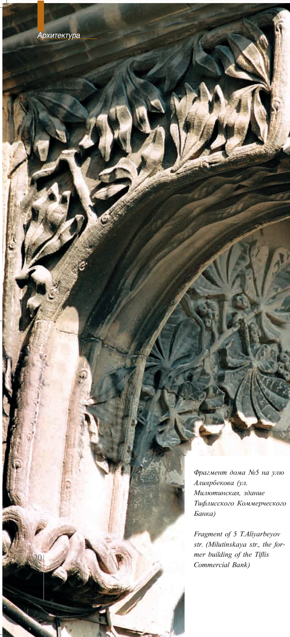
Фрагмент дома №5 на улице Алиярбекова (ул. Милютинская, здание Тифлисского Коммерческого Банка)

Fragment of 5 T.Aliyarbeyov str. (Milutinskaya str., the former building of the Tiflis Commercial Bank)