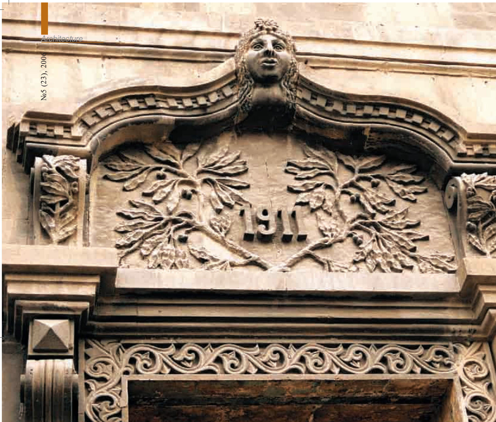
Фрагмент жилого дома №131 на улице Толстого (Гимназическая). 1911г. Fragment of the dwelling house, 131 Tolstoy (Gimnazicheskaya) str. 1911

for education and industrial enterprises, banks, rent and dwelling houses. Tastes and financial opportunities of customers were reflected in architecture of Art Nouveau style in Baku.