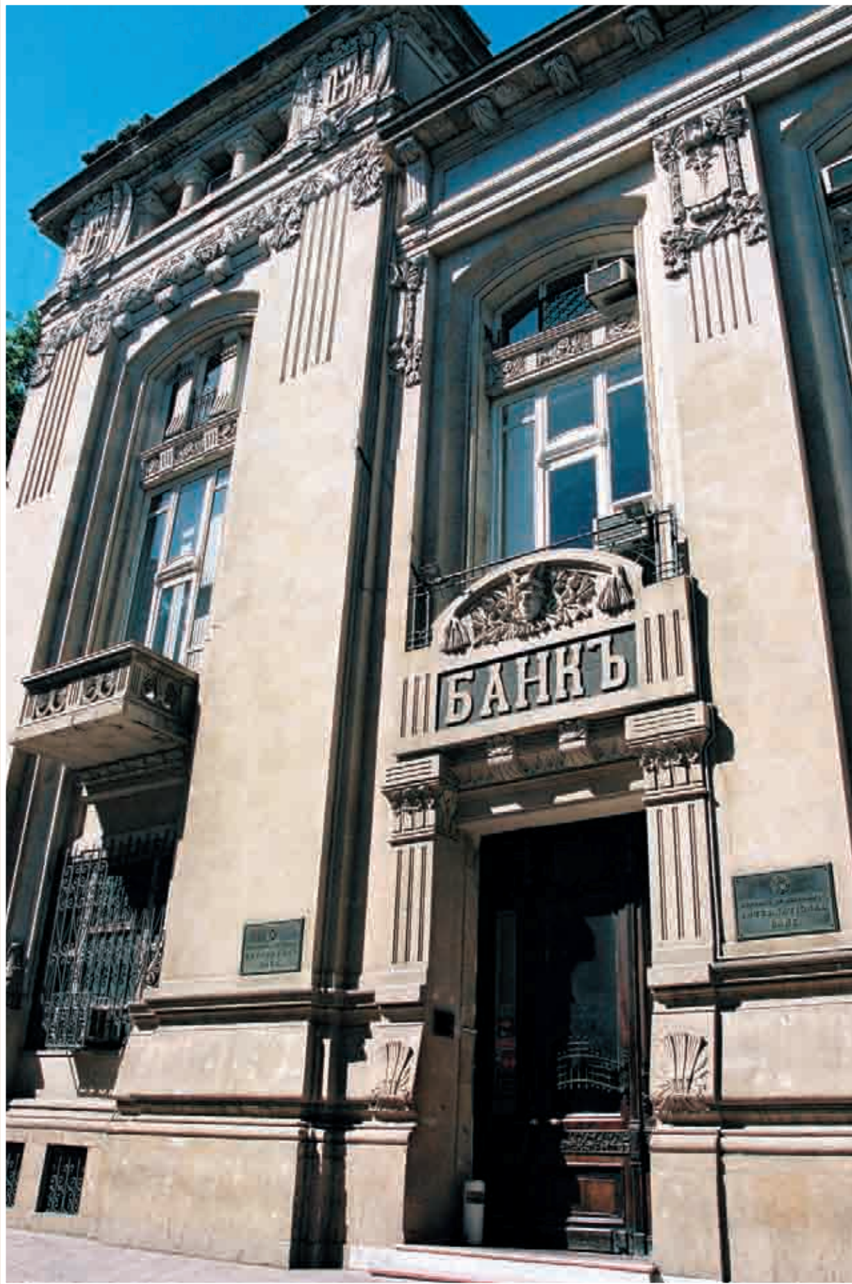
ул.Г.З.Тагиева, (Горчаковская, здание "Северного Российско-Азиатского банка" 1903-1905) H.Z.Taghiyev str. (Gorchakovskaya, building of the "Russian-Asian Northern Bank" 1903-1905)