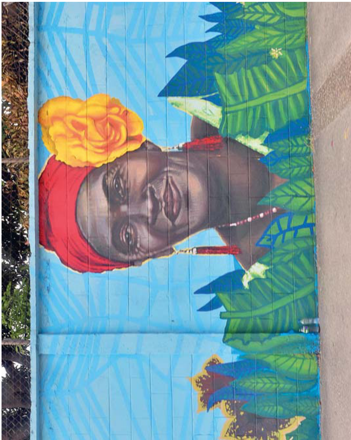
AV. PEDRO MENÉNDEZ GILBERT (GUAYAQUIL)