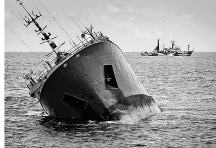
CHASING THE THUNDER MUESTRA LA PERSECUCIÓN A UN BARCO FURTIVO POR PARTE DE SEA SHEPHERD, ORGANIZACIÓN QUE DEFIENDE, POR LA FUERZA, A LA VIDA MARINA.