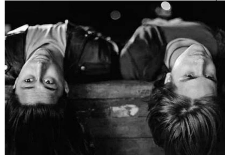
FERIADO , DE DIEGO ARAUJO, CUENTA LA HISTORIA DE UN JOVEN DE LA CLASE ALTA QUITEÑA QUE DURANTE UN VIAJE A UN PUEBLO DE LA SIERRA SE ENAMORA DE UN ROCKERO LOCAL.