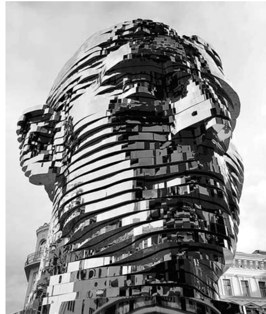
ESTATUA DE KAFKA EN PRAGA CONSTRUIDA CON ESPEJOS. EL REFLEJO JUEGA CON ESE MIEDO DE VERSE A SÍ MISMO. EL ESCRITOR HABÍA PEDIDO A MAX BROD QUE INCENDIARA SU OBRA.

Se refiere a sus aforismos, un libro inacabado, e inacabable si lo que se intenta es leerlo, aprenderlo. El misterio de lo inacabado —que viene a ser a la larga el propio misterio del mundo— es uno de los encantos de la literatura, como lo es de la vida: ¿En qué precipicio se acaba un paisaje? Luego de leer una novela ejemplar, ¿seguimos construyéndola con nuestro vivir, con nuestra forma de imaginársela, con nuestro —y de alguna manera prodigioso— olvido? CP