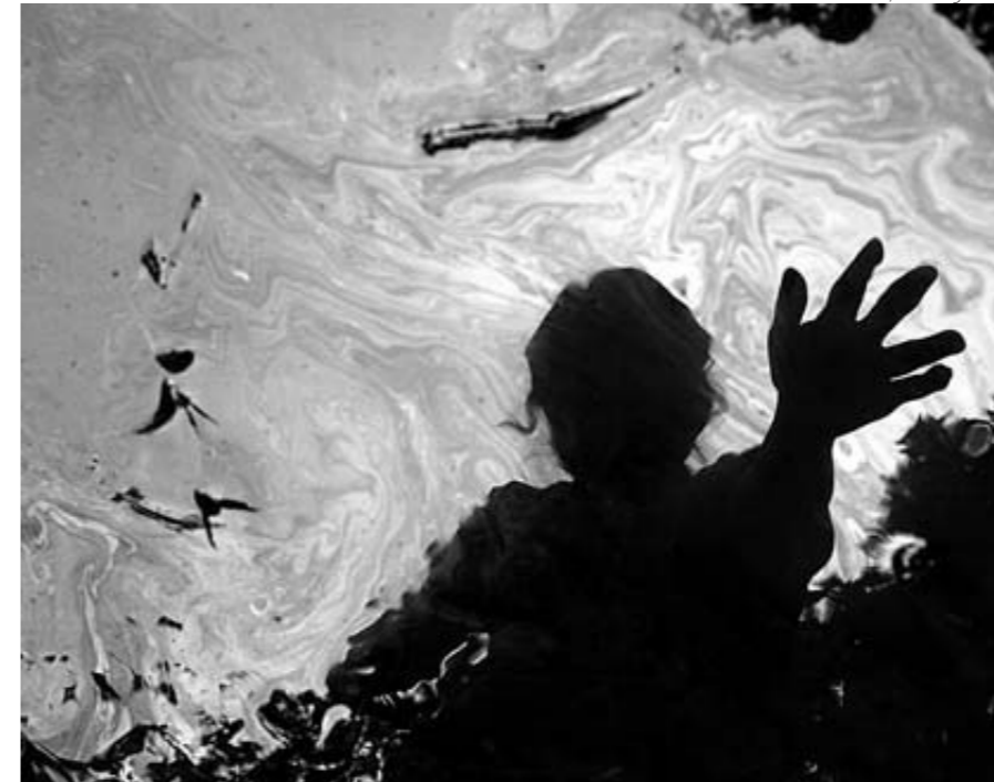
EN ECUADOR SE PROYECTARÁ CRUDO, AL CUMPLIRSE 10 AÑOS DE SU ESTRENO. EL FILME NARRA LA BATALLA LEGAL ENTRE COMUNIDADES DE LA AMAZONÍA Y LA PETROLERA TEXACO.