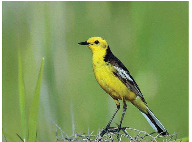
Sanbaşı kuyruksallayan ( Motacilla citreola )

■ Yerel İlgili Sahipleri Ağrı Valiliği; Ağrı İl Çevre ve Orman Müdürlüğü; Ağrı İl Çevre Koruma Vakfı; Tema Vakfı; Ağrı Temsilciliği; Çevre Koruma ve Güzelleştirme Derneği.