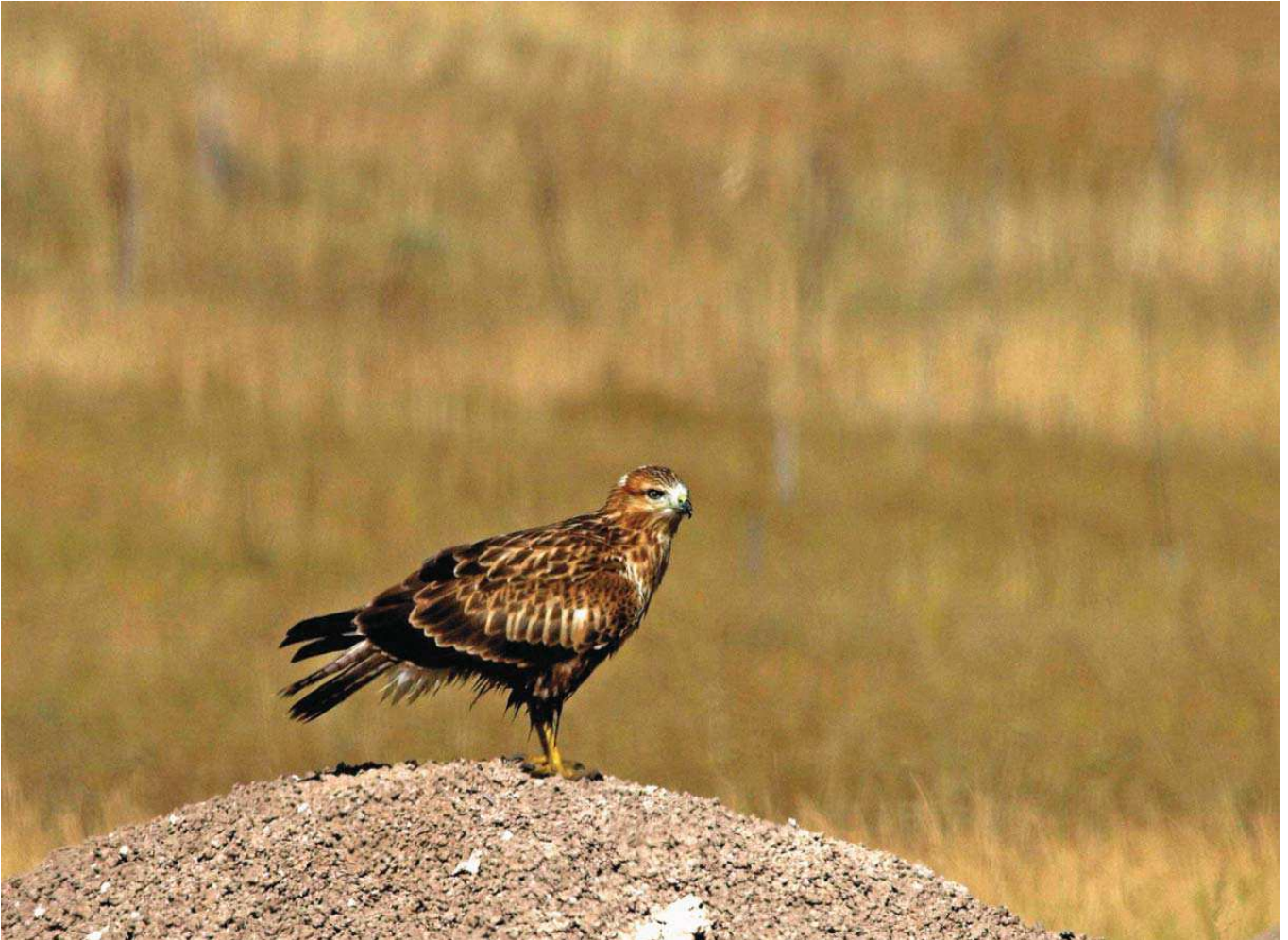
Kızı şahin ( Buteo rufinus )