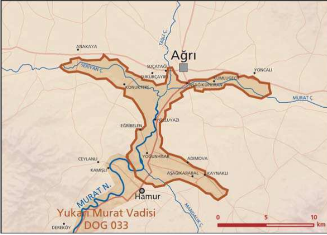
Ağrı Ovası önemli doğa alanı topografya haritası