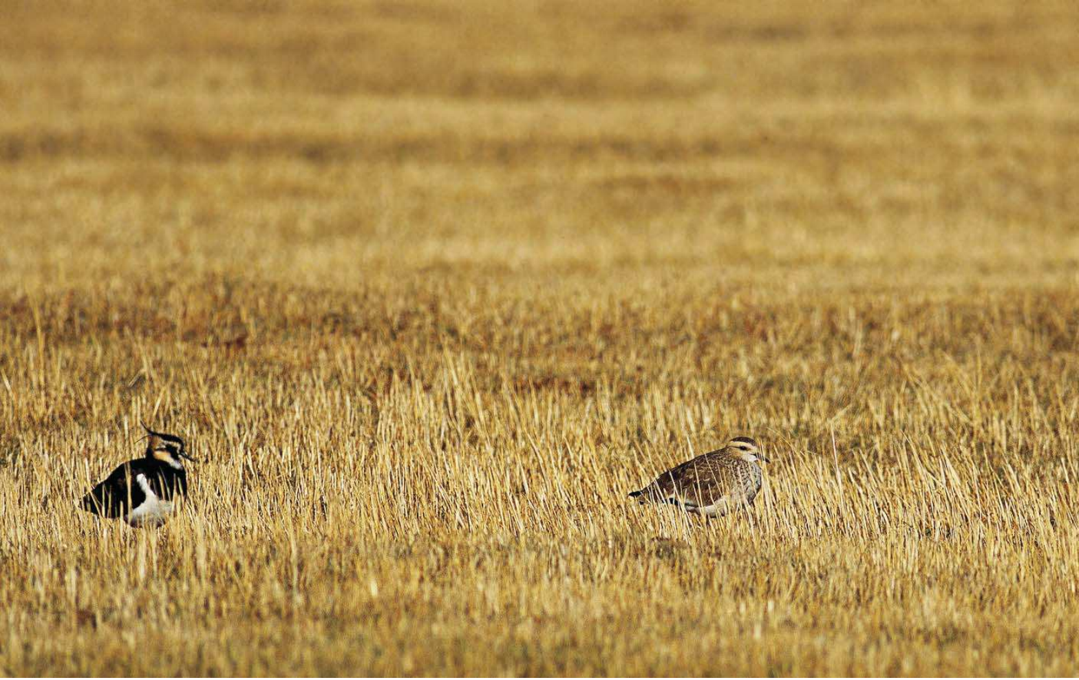
Sürmeli kızkuşu ( Vanellus gregarius )

Yüzölçümü : 7653 ha Boylam : 43,02°D Enlem : 39,68°K Koruma Statüleri : Yok Yükseklik : 1600 m - 1790 m İl(ler) : Ağrı İlçe(ler) : Ağrı merkez, Hamur