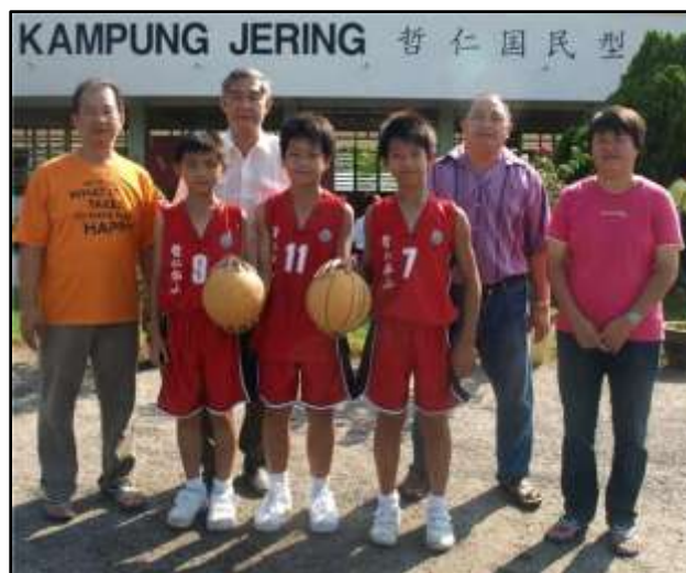
图表 13 - 哲仁华小男篮队在 2011 年再次夺冠

哲仁华小目前有十七名教师，其中包括一名校长和三位副校长；育有大约 194 名学生。