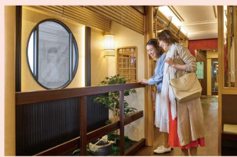
2号車と5号車には坪庭が