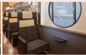
電車には珍しい円窓も登場