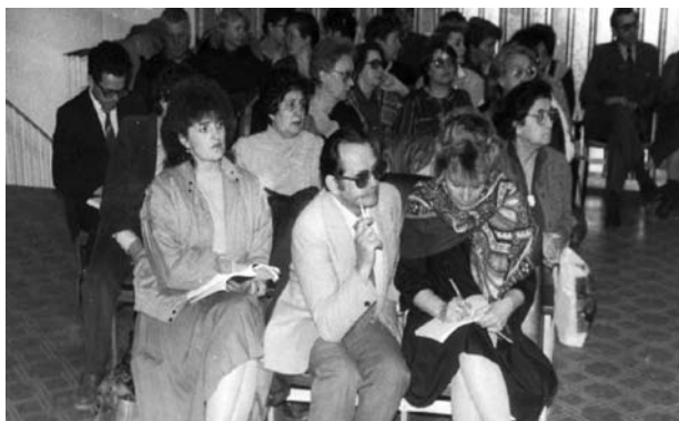
Первая школа-семинар по фониатрии, ВДНХ, 1987 г.