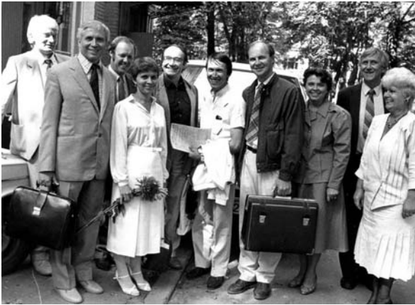
Семинар по видеостробоскопии, Москва, 1988 г.

Советского Союза была зарегистрирована Ассоциация фониатров и фонопедов, председателем которой он являлся все годы её существования.