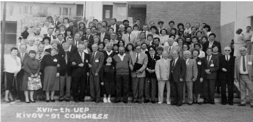
Участники XVII UEP конгресса в Киеве