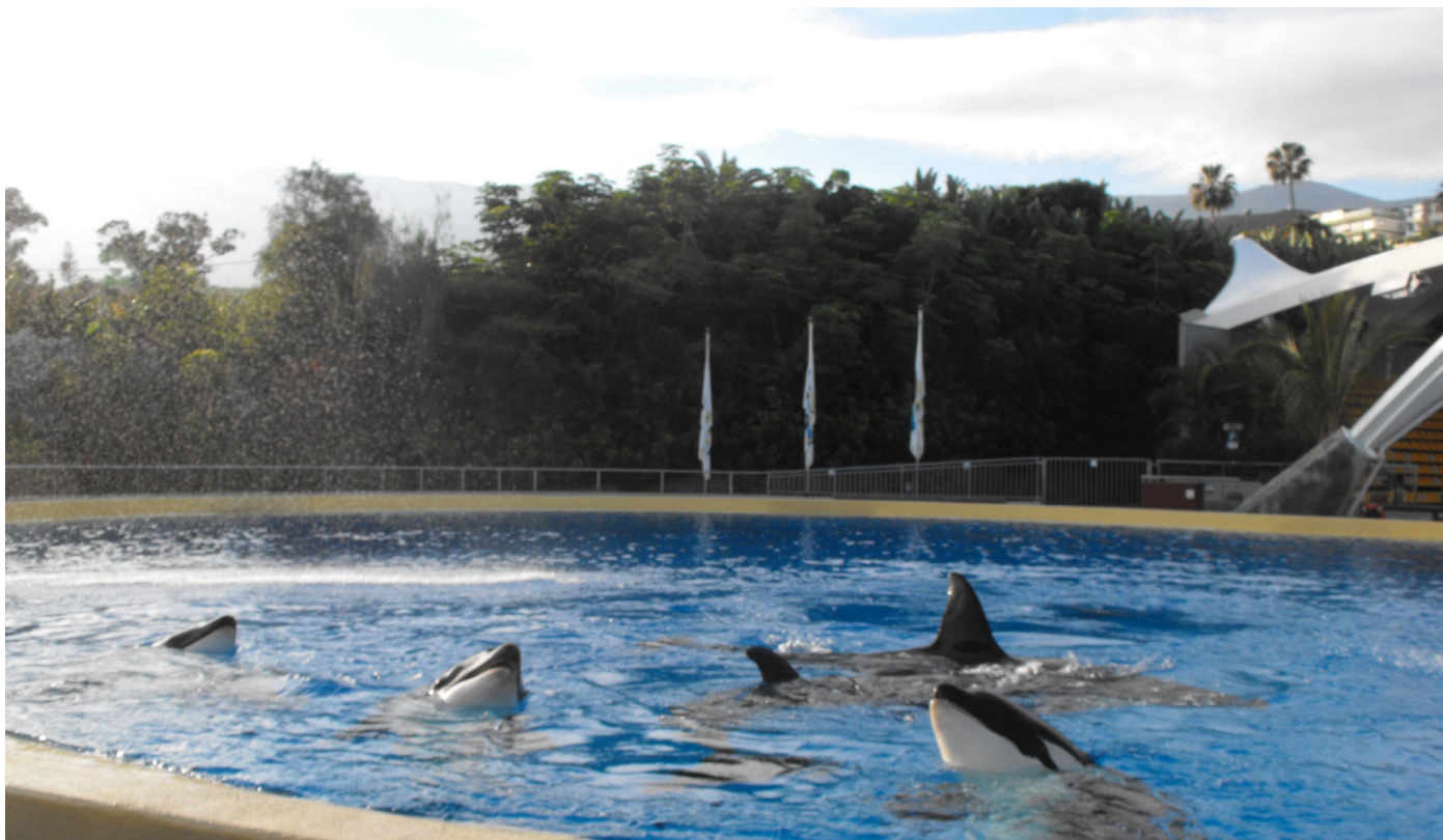
Reunión de los seis ejemplares de Orca Ocean. A pesar de que no aparecen todos en la foto los seis ejemplares estuvieron compartiendo las piscinas B, C y médica, moviéndose libremente con todas las puertas de conexión abiertas.