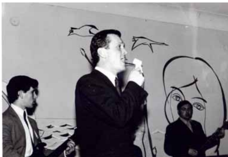
Поэт Синческул Л. «... поля изрытые лежат, осиротело смотрят в небо...»