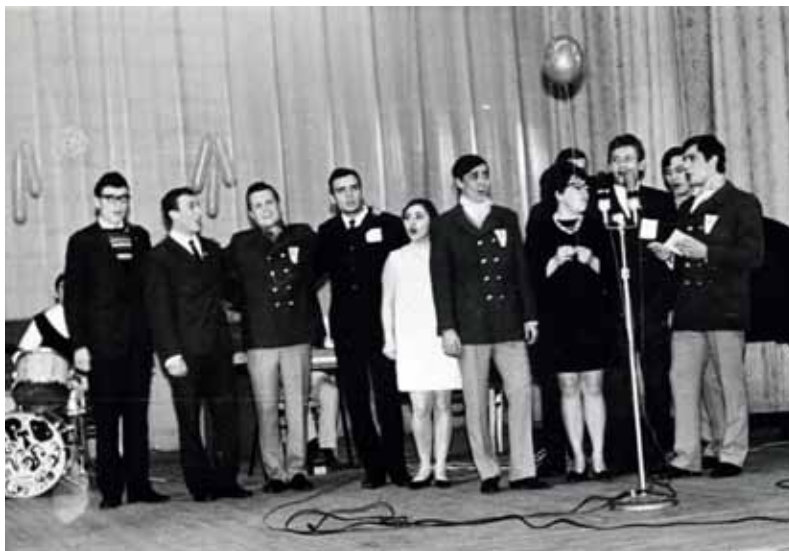
Участники художественной самодеятельности коллектива «Романтика» исполняют песню «Новый год настанёт, с Новым годом, с Новым счастьем!...».