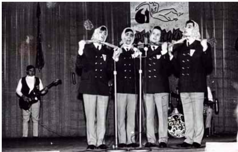
26.12.1969 г. ДС XIII. Квартет «Ритм» исполняет «... не гадайте, девочки, зазря: кому вечер, а кому заря!?! Если парень фото просит – это, значит, ...»