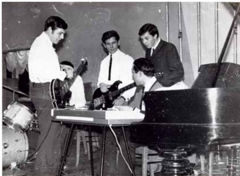
Репетиция ансамбля. Выбор лучшей аранжировки всегда рождался в муках