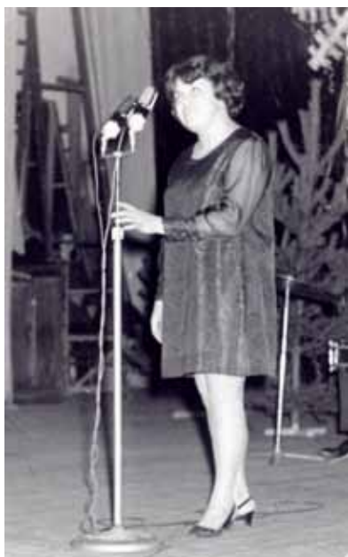
Григорьева Г. «Так, уж, бывает, Так, уж, выходит: Кто-то теряет, а кто-то находит ...»