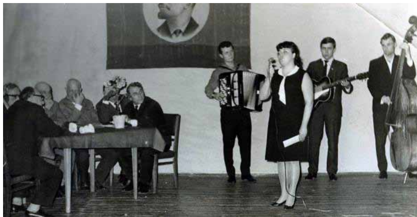
Чествование юбиляров (50 лет в КПСС) «Я люблю тебя жизнь... Я люблю тебя снова и снова...»