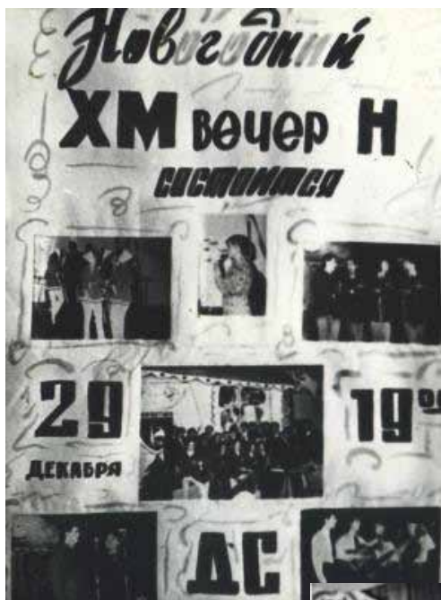
Афиша о Новогоднем вечере в ДС XIII 29.12.1969