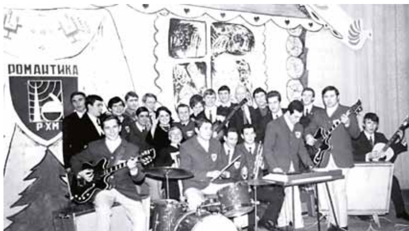
На этой фотографии представлена наша дорогая сердцу « Романтика» (к сожалению, далеко не в полном составе):