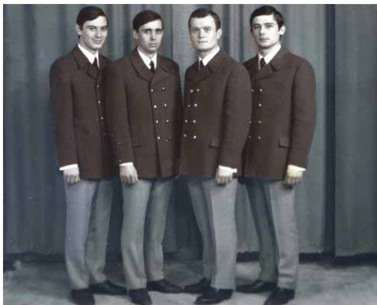
Таланты ХМ — квартет «Ритм», лауреаты ВДНХ СССР