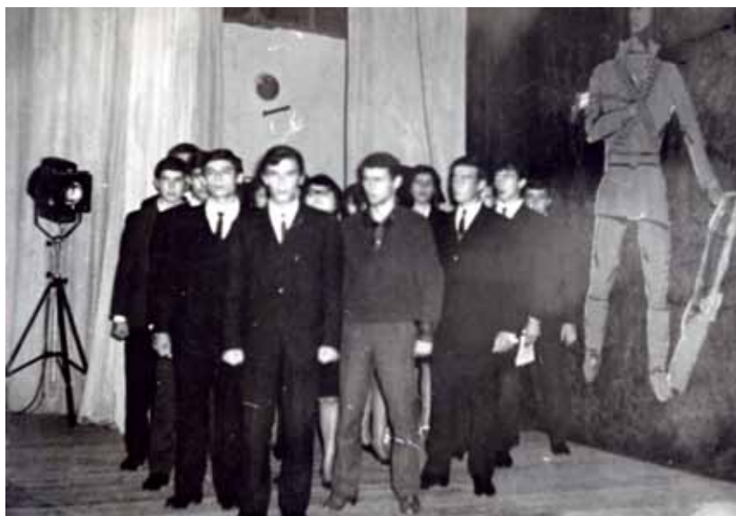
Инсценировка песен времён Гражданской и Великой Отечественной войн «Ах, война, что ты сделала подлая, Стали тихими наши дворы ...»