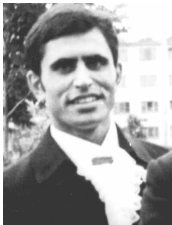
Глухов Алексей — главный фотолетописец объединения «Романтика»