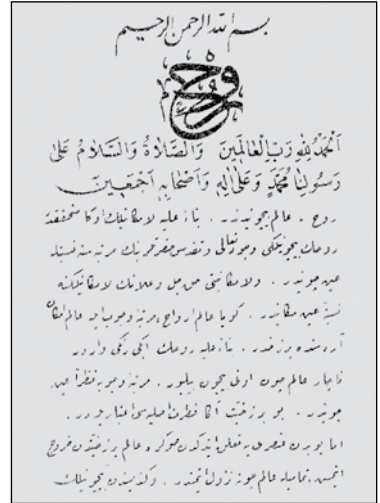
Hattat Halim Özyazıcı tarafından istinsah edilen Abdülhakim Arvâsî'nin "Rûh" isimli eserinin birinci sayfası.

Abdülhakim Arvâsî'ye göre tasavvuf; ilmî, zevkî ve vicdânî bir husûs olduğundan dolayı şânına lâyık bir şekilde insanların anlayacağı bir dille ifadesi mümkün değildir. 65 Konuyla ilgili olarak Abdülhakim Arvâsî, şu örneğe yer vermektedir: Nasıl ki yemeğin lezzeti çatal ve bıçakla aranıp bulunamıyorsa, ona göre tasavvuf da akılla tam olarak kavranamaz. 66 Bu mânâda "sûfî" kelimesinin menşeiini gönlün bütün yabancı unsurlardan arındırılarak ilâhî zikirle donatılması ve böylece kalbin safâsını kazanması olarak açıklamaktadır. 67 Kısaca ona göre tasavvuf, sûfnin beşerî sıfatlardan çıkıp melekî sıfatlara bürünmesi ve böylece en yüce ilâhî ahlâka sahip olmasıdır. 68