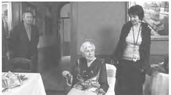
Ili néni köszöntése a 90. születésnapján

– Szóval Franciaországban édesapám nagyon sok mindennel foglalkozott. Mikor én születtem, egy elektromos szolgáltató műnél dolgozott, kaptak egy szolgálati lakást is. Ez lett a szülőházam, mivel kórházi ellátás nem nagyon volt annak idején, bába segített a világra, szép, erős gyermek voltam. Szüleim a kis házzal kaptak egy földterületet is, ott három évig gazdálkodtak. Apám saját maga csinált keltetőgépeket, a kiscsirkék, majdnem a kezünkben születtek. Imádtuk őket a bátyámmal együtt.