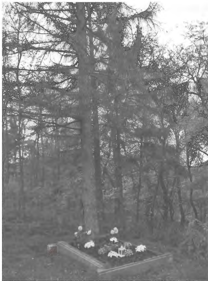
Ili néni édesanyjának sírja a fenyőfákkal. Sötét kabátjában vaddisznónak vélte egy orvvadász

lajdonképpen, hogy a magyarok honnan jöttek, kifélék és hogy mi is az a Budapest.