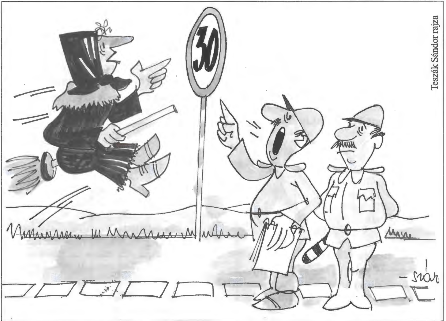
Tészák Sándor rajza

Nevezni lehet bármilyen levessel, főétellel, süteménnyel, aminek pontos leírását eljuttatják hozzánk, olyan módon, hogy a Területi Szociális Szolgálat bármelyik idősek klubjában zárt borítékban átadják a leírást a gondozónőknek, vagy a klubvezetőnek. Kérnénk, hogy a borítékban, a recept mellett tüntették fel a nevüket, címüket, és ha van, akkor a telefonszámukat is, és az is jó lenne, ha tudnánk, hogy a közeljövőben mikor tervezik az ételt (valamilyen családi alkalomból) elkészíteni. Olyan pontos leírást kérnénk, hogy annak alapján bárki, aki ismeri a konyhai technológia alapvető fogásait, az ételt elő tudja állítani. A legjobb recepteket lapunkban folyamatosan közreadjuk, és bemutatjuk azt az alkotó-olvasónkat is, aki a receptjét közkinccsé tette.