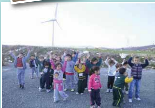
Επίσκεψη σε αιολικό πάρκο με ανεμογεννήτριες