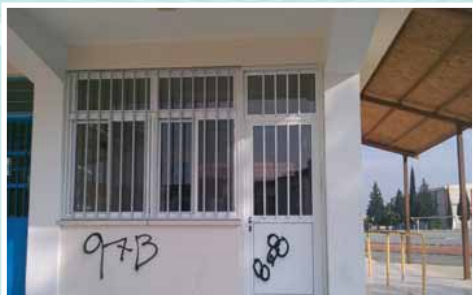
Βανδαλισμοί στις τουαλέτες και στο κυλικείο