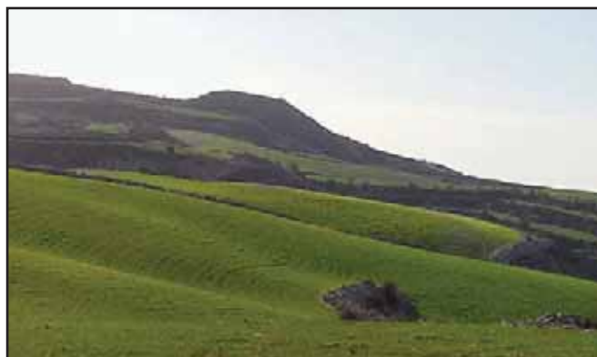
Η Αθηνών καταπράσινη!