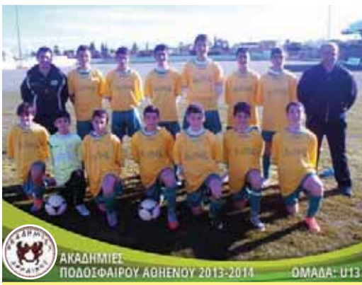
ΑΚΑΔΗΜΙΕΣ ΠΟΔΟΣΦΑΙΡΟΥ ΑΘΗΝΟΥ 2013-2014 ΟΜΑΔΑ: U13