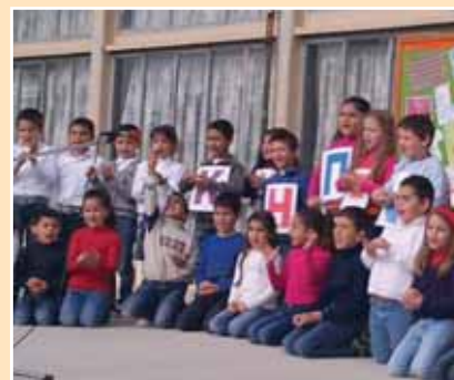
Από τα εκπαιδευτήριά μας > σελ. 8-12