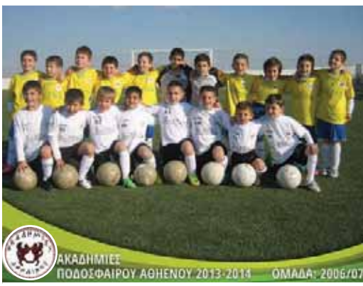
ΑΚΑΔΗΜΙΕΣ ΠΟΔΟΣΦΑΙΡΟΥ ΑΘΗΝΟΥ 2013-2014 ΟΜΑΔΑ: 2006/07