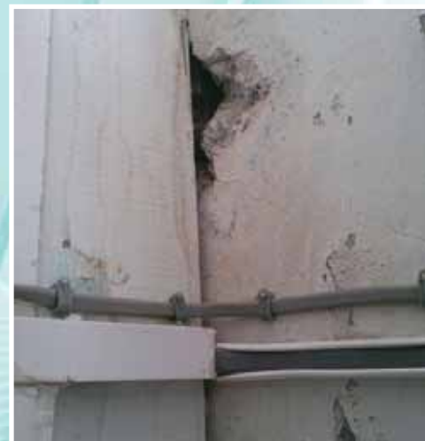
Ρωγμή στον τοίχο της αποθήκης εποπτικών μέσων

Σε διάφορα σημεία του σχολείου υπάρχουν ρωγμές και σαθρά μπετόν. Οι λεπτές κολώνες στους στεγασμένους διαδρόμους, πιθανόν, να χρειάζονται στύλους αντιστήριξης, σύμφωνα με εισήγηση που έγινε από τον πολιτικό μηχανικό του δήμου, τον οποίο ευχαριστούμε θερμά, σε επί τόπου επίσκεψή