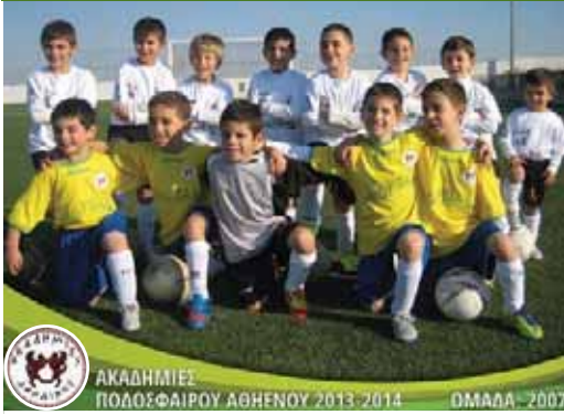
ΑΚΑΔΗΜΙΕΣ ΠΟΔΟΣΦΑΙΡΟΥ ΑΘΗΝΟΥ 2013-2014 ΟΜΑΔΑ: 2007