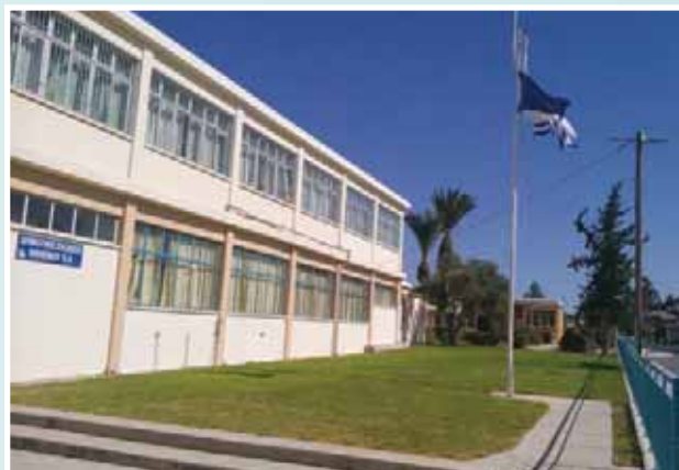
Πρόσοψη Δημοτικού Σχολείου Κ.Α'

του καινούριου εξατάξιου Α' Δημοτικού Σχολείου Αθηνών και της Κλειστής Αμφιθεατρικής Αίθουσας Εκδηλώσεων, με αποτέλεσμα να συνεχίζεται η χρήση του παλιού κτιρίου, παρά το γεγονός ότι κρίθηκε κατεδαφιστέο και οι ενδοσχολικές εκδηλώσεις εξακολουθούν να υλοποιούνται υπαίθρια. Από το 2006 εκκρεμεί γραπτό αίτημα των