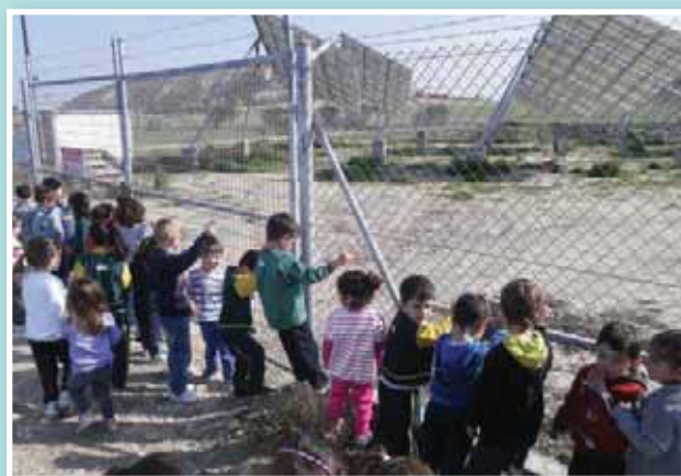
Επίσκεψη σε πάρκο με φωτοβολταϊκά