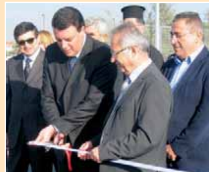
Εγκαίνια δυτικού περιμετρικού δρόμου > σελ. 5