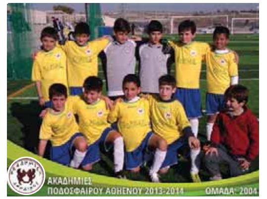
ΑΚΑΔΗΜΙΕΣ ΠΟΔΟΣΦΑΙΡΟΥ ΑΘΗΝΟΥ 2013-2014 ΟΜΑΔΑ: 2004