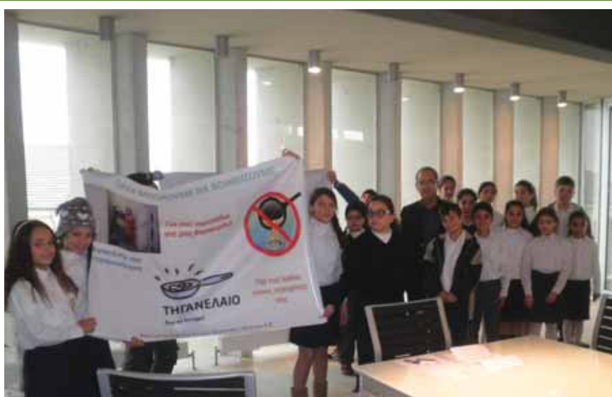
Τα παιδιά παραδίδουν στο Δήμαρχο τις αφίσες που έφτιαξαν