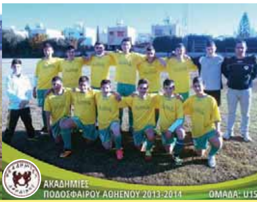
ΑΚΑΔΗΜΙΕΣ ΠΟΔΟΣΦΑΙΡΟΥ ΑΘΗΝΟΥ 2013-2014 ΟΜΑΔΑ: U15

Το Διοικητικό Συμβούλιο των ΑΚΑΔΗΜΙΩΝ ΑΘΗΝΟΥ, ευχαριστεί για την πολύτιμη χορηγία προς τις ΑΚΑΔΗΜΙΕΣ. Η προσφορά αυτή φανερώνει αμέριστη αγάπη και ενδιαφέρον για τον αθλητισμό και αποτελεί ιδιαίτερη τιμή για τις ακαδημίες γιατί ενισχύεται η προσπάθειά μας για την ανάπτυξη και επίτευξη του αθλητικού ιδεώδους. Ιδιαίτερα οφείλουμε να ευχαριστήσουμε τους Μεγάλους μας χορηγούς που είναι οι πιο κάτω εταιρείες: