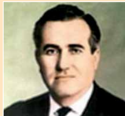
Αθηναίτες & πολιτειακά αξιώματα > σελ. 14-15