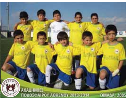
ΑΚΑΔΗΜΙΕΣ ΠΟΔΟΣΦΑΙΡΟΥ ΑΘΗΝΟΥ 2013-2014 ΟΜΑΔΑ: 2005