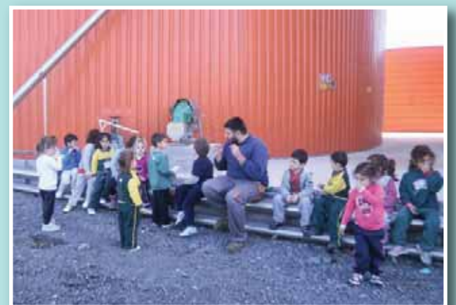
Επίσκεψη σε μονάδα παραγωγής ενέργειας