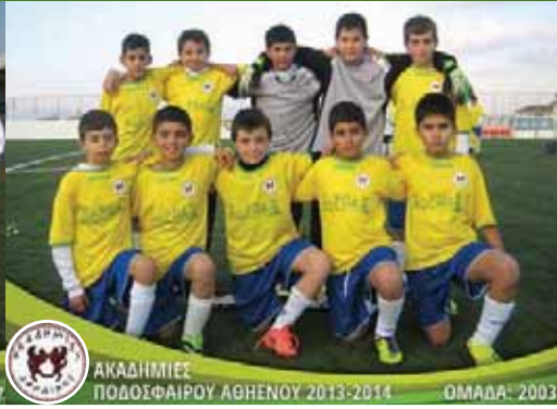
ΑΚΑΔΗΜΙΕΣ ΠΟΔΟΣΦΑΙΡΟΥ ΑΘΗΝΟΥ 2013-2014 ΟΜΑΔΑ: 2003