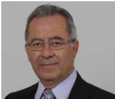
Δημήτρης Παπαπέτρου Δήμαρχος

Πέρασε μια χρονιά σκληρής λιτότητας που ο λαός μας βρέθηκε μπροστά σε πρωτόγνωρες ταλαιπωρίες, που η πρόσφατη ιστορία του ανθρώπου δεν έχει προηγουμένως καταγράψει.