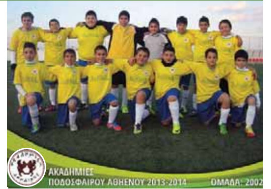
ΑΚΑΔΗΜΙΕΣ ΠΟΔΟΣΦΑΙΡΟΥ ΑΘΗΝΟΥ 2013-2014 ΟΜΑΔΑ: 2002