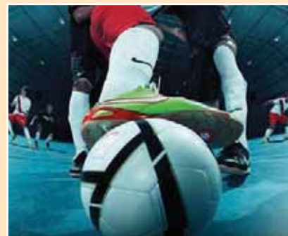
Αθλητικές δραστηριότητες > σελ. 26-27