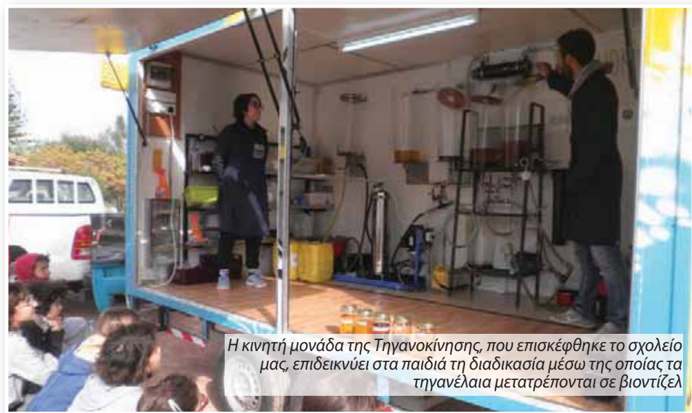
Η κινητή μονάδα της Τηγανοκίνησης, που επισκέφθηκε το σχολείο μας, επιδεικνύει στα παιδιά τη διαδικασία μέσω της οποίας τα τηγανέλαια μετατρέπονται σε βιοντίζελ

Τα παιδιά του τμήματος Ε1 του Δημοτικού Σχολείου Αθηνών Κ.Β΄