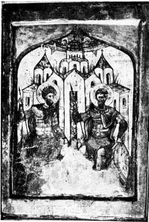
Sl. 6. Longin — ikona sv. Teodora Tirona i Teodora Stratilata

dvojne ikone. Prva sa pretstavama Raspeća i Skidanja s krsta, a druga sa pretstavama Preobraženja i Silaska sv. Duha.