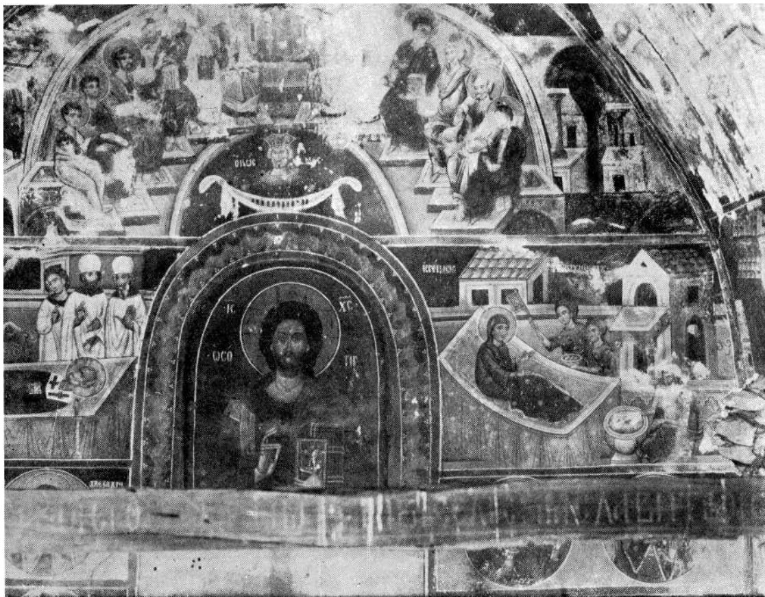
Sl. 3. Zapadni zid priprate manastira sv. Nikole Topličkog. Rad Jovana zografa

izmenio sam svoj prilično simplicitički ranije dati zaključak. Naime, iako se u živopisu crkve i njenih paraklisa jasno izdvajaju ruke dvojice pa i trojice slikara, stilizacija natpisa, koji me je naveo da pripisem jedan deo živopisa kir Dmitru, nije dovoljno jasna. Rečenica natpisa »Dmitr se potruđi i popisa« zaista ne mora označavati slikara. Stiče se i drugi utisak o kome se mora voditi računa, naime, da se ona može tumačiti i kao da se Dmitar potruđio i dao popisati crkvu. Ovo pitanje za mene ostaje još uvek otvoreno, i, mada više nisam onako kategoričan u svom stavu, ipak mi se čini da postoji i dobar deo elemenata koji ne dozvoljavaju da se ovo ime sa gotovošću i sigurnošću izbriše iz kruga naših slikara prve polovine XVI veka, te smatram da ga baš u vezi ispravnog rada na budućem istraživanju i proučavanju naših majstora ovoga vremena moramo dalje imati u vidu.