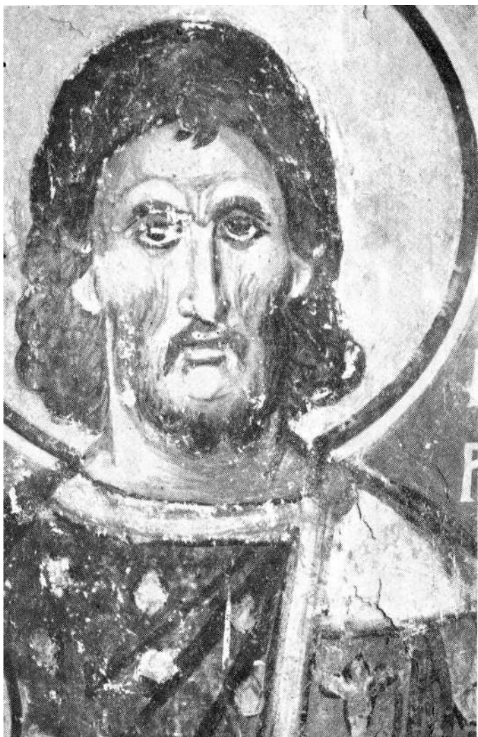
Sl. 2. Glava sveca ratnika iz manastira Ravanice

karstva. Lično bih još više podvukao njegovu izrazitu individualnost. Likovi njegovih svetitelja, specijalno, pokazuju punu slobodu tretmana i tako lični doživljaj kakav se ni izbliza ne nalazi u našem suvremenom slikarstvu (sl. 2). U vezi s ovim majstorom prof. Radojčić nije dovoljno istakao jednu važnu činjenicu, da se Konstantinov uticaj ne nalazi samo na delima naših umetnika u zemlji, nego i na velikim slikarskim celinama u inostranstvu. V. N. Lazarev ( История византийских живописи, Москва 1947. Т. I, 240, 246. Isti, Живопись и скульптура Новгорода и Ист. Русс искусства, Т. II, Москва 1954, 196, 202, 206 ), ponovo još odlučnije nego stariji pisci (Мацулевић, Порфиридов, Некрасов i dr.) tvrdi da se živopis u Kovaljevu i crkvi Blagoveštenja na Gorodišču ima vezati za južnoslovensku umetnost, specijalno srpsku, a posebno za Ravanicu. Po Lazarevu, u Novgorod su došli ili srpski obrasci ili srpski majstori.