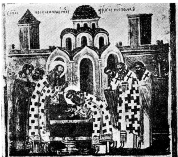
Sl. 7. Zograf Kozma — detalj sa ikone sv. Save i Nemanje u manastiru Morači

U tom pogledu treba izvršiti i detaljno proučavanje ikona zografa Mitrofana koje se nalaze u manastiru Blagoveštenju Kablarskom. Specijalno ikone Raspeća i Vaznesenja pokazuju osetan Longinov uticaj.